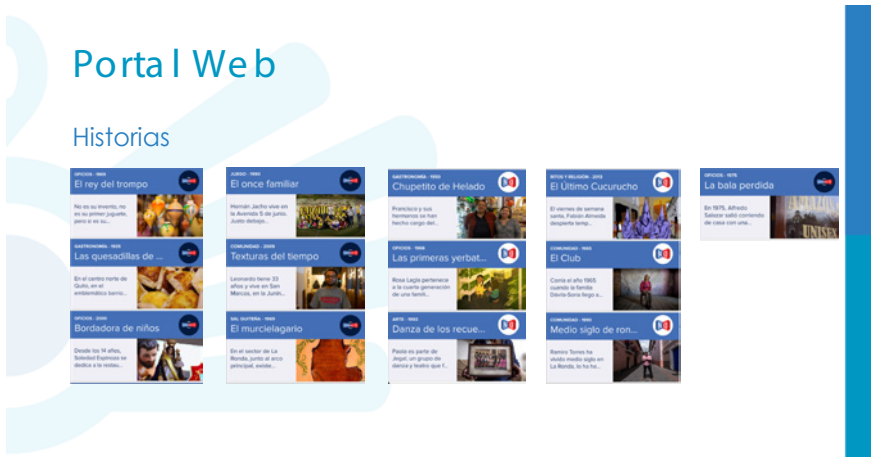
Figura 1. Portal web de Narra Quito

Los contenidos multimedia -que son historias- se encuentran expresados mediante recursos visuales, tales como: animación, locuciones y fotografía, grabaciones de audio -llamados podcast-, y hasta videos sencillos, grabados incluso con teléfono celular. Se procura que la mayoría de ellos sean incorporados en forma colaborativa por los propios habitantes, para lo cual se ha facilitado un acceso amigable y tutoriales para su ejecución.