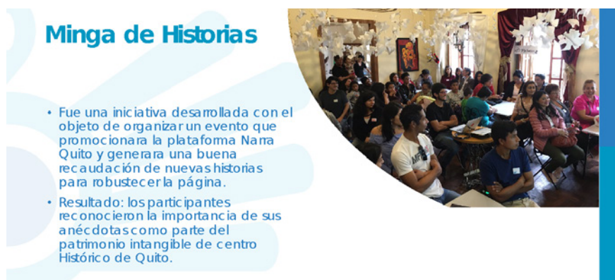
Figura 2. Minga de historias

Valoramos que la posibilidad de contar historias fomente la continuidad de las tradiciones quiteñas y el aprendizaje intergeneracional, como indica Rincón (2008): “somos sujetos y tenemos identidad en la medida en que podamos narrarnos” (p. 223).