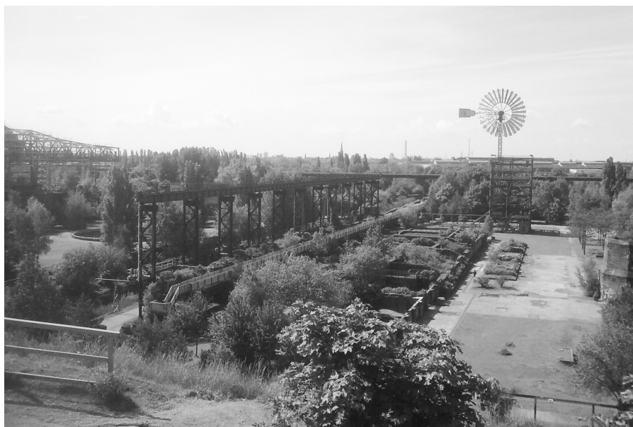
Duisburg-Nord Park, Parque Duisburg-Nord en la actualidad . Paisaje del pasado y de la memoria industrial, 2013.