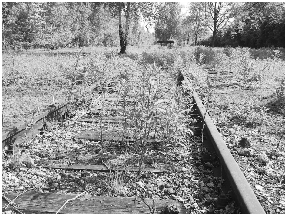
Duisburg-Nord Park, La naturaleza conquista los espacios vacíos de la huella de la vía de tren , 2013.