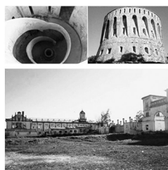
Plano de rutas por la red patrimonial. Imágenes: interior del reducto de Arangure, reducto de Mendizabal y Dar Riffien.