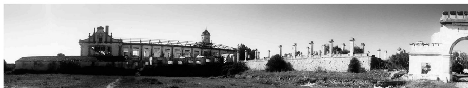
Volumetría y fotografía del cuartel Dar Riffien.