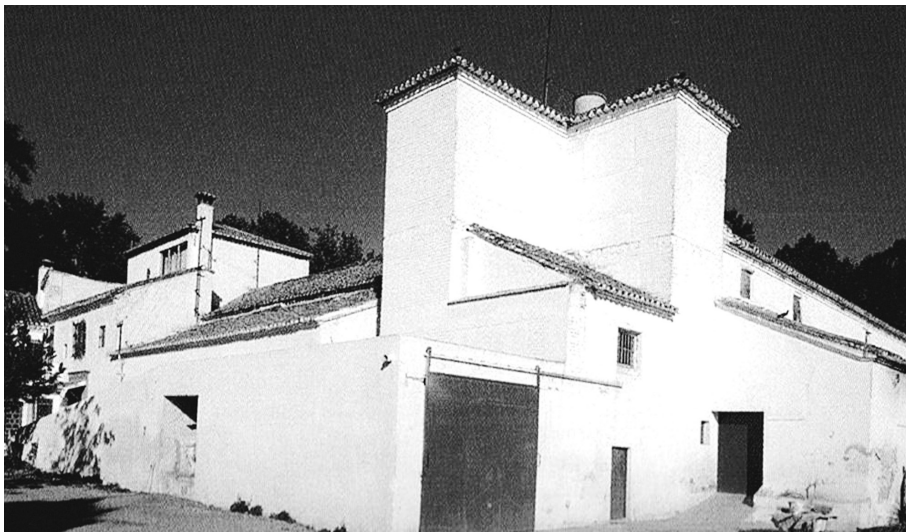
Eduardo Zurita, Vista exterior del Cortijo de El Alitaje a finales de los noventa del siglo XX (Fuente: Eduardo Zurita et al., Cortijos, haciendas y lagares. Arquitectura de las grandes explotaciones agrarias. Provincia de Granada , Sevilla, Consejería de Obras Públicas y Transportes, Junta de Andalucía, 2003)