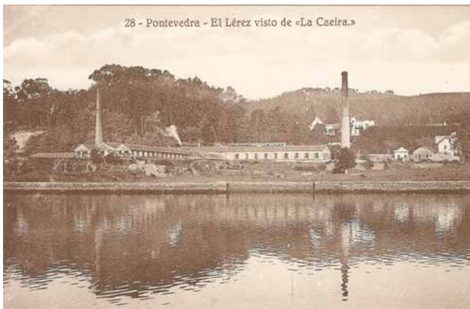
Figura 1: Quinta de Riestra, A Caeira, Poio

En paralelo a sus actividades como banquero, empresario y político, Riestra prolongó la pragmática actitud de su padre, quien desde mediados del XIX fue ampliando la sobria casona neoclásica al ritmo que aumentaba su descendencia. 6 Ni siquiera era necesario difundir imágenes de una finca abiertamente expuesta a los ojos de sus conciudadanos por su emplazamiento mirando al centro urbano de Pontevedra, accesible a todos los que quisieran surtirse de plantas en la granja modelo arrendada a la Diputación de Pontevedra entre 1873 a 1886, o visitar la capilla dedicada a San Antonio durante su popular romería. De hecho la percepción de la dominante posición de la casa –y de su dueño– sólo se vió interferida por las chimeneas de la fábrica de cerámica que el marqués hizo construir en 1895. 7 Se anteponía así la imagen de una decidida apuesta por la inversión industrial, tal como se recogió en las postales, incluso al precio de perjudicar el lugar de ocio más querido de un hombre que sólo quería ser reconocido como infatigable trabajador. 8