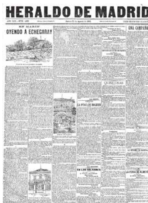
Figura 2: Villa Echegaray, Marín

villa ecléctica diseñada por el arquitecto provincial Antonio Crespo, asomada a la playa de O Tombo y con una galería con vistas a la ría como espacio preferido por el escritor. 9