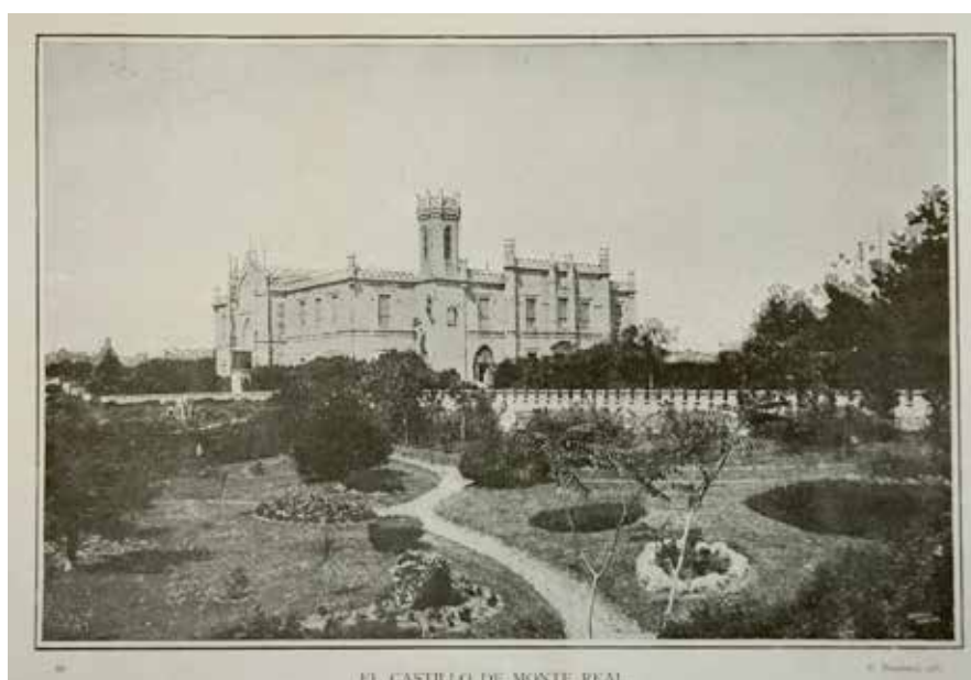
Figura 4: Castillo de Monterreal, Baiona