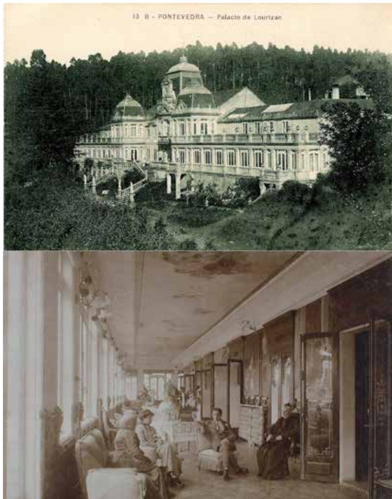
Figura 6: Palacio de Lourizán, Pontevedra

en dorado en el cierre al camino de Pontevedra. De aquellos años finales del siglo XIX arrancan las primeras imágenes divulgadas, aunque la arquitectura de la casa fue obviada para focalizar el interés en parque y jardín, con rincones publicados en La Ilustración Española y Americana en agosto de 1886. La vinculación con un lugar que Montero Ríos cuidaba hasta los últimos detalles se había hecho tan fuerte que en 1897 planeó construir una cripta para sepultura personal y de su familia, que todavía se conserva.