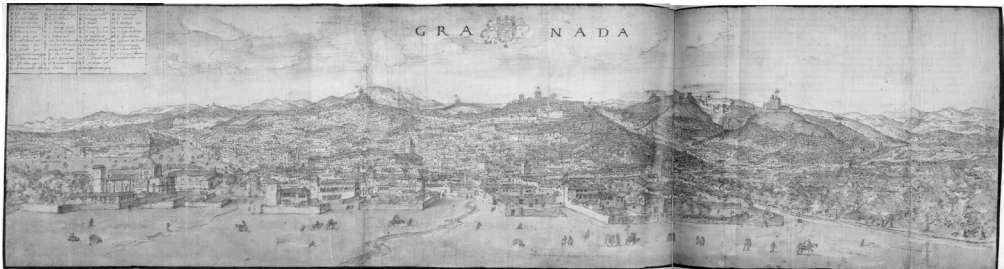
Anton Van den Wyngaerde, Vista general acabada de Granada , 1567