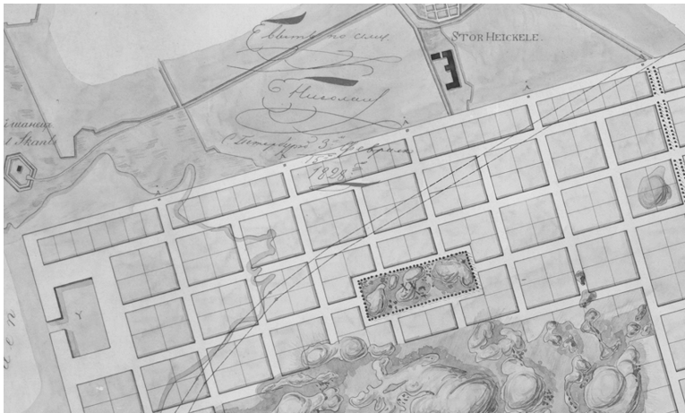
Carl Ludwig Engel, Piano di ricostruzione di Turku dopo l'incendio , stralcio, 1828.