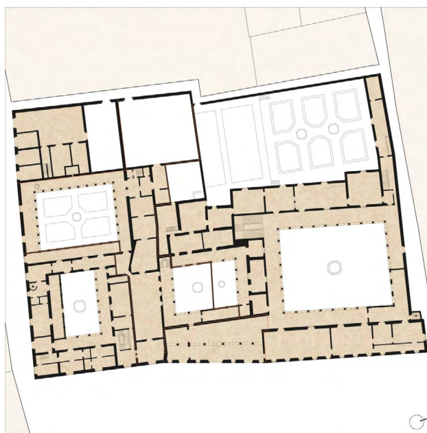
Figura 3: Palacio del Duque de Medina Sidonia en la Plaza del Duque, c. 1756 . Escala 1:750

La paradoja del creciente prestigio e influencia que adquirieron los duques de Medina Sidonia con operaciones como la de su palacio y plaza en Sevilla es que ese mismo ascenso social fue el que les impulsó cada vez más lejos de la propia ciudad. Así, el fenómeno del absentismo de la alta nobleza fue un hecho desde el momento en que la corte real dejó de ser itinerante y se estableció de manera fija en Madrid en 1561. Este vacío de poder permitió que diversas fuerzas trataran de capitalizar el potencial material y simbólico del Barrio del Duque para sus propios intereses.