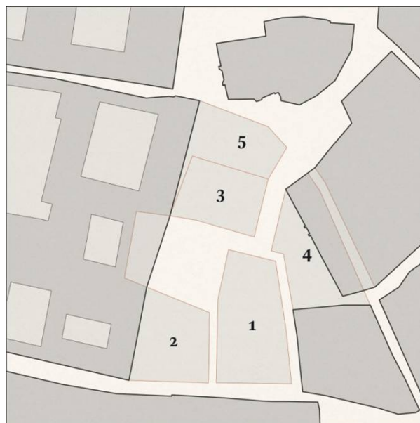
Figura 1: Evolución del entorno de la plaza del Duque entre 1442 y 1756 . Escala 1:2000 Leyenda (Áreas derribadas): 1. A mediados del siglo XV. 2. A partir de 1468. 3. c. 1500. 4. Con la construcción de la casa de los Cavaleri, datada en el siglo XVI. 5. c. 1579.

patio o, más ampliamente, de recinto. En cuanto a lo primero, los duques de Medina Sidonia defenderían siempre la posesión del espacio que habían creado, 5 y que les era reconocida aún en el siglo XIX. 6 Juntas, casa y plaza, constituyeron una unidad que se conoció durante toda la Edad Moderna como «Barrio del Duque».