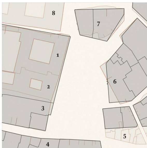
Figura 4: Evolución del entorno de la plaza del Duque entre 1756 y la actualidad. Escala 1:2000 Leyenda (Áreas derribadas) 1. Almacenes del Duque, 1965–66. 2. Casa de Miguel Sánchez-Dalp, 1967–68. 3. Colegio Alfonso X el Sabio, 1970. 4. Hotel Venecia, c. 1965. 5. Ensanche de La Campana, 1911–12. 6. Casa de los Cavaleri, 1963–65. 7. Teatro del Duque, a. 1959. 8. Cuartel de San Hermenegildo, 1957.