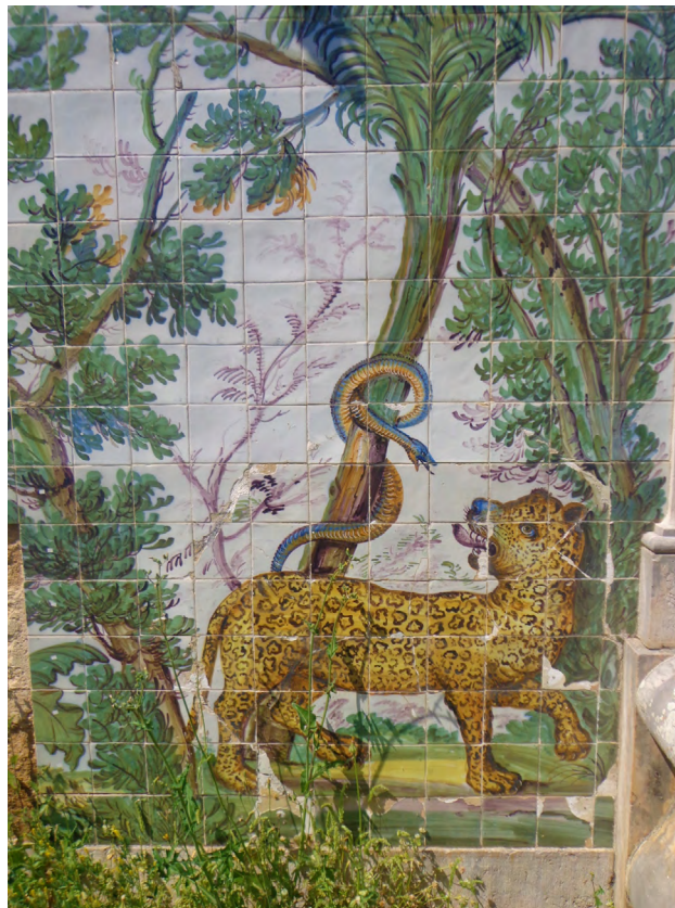
Figura 5: Detalle de azulejería de la Quinta Nova da Assunção (1863), Sintra (Belas)