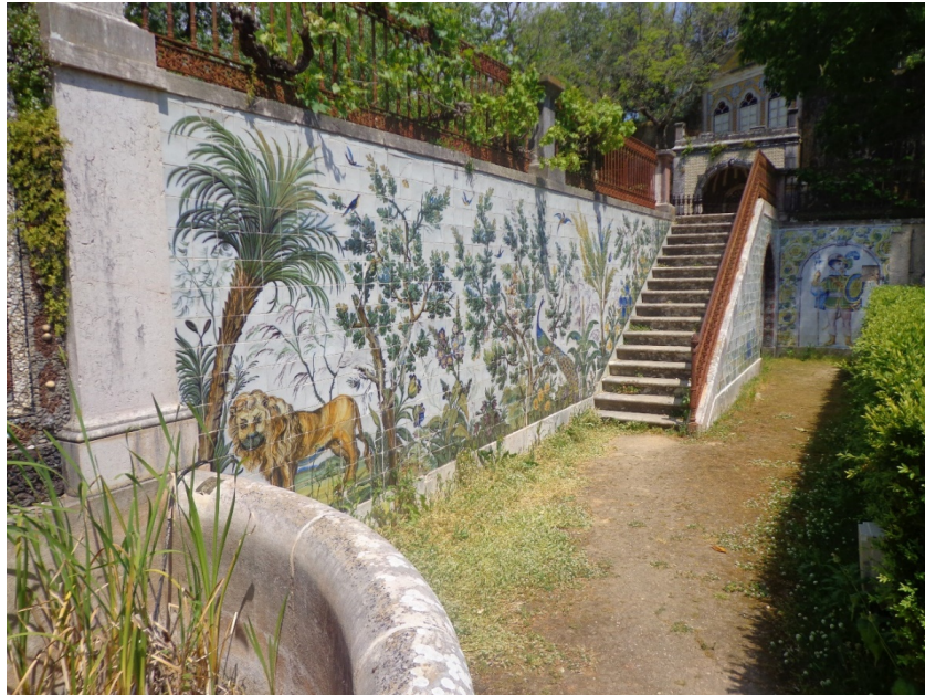
Figura 6: Detalle de azulejería de la Quinta Nova da Assunção (1863), Sintra (Belas)

esposa Maria da Assunção Vieira pudieran encontrar fácil acomodo estival. Quizás por ello la Quinta Nova da Assunção desprenda ese característico tono alegre, luminoso y colorido de los días soleados. Por desgracia y debido al caprichoso devenir de la fortuna, su propietario fallece, de manera prematura, al año siguiente de su inauguración, quedando así frustrado su gran proyecto vital, no así, a la vista está, su sueño artístico. 22