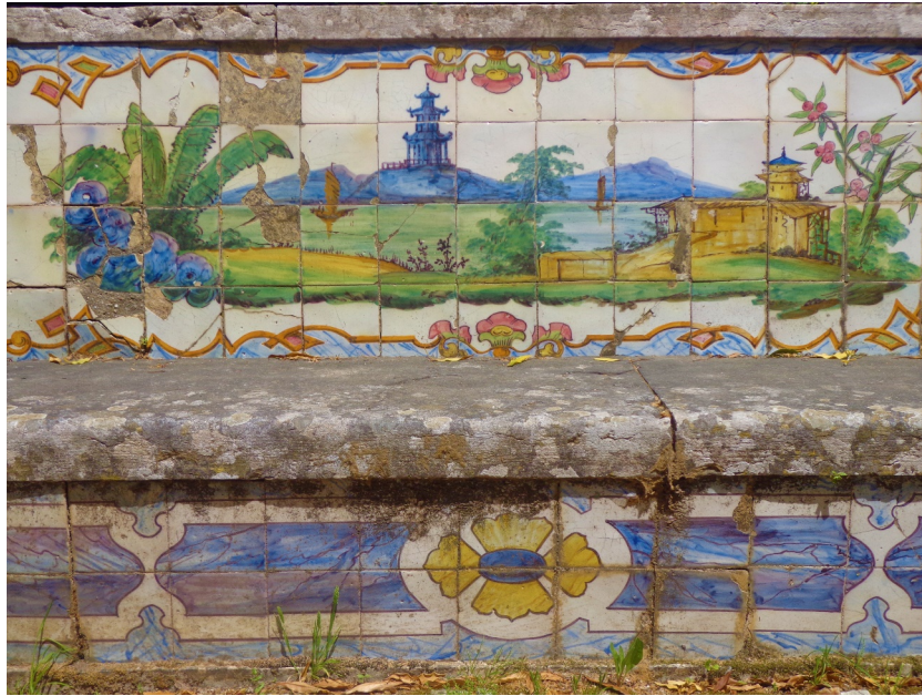
Figura 3: Detalle de azulejería de la Quinta Nova da Assunção (1863), Sintra (Belas)