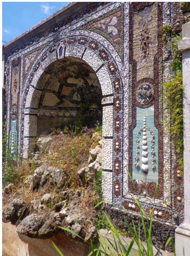
Figura 2: Detalle de fuente de la Quinta Nova da Assunção (1863), Sintra (Belas)

Hasta el más insignificante detalle parece estar perfectamente estudiado en Quinta Nova da Assunção . Así, las casas dedicadas a manutención agrícola y bodegas, se recubren del mismo fasto que los espacios nobles. Plantas exóticas, pájaros multicolor, y hasta una balastrada simulada, se retratan en la magistral azulejería de Luís das Tabuletas. Se trata de edificios secundarios, cuya acertada decoración, pretende mimetizarse con la naturaleza circundante del jardín. 21