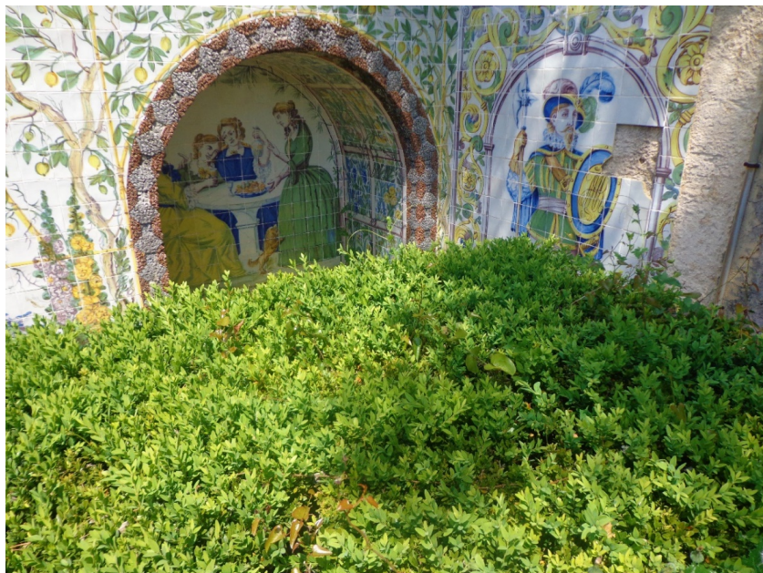
Figura 7: Detalle de azulejería de la Quinta Nova da Assunção (1863), Sintra (Belas)