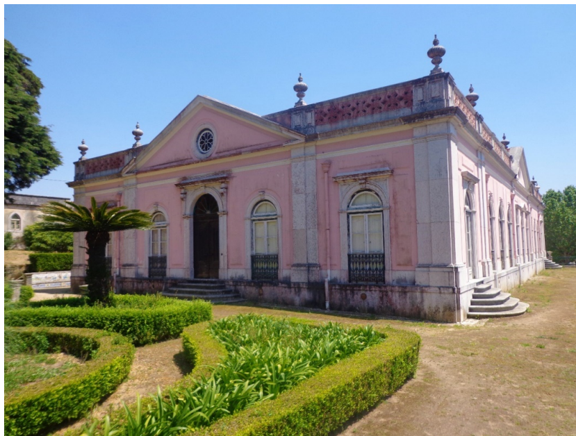
Figura 1: Casa principal de la Quinta Nova da Assunção (1863), Sintra (Belas)