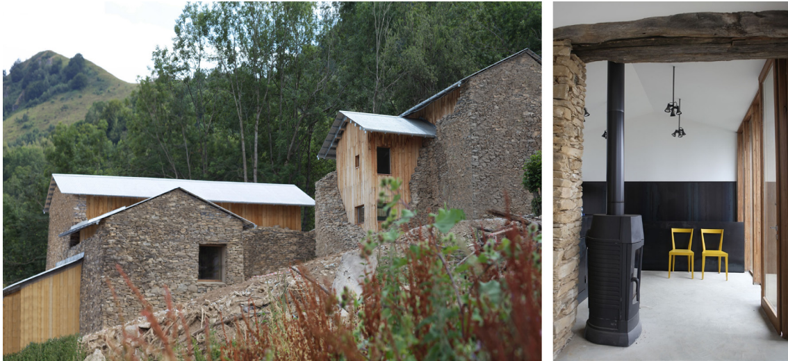
Figura 5: Refugio Paraloup (2014), Rittana, Italia