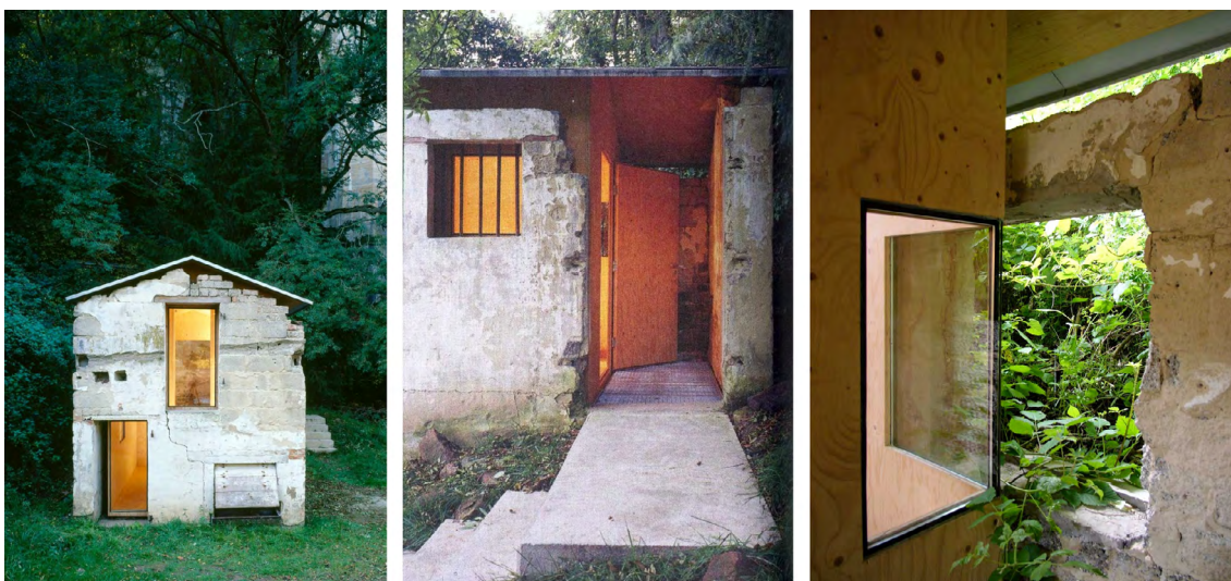
Figura 6: Rehabilitación S(ch)austall (2008), Pflanz, Alemania

La referida «actualización del habitar» encomendada al artefacto pasa por instalar usos, en ocasiones, realmente singulares y novedosos, muy alejados de la función primigenia del edificio; tales como pabellón expositivo ( Rehabilitación S(ch)austall ), estudio para ensayos musicales ( Dovecote studio ), o la miscelánea propuesta en Paraloup (albergue y espacio para encuentros y exposiciones, etc.). Tampoco la función residencial de la Casa en Tebra y de la Casa E/C tiene un carácter convencional. Todas estas transformaciones, por su peculiaridad, refuerzan la idea de la cápsula como contenedor de funciones contemporáneas, en contraposición con la ruina, que permanece como símbolo de los usos propios de un pasado agrícola. El injerto moderno, como obra nueva, debe cumplir con los requerimientos precisos para alcanzar un interior perfectamente acondicionado, en lo referido tanto a confort higrotérmico como a prestaciones tecnológicas, acústicas, lumínicas, etc.; más aún en estancias altamente especializadas.