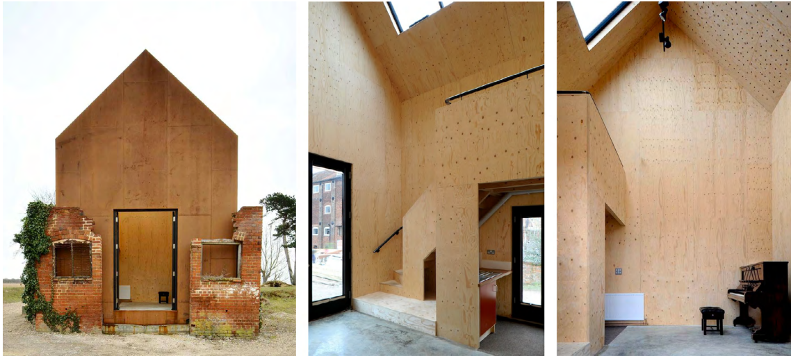
Figura 4: Dovecote studio (2014), Rittana, Italia

El mismo cuidado por acentuar el contraste temporal se advierte en la Rehabilitación S(ch)austall y en el Refugio Paraloup , en el que se utilizaron morteros inyectados en profundidad para consolidar los muros y la cubierta vuela para protegerlos.