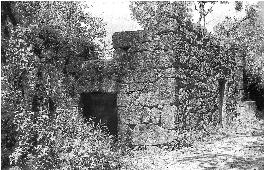
Figura 2: Casa en Gerês (1980). Vista de la ruina desde la carretera

Esta exaltación de la ruina como metáfora de decadencia y caducidad, es una actitud plenamente romántica. 5 La ruina de Gerês permanece como un elemento de contemplación, fascinante también en el otro sentido explicado por Diderot: 6 como un ejercicio memorístico, estimulante para el espectador; en las señales del deterioro percibe su antigüedad, adivina lo que fue y trata de recrearlo a través de la imaginación. Lo que falta, la mente lo reconstruye: lo crea o lo recuerda.