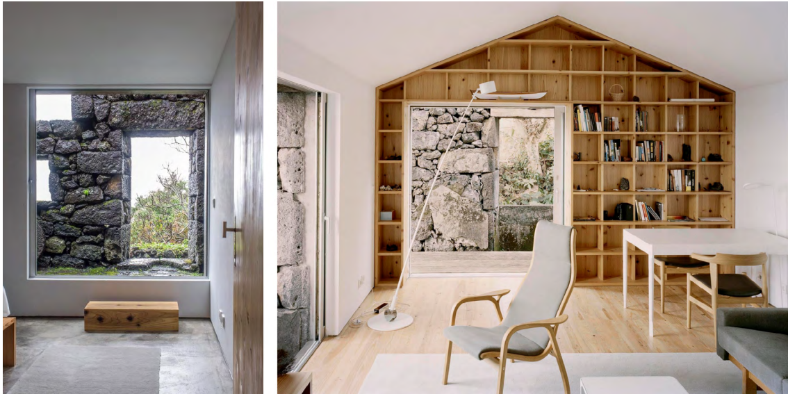
Figura 7: Casa E/C (2013), Azores, Portugal. Fuente: SAMI Arquitectos, fotografías de Paulo Catrica