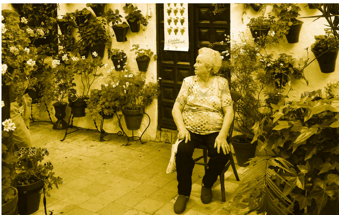
Figura 3: Imagen de un patio y su vida en la Axerquía de Córdoba

c) VIVIENDA Y ECONOMÍA SOCIAL Y SOLIDARIA: conformación de grupos de gobernanza y co-gestión compuestos por la ciudadanía, por agentes sociales y el sector público para constituir cooperativas de vivienda, que actualicen el valor antropológico de las casas de vecinos. En ellas se garantiza la disponibilidad de viviendas para colectivos en situación de emergencia social: refugiados y migrantes, mujeres víctimas de la violencia de género, etc..., así como elementos de apoyo para incentivar una red de economía cotidiana, ligada al mercado de la rehabilitación y la producción local.