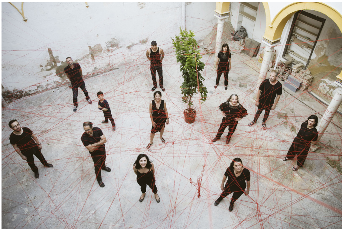
Figura 4: Equipo PAX en una instalación realizada para la XV Bienal Internacional de Arquitectura de Venecia

Es el valor social de la iniciativa que ha sido reconocido y desde 2018 forma parte de la Faro Convention Network del Consejo de Europa, en el marco de la Convención de Faro, 14 que asume el valor social del patrimonio, además de ser buena práctica por la Oficina de Economía social del Madrid.