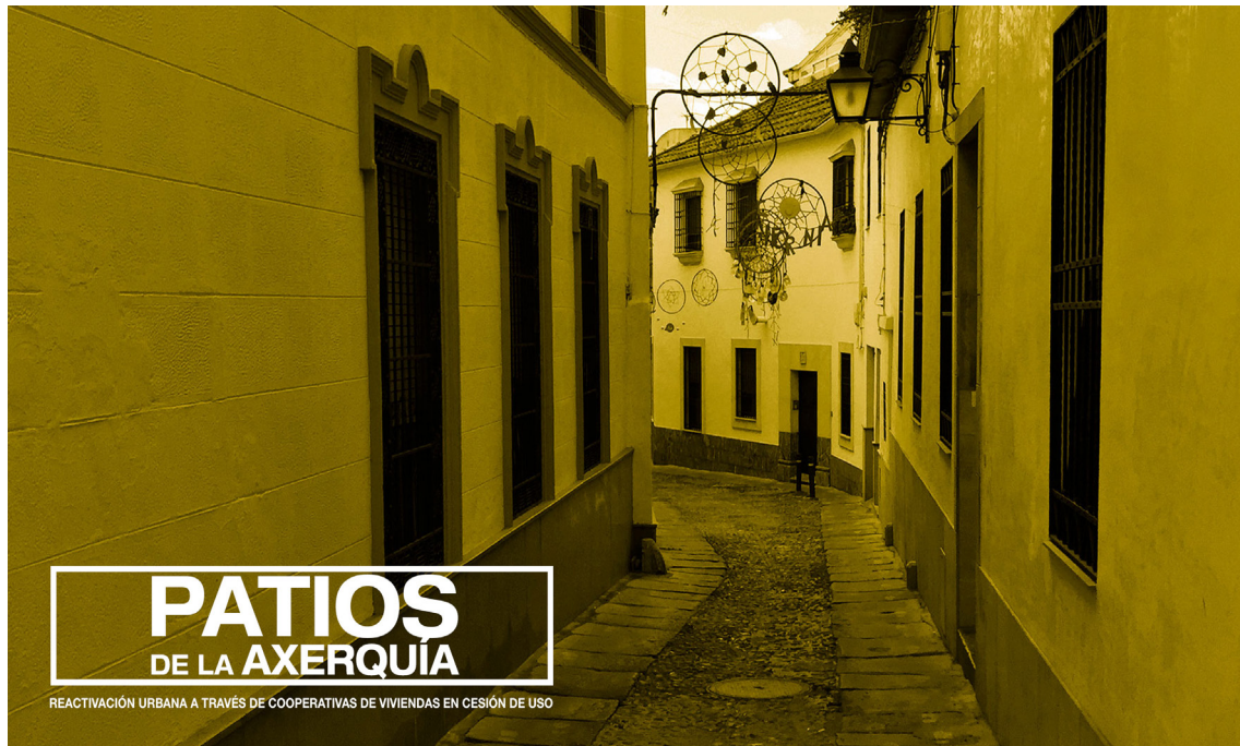
Figura 2: Imagen de la zona de la Axerquía de Córdoba

sugiere mecanismos de gobernanza que garanticen la rehabilitación y reactivación de este patrimonio arquitectónico y su valor inmaterial en un modelo de ciudad mediterránea. 10