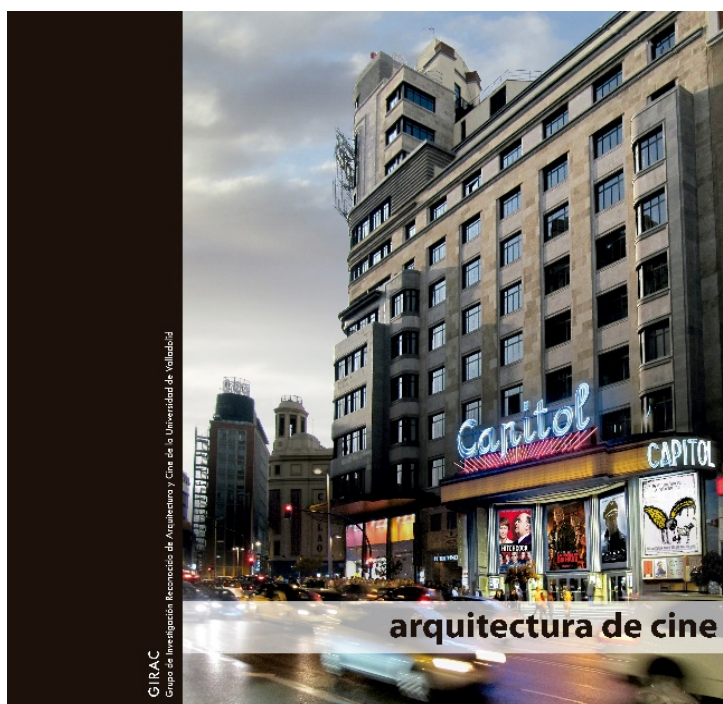
Figura 3: Portada del libro Arquitectura de Cine , editado por la Fundación DO.CO.MO.MO Ibérico, el GIRAC y la Universidad de Valladolid en 2016

A tenor de lo expuesto, cabe afirmar que patrimonio audiovisual y arquitectónico se retroalimentan mutuamente, argumento que el grupo Grupo de Investigación Reconocida de Arquitectura y Cine de la Universidad de Valladolid (GIRAC) 22 hace suyo. El compromiso adquirido con la diversidad del patrimonio cultural se enuncia desde la primera de sus líneas estratégicas y de investigación titulada «Espacios metodológicos comunes entre arquitectura y cine, relaciones, interferencias y simbiosis». 23