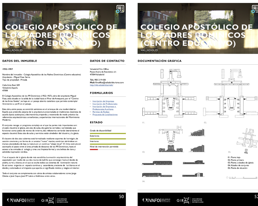
Figura 6: Ejemplos de fichas del catálogo Arquitectura y Cine para Valladolid aplicadas al caso de estudio.

tendría sentido formar parte del catálogo. A partir de ese punto, el GIRAC elabora una documentación que consta de datos básicos; fotografías, planos acotados y breve reseña histórica, orientados a comunicar las cualidades cinematográficas del inmueble, información que a su vez se difunde mediante la página web institucional de VAFO, obteniendo con ello un mayor reconocimiento, repercusión e impacto social.