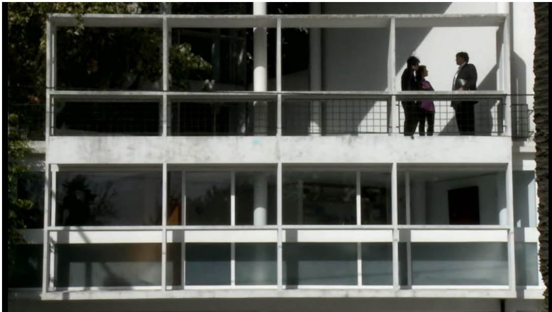
Figura 2: Fotograma de El hombre de al lado con la casa del Dr. Curutchet como protagonista

Por último, cabe mencionar la película argentina El hombre de al lado (2009) 20 , obra en la que la Casa del Dr. Curutchet (Le Corbusier, 1949-53) se convierte en el argumento y motor de la cinta. En este caso, el protagonismo no sólo recae en la casa, sino en toda la arquitectura moderna. El edificio se presenta como un icono del Movimiento Moderno donde los límites entre lo público y lo privado se ponen en crisis. La simple apertura de un hueco en el patio posterior de la casa plantea un conflicto entre vecinos que conecta visualmente dos mundos hasta ese momento separados por una medianera. El mundo de la sofisticada modernidad del propietario de la casa Curutchet , arquitecto, diseñador y defensor de las proclamas del Movimiento Moderno, chocan paradójicamente con la necesidad de su vecino de obtener más luz natural en su vivienda. Mientras que uno se protege del soleamiento gracias a los brise solei , el otro simplemente lo busca abriendo un hueco en su propia pared, el cual invade visualmente la privacidad del primero. La película incide en una visión de la arquitectura de la casa como acontecimiento vivo, en tanto que articula los deseos y anhelos de quienes la habitan, al tiempo que pone en crisis su valor patrimonial mediante la hipótesis de una intervención, aparentemente inocua para la integridad de la casa Curutchet , pero no así para sus habitantes. 21