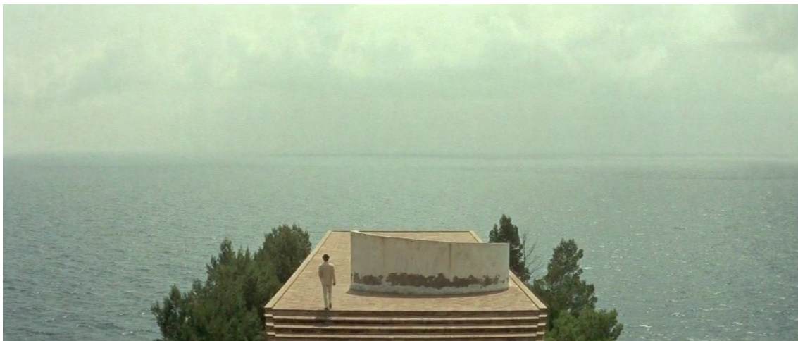
Figura 1: Fotograma de Le Mépris (Jean-Luc Godard, 1963) con la cubierta de la Casa Malaparte como protagonista

Otro ejemplo de interés lo encontramos en la Casa Malaparte (Adalberto Libera; Curcio Malaparte, 1937) y su papel protagonista en Le Mépris (1963). 14 La cinta de Godard emplea una estrategia creativa autorreferencial proponiendo el rodaje de una película dentro de otra, en este caso una versión de La Odisea dirigida por Fritz Lang, haciendo de sí mismo, sobre la cubierta plana de la casa. El universo de referencias filmicas desplegado por Godard en Le Mépris – Hatari! (1962), 15 Vivre sa vie (1962), 16 Psycho (1960), 17 Viaggio in Italia (1953) 18 – eleva la idea de cita a la categoría de forma creativa explícita. Al introducir un discurso dentro de otro, Godard conecta presente y pasado, tanto en el tiempo filmico como en la realidad, presentando la Casa Malaparte como enunciado arquitectónico de relectura de la tradición y generación de lo moderno. Gracias al privilegiado enclave en Capri y a las formas de la casa de profunda raigambre abstracta, el encuadre y la imagen en movimiento inherentes al cine simplemente despliegan multitud citas posibles; imágenes en las que reconocer la cueva, la plataforma, el templo, el altar en la naturaleza o la cubierta del barco; analogías arquitectónicas igualmente reconocibles en el discurso de la modernidad, pero al mismo tiempo, lugares evocados que el espectador visita en el breve espacio de una secuencia.