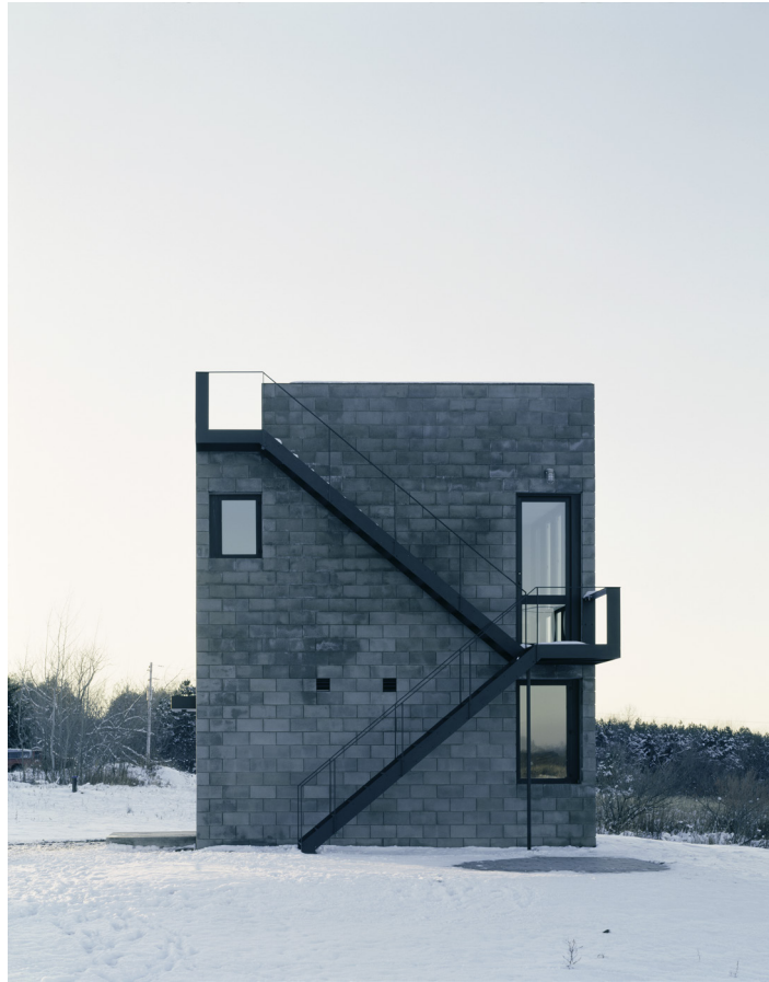
Figura 6: Block House alzado escaleras, 2000

Esta estrategia ya se incluía en las primeras versiones de la casa de 1998 y 1999. Donde el aspecto monolítico y contundente de la propuesta se ve suavizado por el uso de grandes aperturas en las fachadas. En el año 2003 se realiza un proyecto de ampliación con un bloque anexo que nunca se llegó a construir.