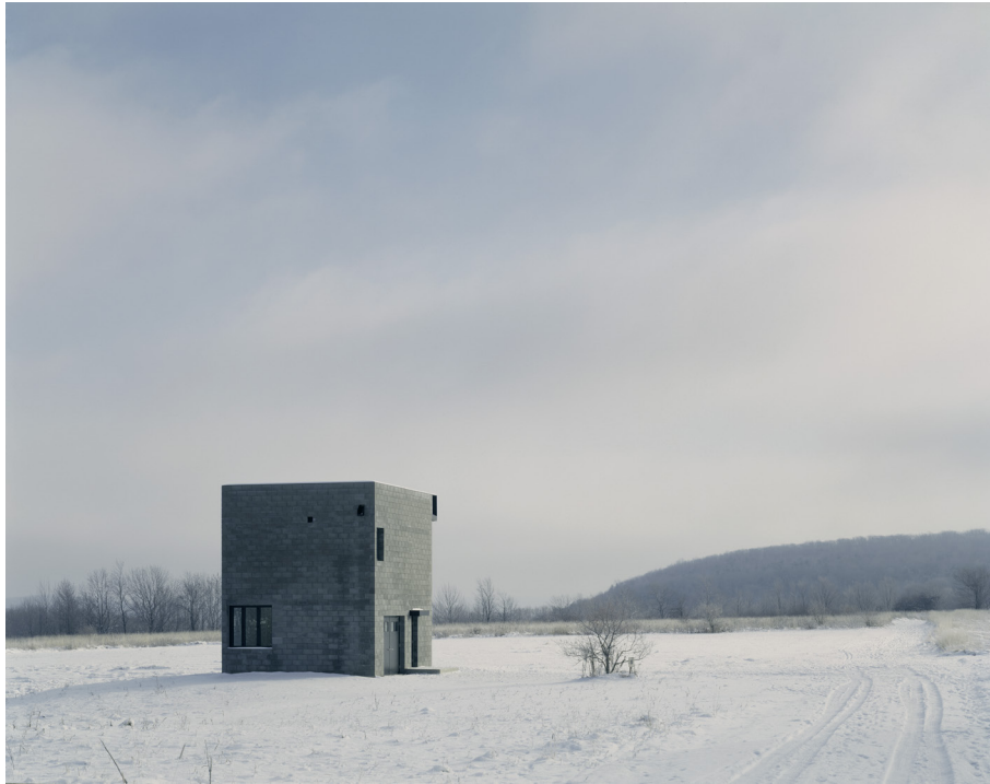
Figura 5: Block House en el paisaje de Ithaca, 2000

El uso del bloque de hormigón, fue experimentado en su proyecto de 1995 Palast der Künste, donde crea un pabellón efímero realizado por muros realizados con este material. En la propia memoria del proyecto, lo identifica como un material novedoso del que alaba sus propiedades y sobre todo su versatilidad.