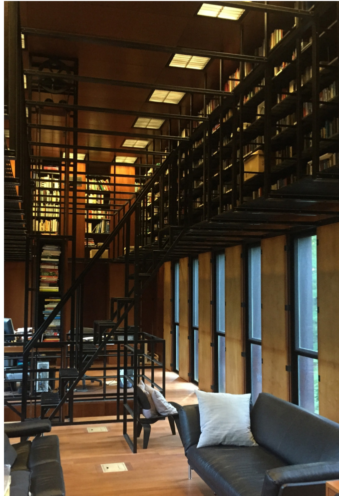
Figura 3: Interior de la zona de la biblioteca

oscuridad necesaria para la conservación de los libros, la modulación entre ventanas permite ubicar armarios aprovechando la gran cámara existente entre la estructura metálica exterior y la caja interior de madera, lo que es compatible con el diferente grado de dilatación de los dos materiales. Los libros se ubican en la galería superior protegidos de la luz. Un pequeño elevador manual de libros conecta los tres niveles de la casa.