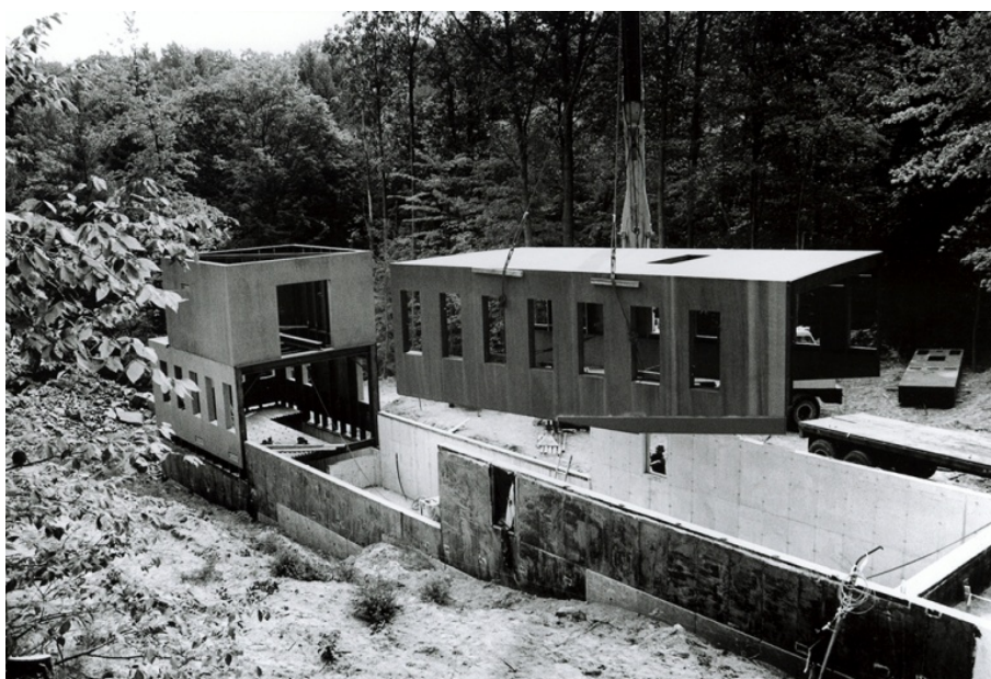
Figura 2: Fase de montaje de la casa con los grandes bloques de acero. 1991

En 1988 S.U. realiza la que será su segunda instalación Hunters Point , obra realizada en acero corten y semienterrada en un solar abandonado en una zona industrial junto al East River de Nueva York. En este caso, igual que ocurre con el proyecto para la T-House, la obra toma reminiscencias arqueológicas, parece que ambas construcciones afloran desde el terreno. Para S. Ungers era de vital importancia la elección del material, en este caso, el revestimiento de chapa de acero 9 pre montado en un taller cercano, es la propia estructura del edificio, como si de un barco varado se tratase y usando la misma tecnología naval. Su meticulosidad le llevó a que no existieran juntas vistas y todos los módulos estuviesen soldados en obra y pulido para dar una imagen de cuerpo monolítico.