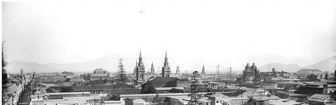
Figura 5: Vista de Santiago, 1920

Divisada desde lo alto del cerro Santa Lucía, la ciudad registra la impactante imagen de un mar de techumbres a dos aguas tal como muestran los panoramas de Santiago realizados entre 1821 y 1860 (Figura 5). 13 En efecto, la fisonomía de la ciudad durante todos estos siglos se va a caracterizar por la discreta altura de sus edificios. Las informaciones disponibles de los tiempos de la colonia, apuntan a una ciudad constituida por casas anónimas y viviendas de élite en las zonas centrales, todas de un piso de altura y construidas de adobes, y enormes suburbios hacia la periferia, ranchos o viviendas edificadas en los loteos realizados en las chacras. Con el tiempo se levantan dos alturas con remontas o sustituciones igualando así a los edificios públicos de mayor ornato y complejidad.