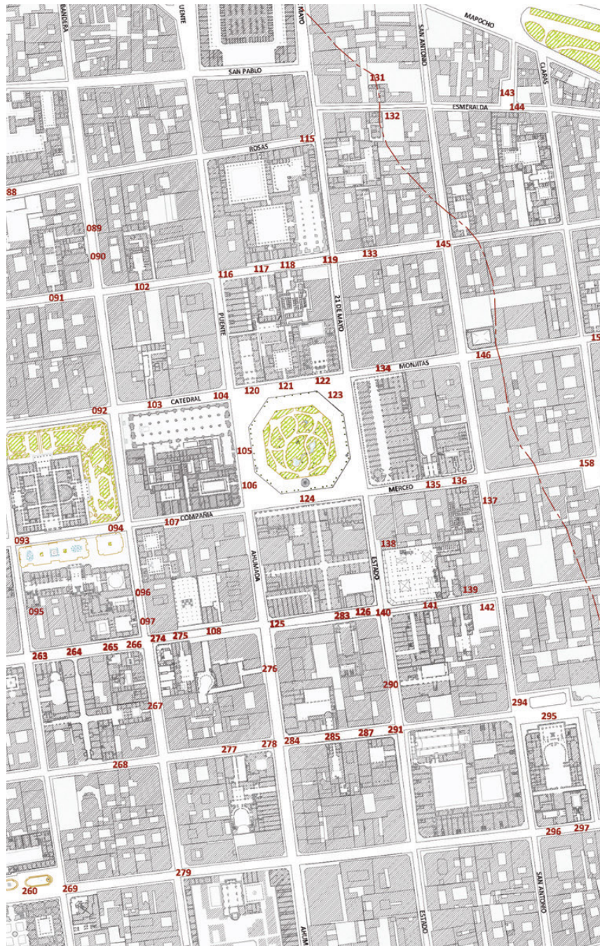
Figura 6: Detalle del Plano Santiago 1910 , enmarcando la Plaza de Armas

El desajuste entre la métrica de la manzana cuadrada y la creciente necesidad, hacia las periferias, de subdividir los terrenos en lotes pequeños dará como resultado los llamados “conventillos” o “cités”, tipología de vivienda colectiva de los sectores populares. Finalmente, cabe reconocer que esta demanda dará lugar a una progresiva deformación del orden morfológico y la aparición de un manzanero caracterizado por unos niveles de densificación heterogénea.