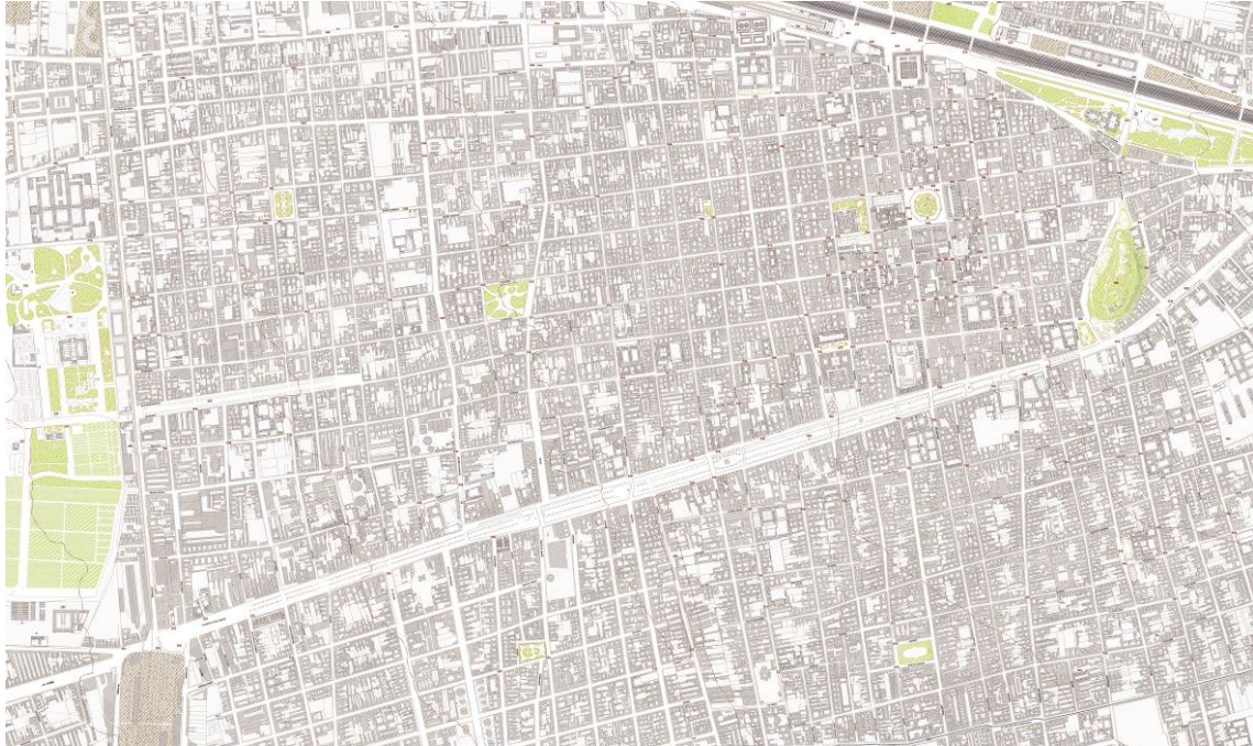
Figura 1: Fragmento del Plano Santiago 1910 . Arquitectura, Paisaje y Ciudad . Escala 1:5.000

Estos han sido los mimbres, “las cosas urbanas” como diría Manuel de Solà-Morales, 6 con los que se ha tejido, o mejor dicho caligrafiado, una imagen general inédita de la ciudad de Santiago hacia 1910 (Figura 1).