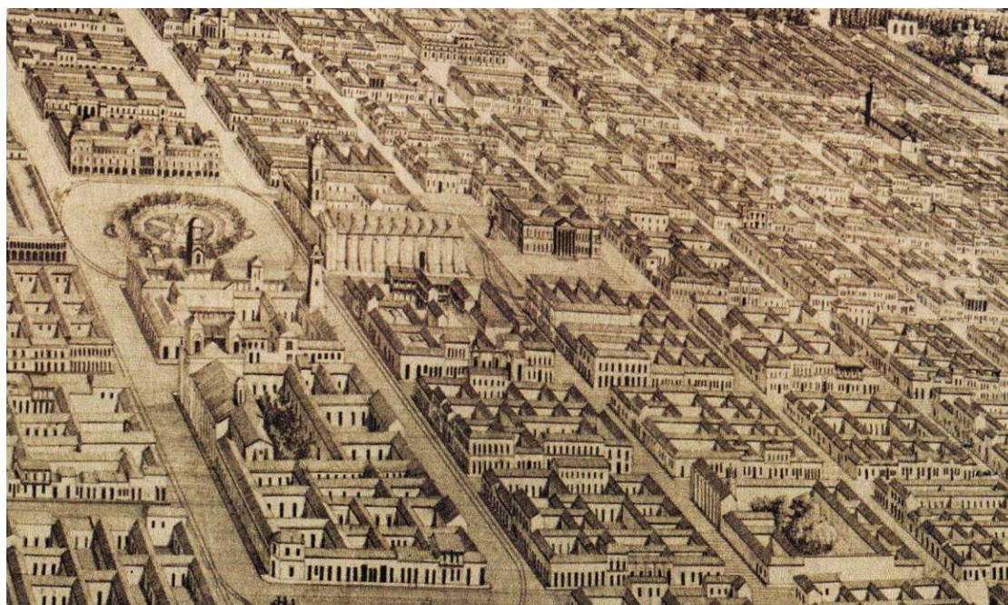
Figura 2: Fragmento del dibujo "Santiago de Chile. A vuelo de pájaro" Fuente: "Santiago de Chile. A vuelo de pájaro." León Mook, Dibujo: Laroisot, ca. 1878