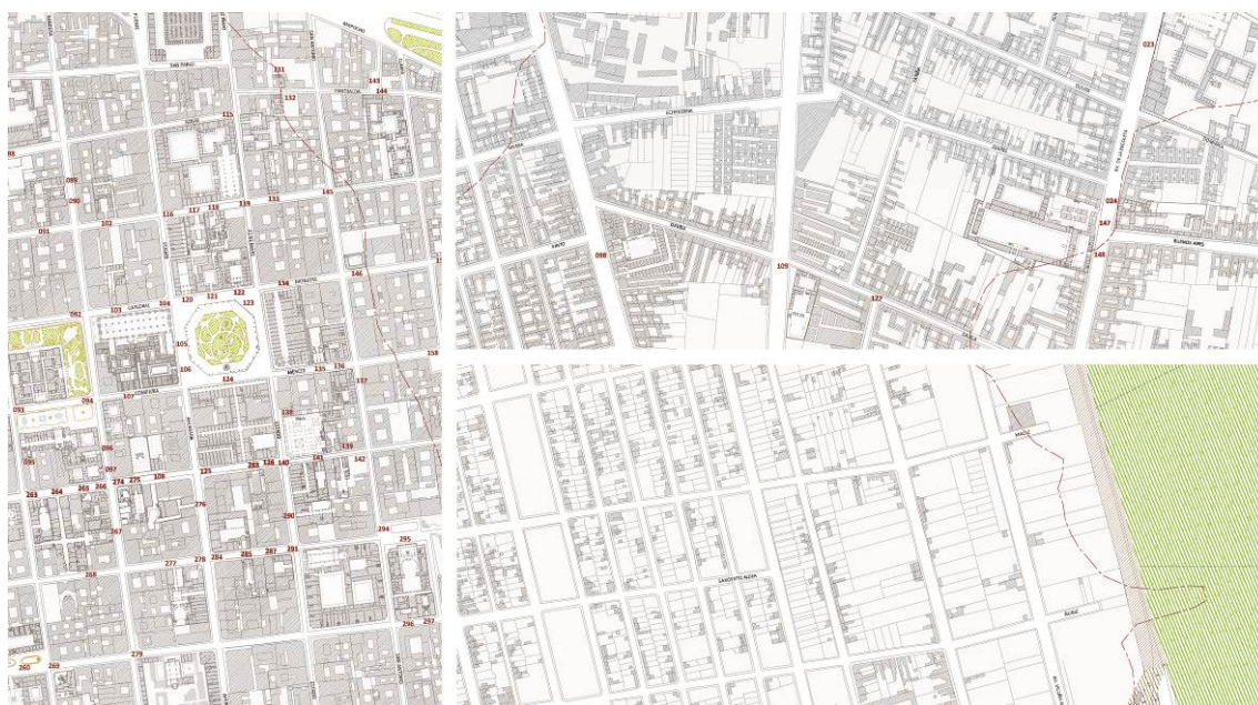
Figura 7: Tres encuadres del Plano Santiago 1910 a la misma escala

La representación en planimetría del conjunto urbano va a permitir observar grados distintos de compactación según se observen unos u otros distritos (Figura 7). Con ello, se abren nuevas hipótesis sobre las distintas propensiones de unas u otras calles a determinados asentamientos. También pudieran definirse filiaciones –familias de lotes– informando con bastante precisión de la aparición de nuevos agentes en el proceso de construcción de la ciudad –las promociones como acciones concertadas de desarrollo urbano– y medir su impacto. Para ello bastaría combinar la información de la geometría de los lotes con la obtenida de la profundidad de la edificación –un modo de aludir a la idea de fondos– porque dicha variante no estuvo sujeta a normas de conjunto. Cabe recordar que en 1910 ya existía un sistema de edificación especulativa, un proceso de arrendamiento por sitios y una legislación habitacional dirigida a los obreros y población de bajos ingresos, lo cual incidió en la construcción de viviendas sociales, conventillos y cités, que se incorporan a la trama como variantes del canon. 20