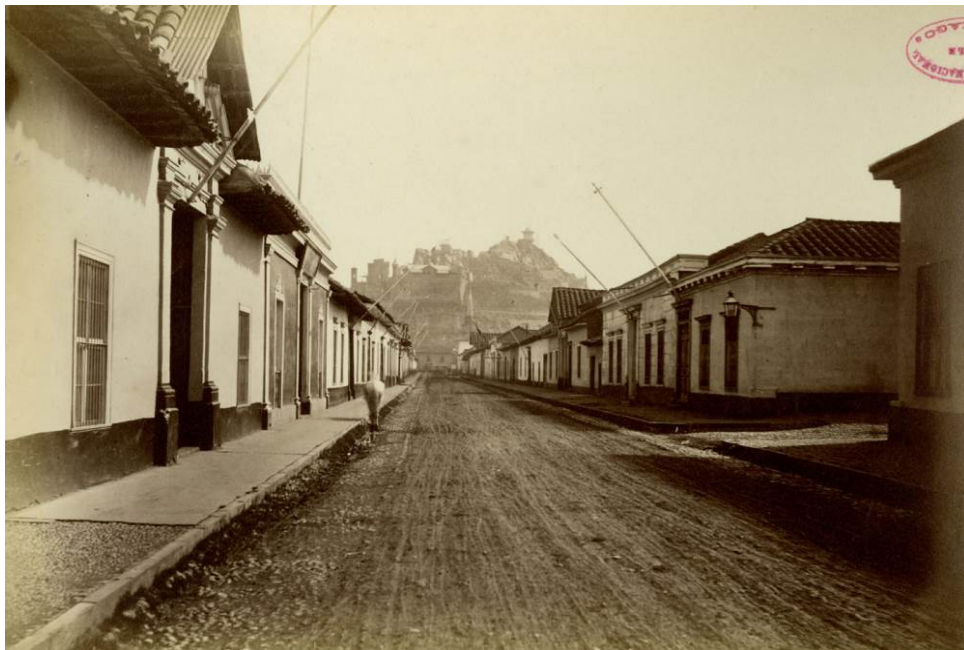
Figura 3: Vista del Sur

Las calles son esencialmente percibidas como el producto de la alineación de los edificios, aún contando en detalle con la casuística específica que diferencia a unas de otras en función de los distintos distritos urbanos donde están insertas. Ambos conceptos, calle pública y fachada de los edificios son lo mismo en planta, es decir, coinciden en la misma línea ya que la geometría de la calle se define por el límite de la edificación, salvo en la arquitectura monumental y en ciertos equipamientos. La calle y los edificios son lo uno el negativo de lo otro, tanto en el plano como en la realidad perceptiva. A su vez, la fachada a la calle es inequívocamente la única expresión de los edificios y, por lo tanto, toda su proyección pública: con ello establece una estricta separación entre el espacio público y el mundo interior. No existen espacios intermedios, ni en forma de estancias ni como preámbulos. Las fachadas de las casas, configurando por agregación continua el perímetro de cada manzana, configuran también el perfil longitudinal de la calle y, leídas desde el espacio público, definen inequívocamente la caja viaria y expresan así su anchura, es decir, su capacidad máxima, lo cual equivale a determinar su porte.