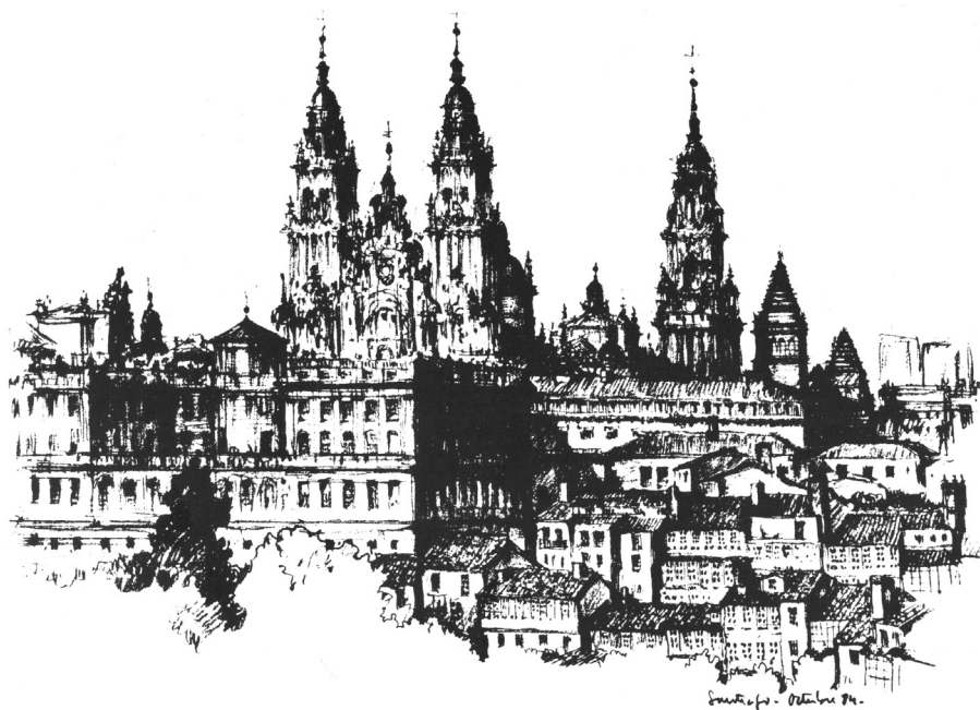
Julio Cano Lasso, Santiago de Compostela 1984.