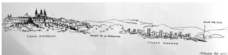
Julio Cano Lasso, Esquema del crecimiento de Santiago de Compostela . (Fuente: Julio Cano Lasso, Arquitectura , 77, 1965, p. 44)