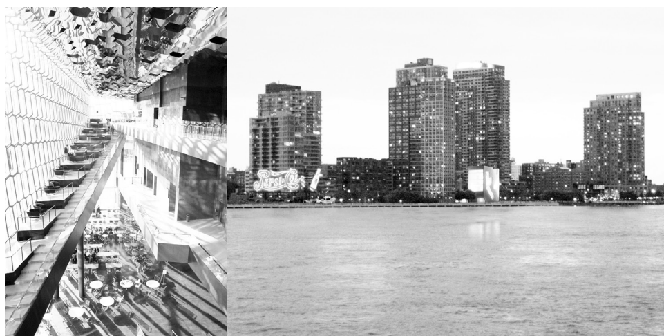
(Izquierda) Henning Larsen, Harpa Reykjavik , 2011.

(Derecha) Imagen de Reykjavik .