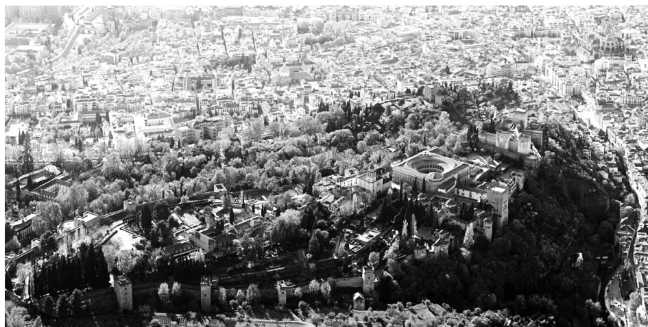
Vista aérea de la Alhambra.