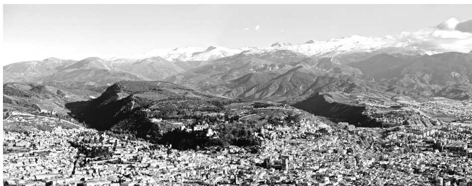
Vista aérea de Granada.

adquiere diferentes espesores, secciones y usos. De esta manera, los grososres se convierten en palacios y los movimientos y desplazamientos por el perímetro amurallado configuran la relación en el paisaje creado. Por otro lado, la belleza en las interferencias de las torres que se habitan en la muralla y sus lienzos plantea la pregunta de que si la aleatoriedad en el juego de agregaciones y aproximaciones está realizada sin un plan concebido. Las distancias equidistantes entre torres marcan esa necesidad defensiva de continua mirada y control, pero la interrogante sobre el programa funcional completo de la ciudadela resulta difícil de descifrar, por lo que solamente podemos lanzar hipótesis. Posiblemente el paisaje de la Alhambra no sea solamente una superposición de circunstancias, sino que es el resultado de un entendimiento del contexto mediante una intuición aguda en su posicionamiento, en el que lo construido y el vacío se manifiestan en igualdad de importancia.