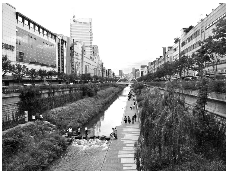
Cheonggyecheon en la actualidad