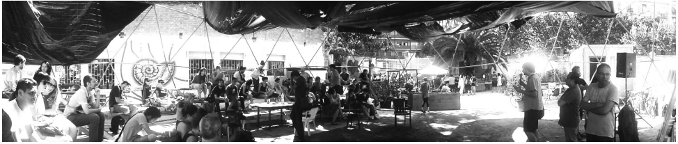
Encuentro arquitecturas colectivas 2014 en Espai Germanetes