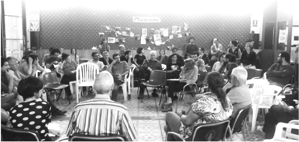
Encuentro arquitecturas colectivas 2014 en la Flor de Maig