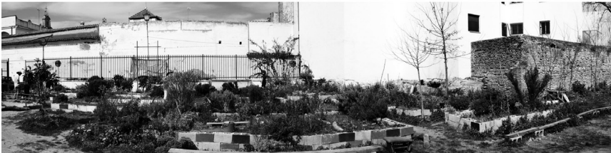
Emplazamiento del Huerto del Rey Moro, Sevilla