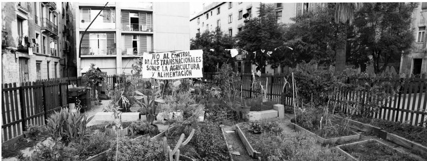
Vista del Forat de la Vergonya, Barcelona