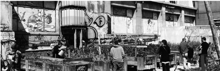
Emplazamiento del Campo de Cebada, Madrid