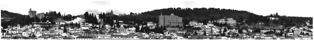
The Ledge. Elevation southwest. Color and texture.