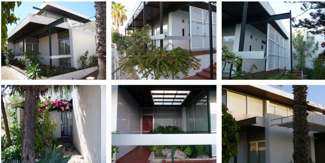
Figura 6: Gomes da Costa. Pormenores de su casataller, Faro.