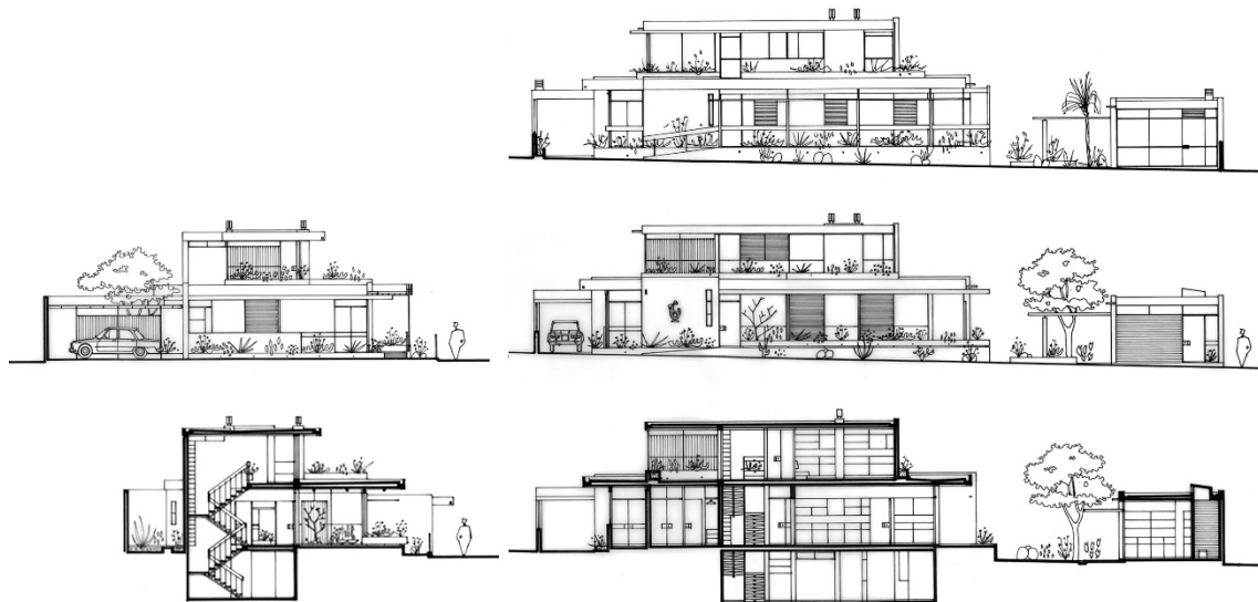
Figura 3: Gomes da Costa. Moradia en Faro:

El edificio proyectado, y el finalmente construido, parte de la fragmentación de una parcela trapezoidal de treinta y un metros de frente y de unos doce de anchura media, y del deslizamiento de los diversos fragmentos sobre el tapiz una vez que se les ha atribuido un cometido, de modo que, al igual que en un puzle, unos fueran encajando en otros. La superficie del solar apenas supera los trescientos sesenta y cuatro metros cuadrados. Está situado entre medianeras sin edificar y tiene una leve pendiente, descendiente de este hacia oeste. Esta parcela cóncava se ordena como si fuera una minúscula ciudad encerrada en una ancha U invertida; en ella los recintos se disponen retranqueados respecto a la línea de la fachada. Las diversas piezas que son cada una de las habitaciones, se componen esponjadas, discontinuas, desplazadas, con oquedades y dilataciones incrustadas entre ellas, entreverando en la masa edificatoria total vacíos y cavidades al descubierto que logran aligerarla, restarle compacidad y airearla (Figura 3).