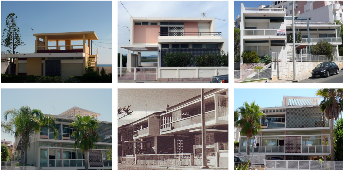
Figura 4: Gomes da Costa. Dos casas vacacionales en la Isla de Faro y unifamiliares en Faro

unifamiliares construidas por aquellos años en el entorno, con las muy próximas en Faro, como la Casa Alfonso (1960) o la Casa Gago (1955), o con otras algo más alejadas, como son las vacacionales levantadas por aquellas fechas en la Avd. de Nascente de la Isla de Faro, todas de dos plantas, únicas, aisladas y exhibidoras del repertorio de estilemas que caracterizan sus obras (Figura 4).