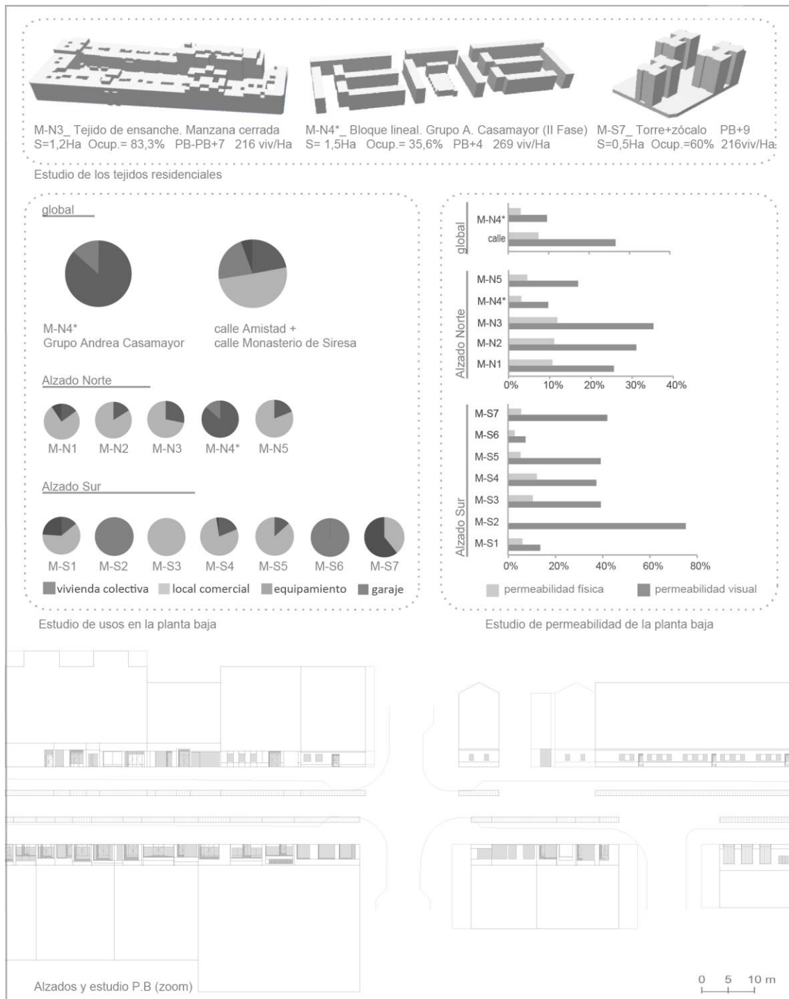
Figura 7: Análisis de la funcionalidad y permeabilidad física y visual de las calles Amistad y Monasterio de Siresa