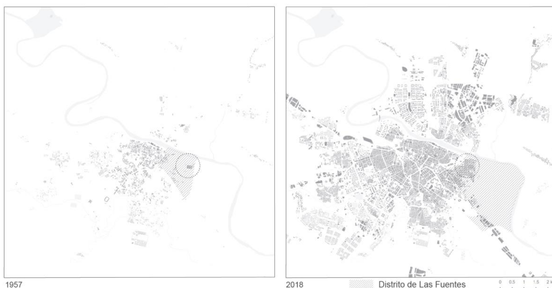
Figura 1: Plano de situación. Polígono Andrea Casamayor y barrio de Las Fuentes en 1957 y en 2018

La figura 1 muestra el emplazamiento del entorno estudiado en el contexto general de la ciudad de Zaragoza en la fase inicial de su construcción (1957) y en su estado actual (2018). La circunferencia señala la localización del polígono Andrea Casamayor y de la 'periferia ordinaria', es decir, el barrio de Las Fuentes, que actualmente lo envuelve por todos sus lados. La trama rayada indica la extensión total del distrito de Las Fuentes. Como se puede observar, actualmente sigue estando conformado en gran parte por áreas de cultivo, siendo aproximadamente la proporción de la superficie edificada (barrio) 1/5 de la superficie total. Este dato tiene relevancia a la hora de relaizar los cálculos de la densidad del distrito, que resulta equívocamente baja, al considerarse la totalidad del distrito.