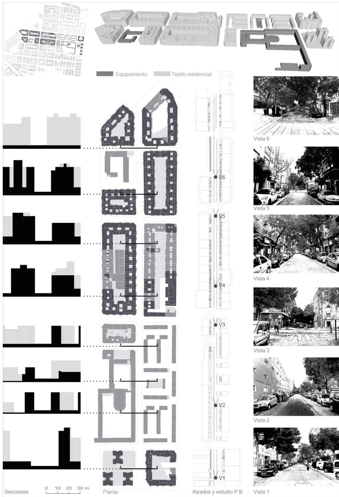
Figura 6: Análisis secuencial de las calles Amistad y Monasterio de Siresa y su vida urbana