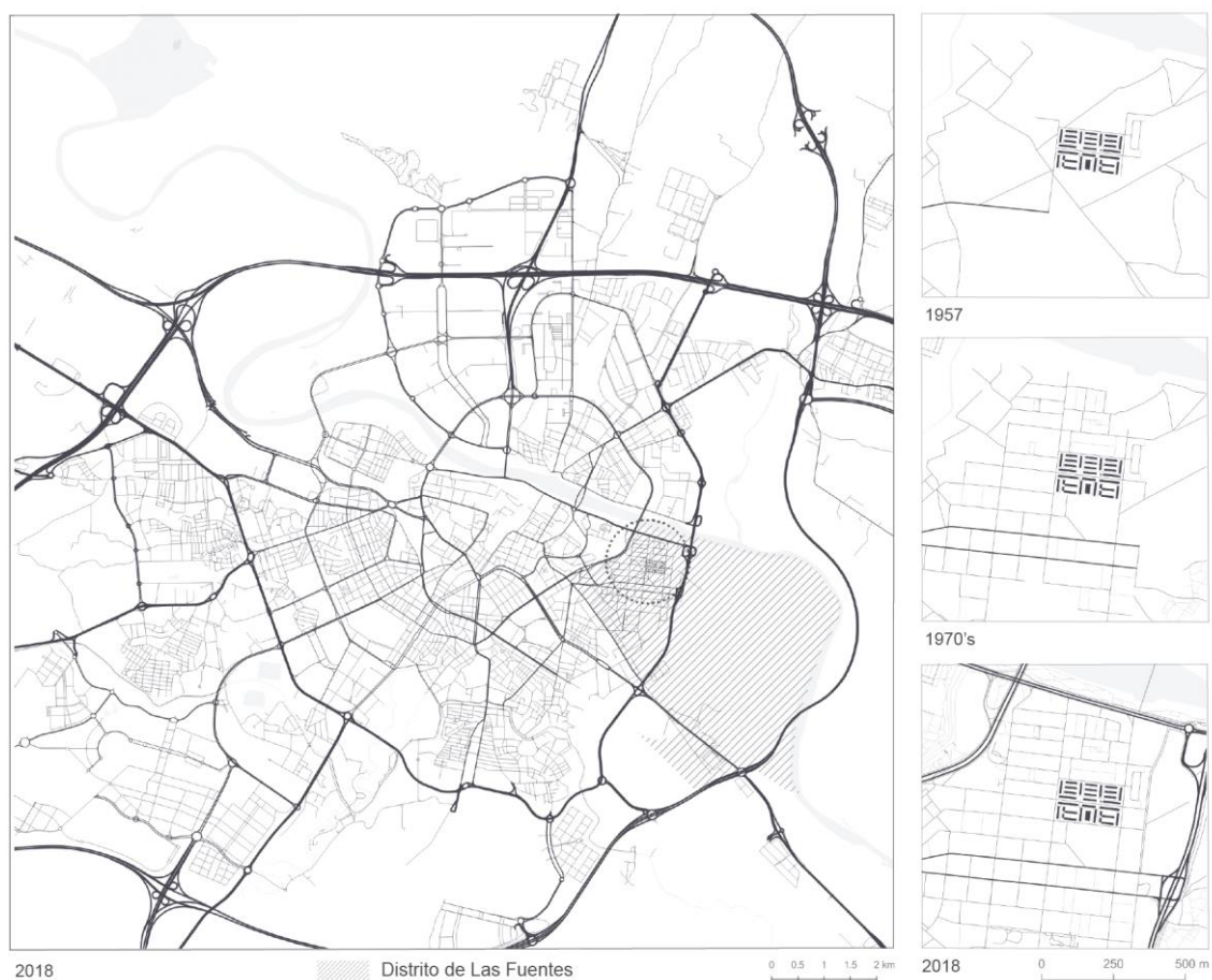
Figura 3: Sistema viario. Situación relativa del barrio de Las Fuentes respecto al centro consolidado en 2018 Evolución de la conexión del polígono con el barrio que lo absorbió y de éste con la ciudad consolidada

La figura 3 permite reflexionar sobre estas cuestiones. Se aprecia cómo las vías interiores del barrio no experimentan apenas transformaciones ni ampliaciones significativas desde los años setenta. Sí evoluciona considerablemente el sistema viario en los los bordes del barrio, así como las conexiones con la ciudad mediante la construcción de grandes infraestructuras (los puentes, el camino de las torres que se correspondería con lo que fue el segundo cinturón, el tercer cinturón, etc.).