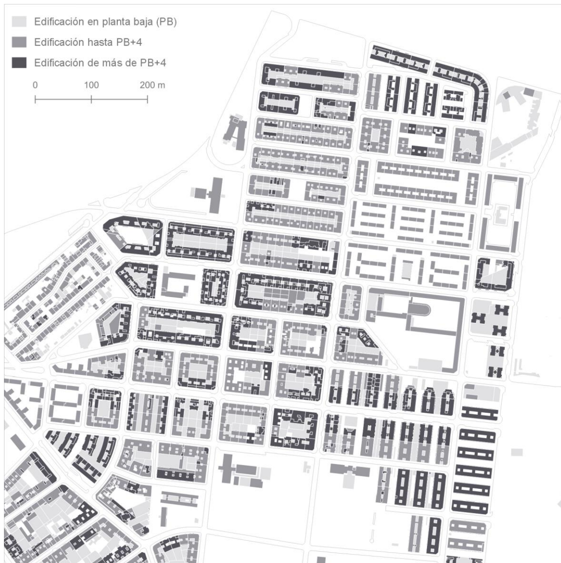
Figura 4: Planta de análisis del tejido urbano en la que aparecen representadas las distintas soluciones morfológicas y en la que se indica, mediante una gradación cromática, las alturas de los edificios, con el fin de explorar posibles relaciones entre la morfología, la densidad y la calidad urbana

se explora la posibilidad de vincular bases de datos a una cartografía convencional, como el dibujo en planta y en sección, con el fin de incorporar a un documento gráfico informaciones que ayuden a identificar posibles problemas y oportunidades de mejora. Mediante Sistemas de Información Geográfica (GIS) se asocian alturas y número de habitantes por vivienda a las plantas y secciones, lo que permite obtener conclusiones respecto a la densidad del polígono en relación con el barrio que se ha consolidado en torno a él. Además, los dibujos ponen de manifiesto la diversidad morfológica. Manzanas cerradas en torno a patios, manzanas semicerradas, bloques en H, torres en H, etc., conforman el barrio, frente a la homogeneidad del polígono, constituido exclusivamente por bloques.