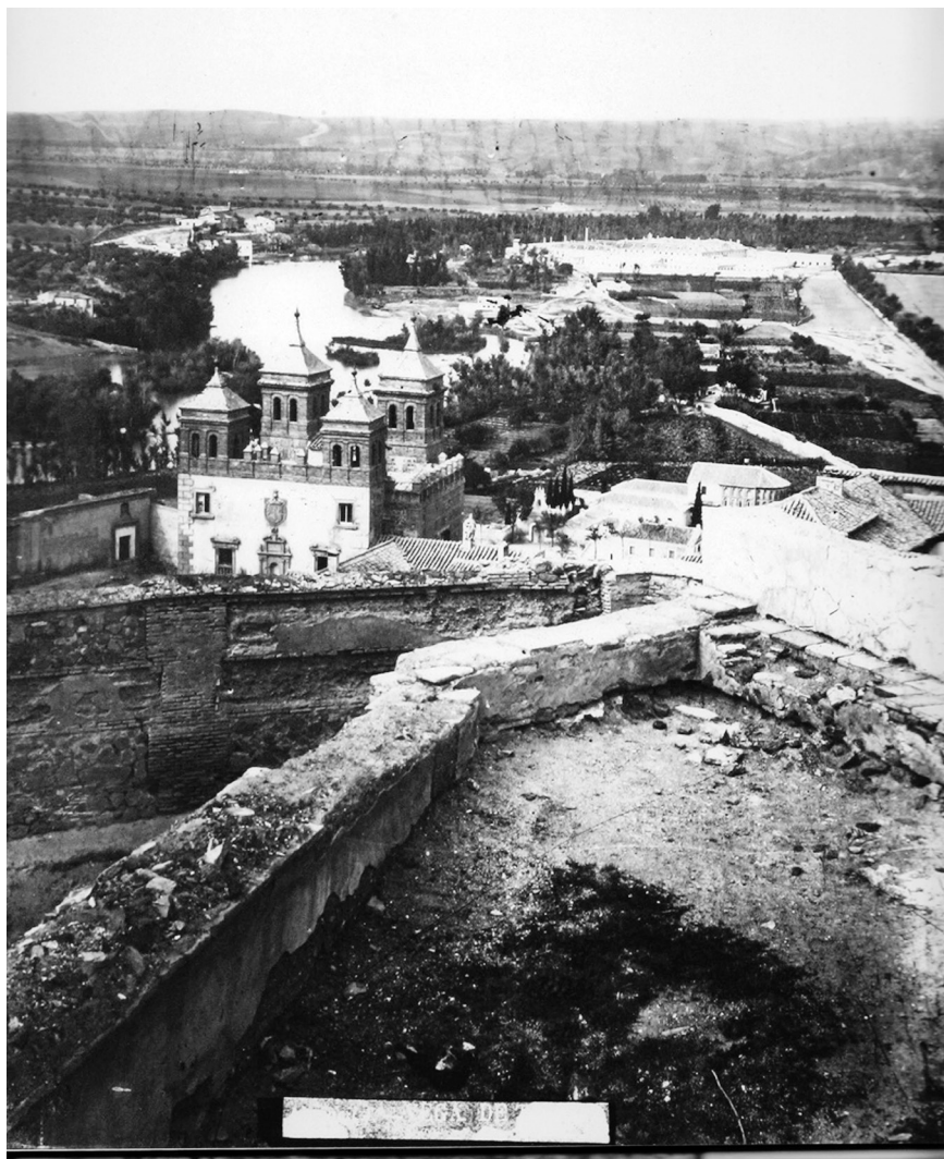
Casiano Alguacil (tercer tercio del siglo XIX-primer década del XX) Imagen tomada desde el pensil de la ermita de la Virgen de Gracia, con la puerta del Cambrón en primer término y la vega baja en el horizonte