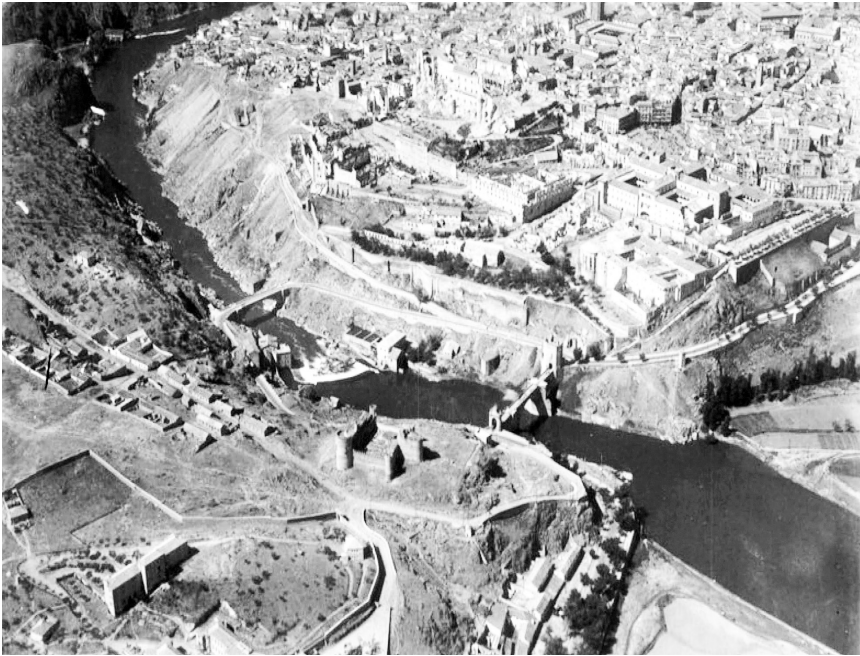
Fotografía aérea. Años cuarenta del pasado siglo. En primer término, la zona delimitada por el al-Hizam, con el Alcázar (en ruinas tras la guerra), Santa Cruz, Santa Fe y la Concepción Francisca. En ese lado del río, debajo, el huerto del Granadal de San Pablo y a la izquierda de la imagen, hacia el fondo, los derrumbaderos.