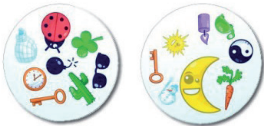
Figura 2. Dos tarjetas de Dobble.

Buscad un nombre y ya habéis reinventado uno de los juegos. ¿Es así más divertido? ¿Desarrolla las mismas capacidades?