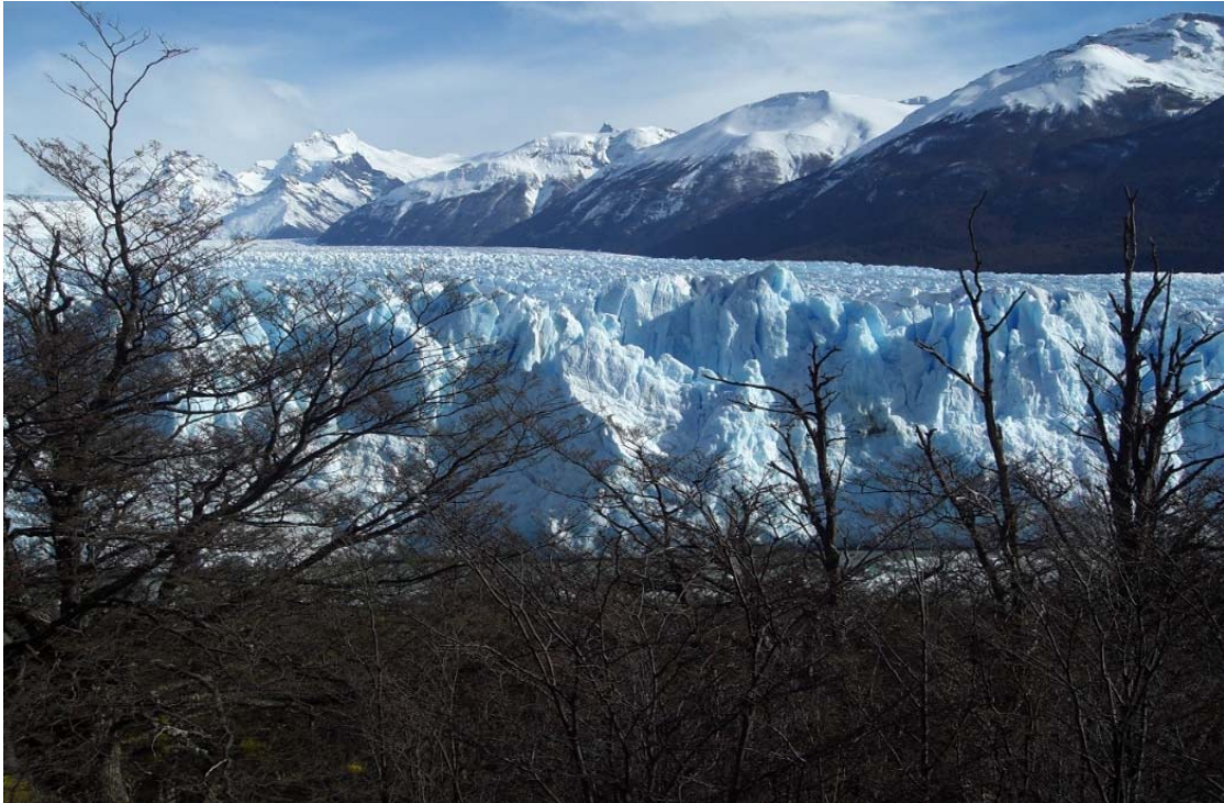
Glaciar Perito Moreno (Argentina)