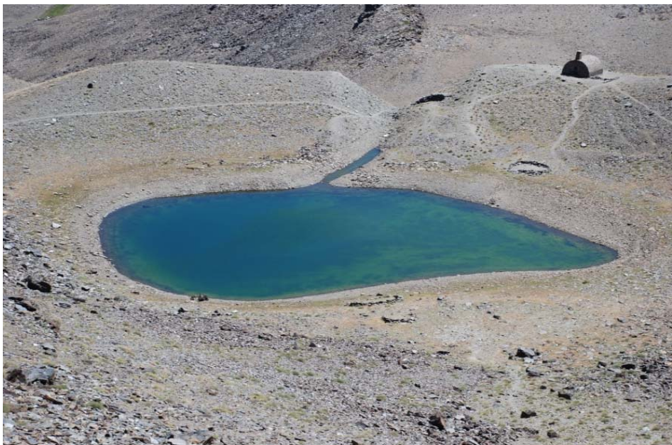
Laguna del Caballo en el valle del río Lánjarón (Sierra Nevada), represada por una antigua morrena (del “Younger Dryass”). La incisión en el centro de la morrena es “artificial” (hecha recientemente)