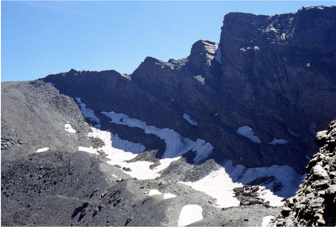
Valle del río Guarnón (Sierra Nevada) Morrena frontal ligada al último glaciar de Sierra Nevada (de la “Pequeña Edad del Hielo”) en la pared norte del “Pico Veleta