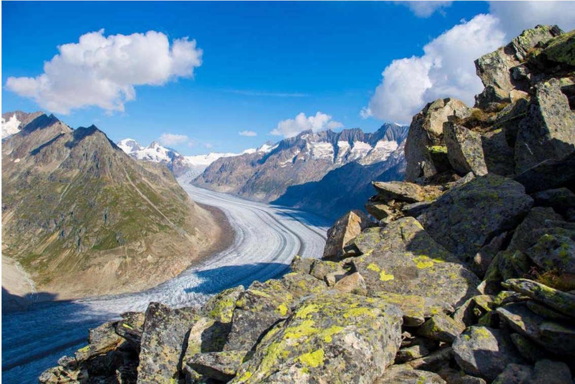
Glaciar Aletsch (Alpes suizos)

El otro tipo de glaciar es el de “valle”, que se localiza en las zonas montañosas de ambos hemisferios, a alturas tanto más elevadas cuanto más cerca estén del Ecuador. En el glaciar típico de valle se distinguen la zona de circo, donde se acumula la nieve y el valle glaciar por donde discurre la lengua glaciar pendiente abajo hasta la zona de fusión.