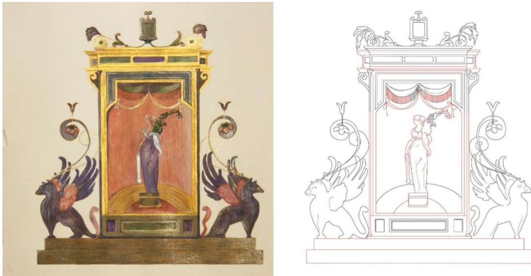
3. M. a Isabel Puerto Fdez. Abundancia . 2019. A la izquierda, técnica mixta sobre papel. A la derecha, dibujo vectorial con líneas en negro parte original y líneas en rojo parte reconstruida. Dibujado a escala 1/1 con respecto a los frescos del Peinador de la Reina.

Tras el estudio, podemos llegar a la conclusión de que la protagonista de este templete sea Fortuna, sin embargo, esta hipótesis no está avalada por ningún documento histórico que lo testifique por lo que seguiremos nombrándola como Abundancia. No obstante, para la reconstrucción por medio del dibujo, se ha utilizado los atributos de cornucopia con vegetales y timón dado que son los elementos que nos sugieren los restos de policromía. [Fig. 3]