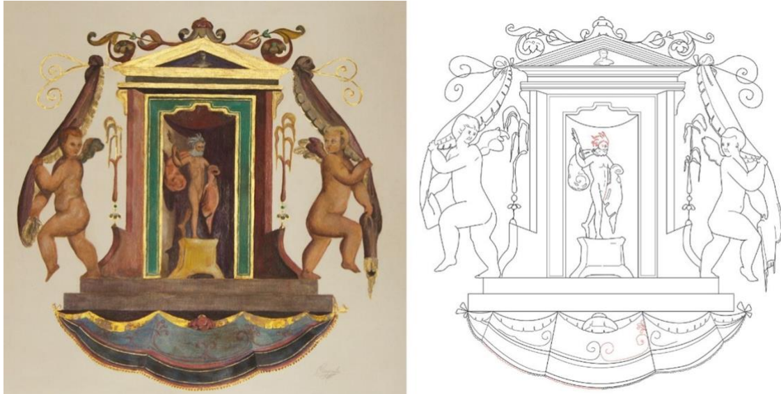
2. M. a Isabel Puerto Fdez. Júpiter . 2019. A la izquierda, técnica mixta sobre papel. A la derecha, dibujo vectorial con líneas en negro parte original y líneas en rojo parte reconstruida. Dibujado a escala 1/1 con respecto a los frescos del Peinador de la Reina.

observamos que, en el templete de Júpiter, bajo la cornisa, hay una inscripción en color negro con los siguientes caracteres “Ama (...)” y continua una frase ya borrada por el tiempo a lo largo de esta cornisa. [Fig. 2]