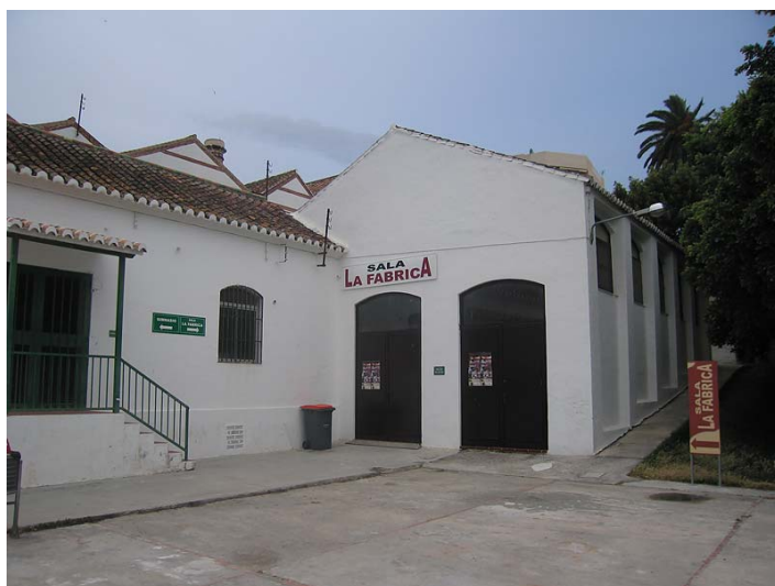
Link 3. Fábrica de San José en Nerja. IES Chaparil