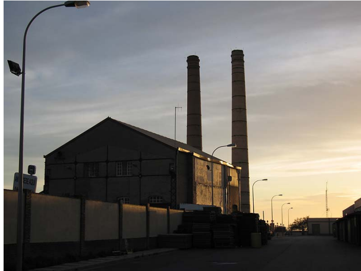
Link 31. Fábrica azucarera “libre” de Adra. Estado actual