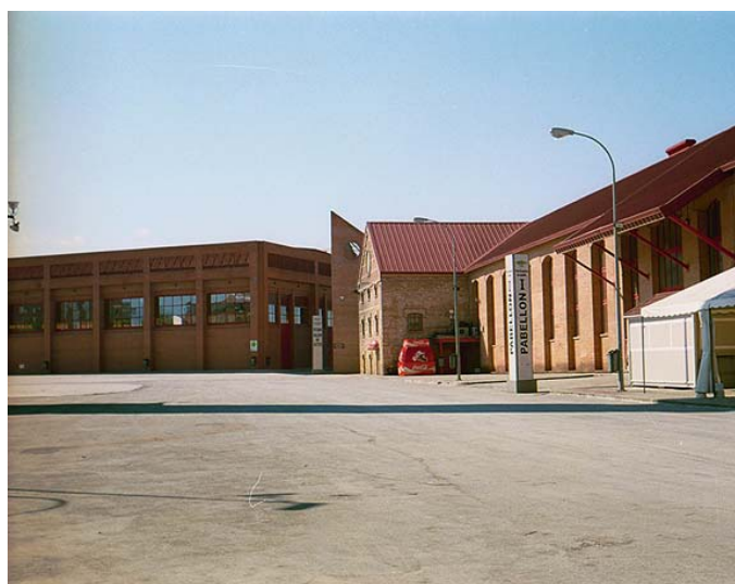
Ilustración 5. Antigua fábrica azucarera de Santa Juliana (Armilla). Estado actual.

Proyecto de rehabilitación y adaptación para la Feria de Muestras de Armilla (Granada) [Ilustración 5]