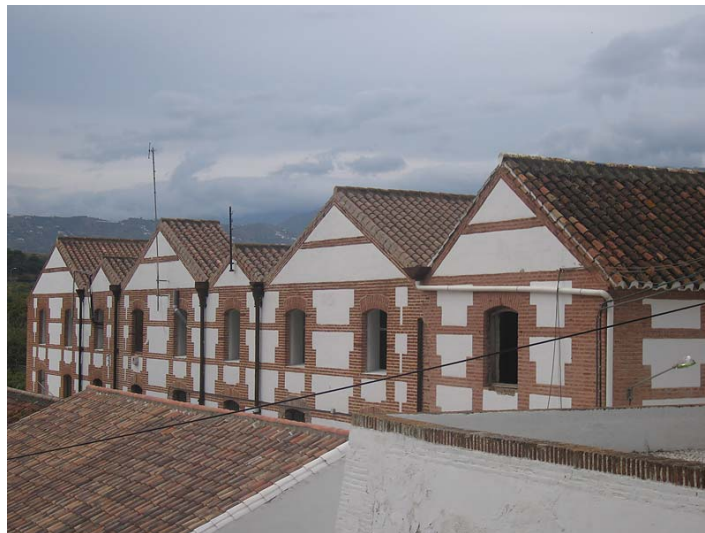
Link 1. Fábrica de San José en Nerja. IES Chaparil

Hubo una segunda intervención posterior, a finales de los ochenta, por necesidades de espacio en el Centro "El Chaparil". El edificio de los secaderos se convertiría en los Talleres del centro público, vaciándose su interior y respetándose los paramentos exteriores; también se construyó un pabellón de nueva planta que no alteró la rehabilitación anterior, aunque supuso una reestructuración de los espacios en el I. E. S. [Link 1] [Link 2] [Link 3] [Link 4] [Link 5] [Link 6]