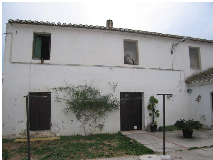
Link 2. Fábrica de San José en Nerja. IES Chaparil