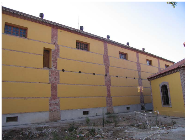
Link 29. Azucarera del Pilar (motril). Almacén de efectos