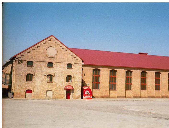
Link 20. Fábrica de Santa Juliana. Estado Actual