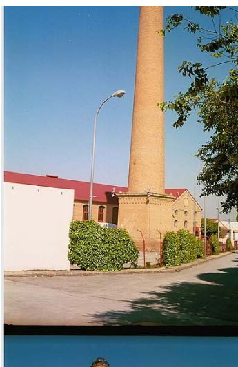
Link 19. Fábrica de Santa Juliana. Estado Actual