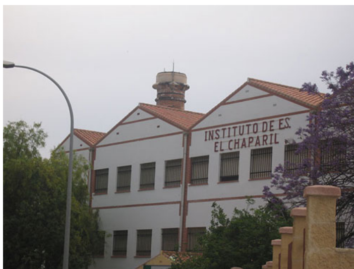
Ilustración 1. Antigua azucarera de San José. Actualmente IES Chaparil

Proyecto de Rehabilitación. Conversión de la fábrica en el Instituto de Educación Secundaria "El Chaparil".[Ilustración 1]