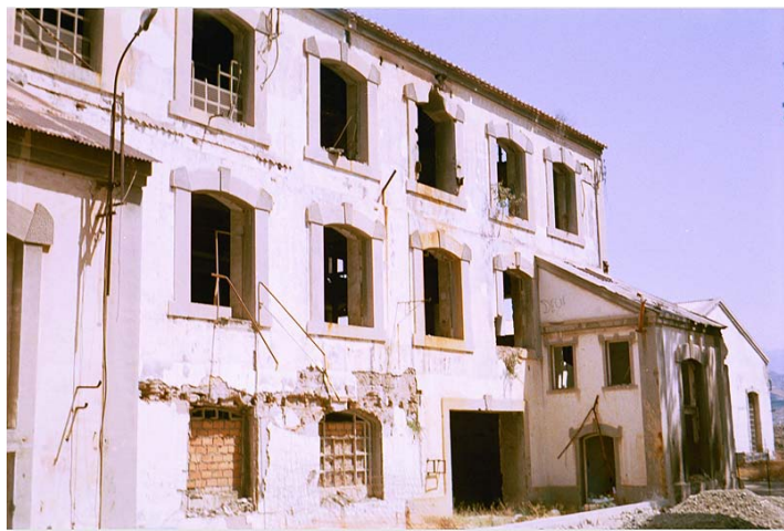
Link 16. La Casa de Dirección de la fábrica de Torre del Mar