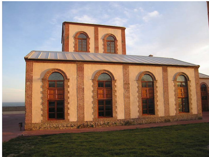
Link 32. Fábrica azucarera “libre” de Adra. Estado actual