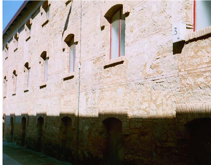
Link 22. Fábrica de Santa Juliana. Estado Actual