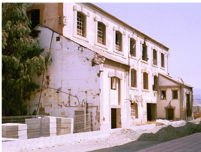
Ilustración 4. Obras de restauración del “Cuerpo de fábrica” de la azucarera de Torre del Mar

El día 17 de septiembre de 1993 la Corporación Municipal de Vélez Málaga aprobó un convenio urbanístico con SAMESA. En el acuerdo se incluía la cesión de la fábrica al