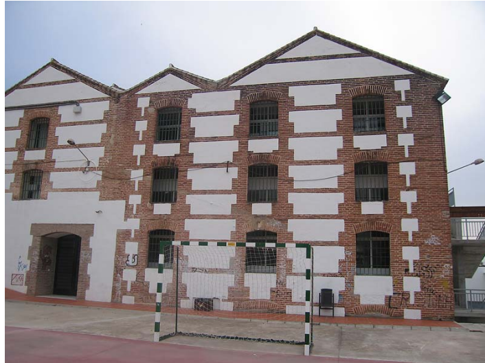
Link 5. Fábrica de San José en Nerja. IES Chaparil