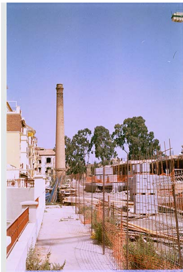
Link 13. La Casa de Dirección de la fábrica de Torre del Mar

En definitiva, el Proyecto contemplaba lo siguiente: 1. La rehabilitación del antiguo Cuerpo de fábrica o cocina de Nuestra Señora del Carmen de Torre del Mar. 2. La creación de un Museo y Auditorio . 3. La configuración de un Parque del azúcar . 4. La conformación de un Espacio Expositivo abierto . 5. El levantamiento de un Salón de Actos . 6. Se respetaría y se integraba en el conjunto la chimenea octogonal de la antigua fábrica de azúcar (las dos chimeneas restantes debían conservarse y así ha ocurrido). La rehabilitación de este espacio no se ha llevado a cabo aún. Lo lamentable es que el resto de las construcciones de la fábrica y destilería (salvo la antigua casa de Dirección ) han desaparecido y lo que permanece se encuentra ahogado por las urbanizaciones que han surgido en sus alrededores. Aplaudimos el acierto del Ayuntamiento de Vélez Málaga de rehabilitar en un futuro este espacio y dotarlo de las infraestructuras necesarias para el nuevo uso que va a desempeñar.[Link 13] [Link 14] [Link 15] [Link 16] [Link 17] [Link 18]