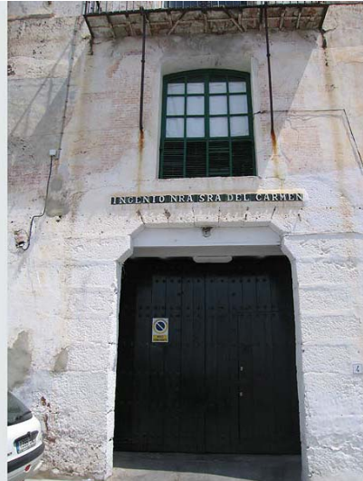
Link 7. Ingenio de Frigiliana