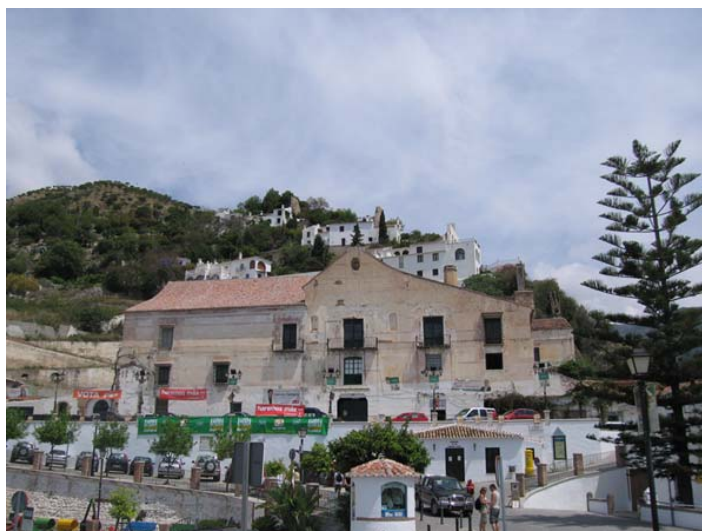
Ilustración 2. Fachada principal del Ingenio de Frigiliana. Estado actual

El estado de conservación hoy en día del Ingenio de Frigiliana es bastante bueno, teniendo en cuenta los siglos transcurridos. El Ingenio de Frigiliana está protegido por la ley de Patrimonio Histórico del año 1985, en cuanto que ha sido declarado BIC.