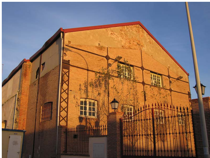
Link 34. Fábrica azucarera “libre” de Adra. Estado actual