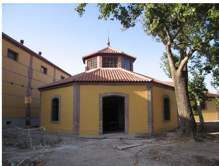
Link 30. Azucarera del Pilar (motril). Almacén de efectos