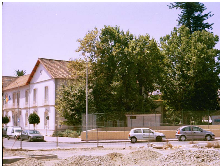
Link 14. La Casa de Dirección de la fábrica de Torre del Mar