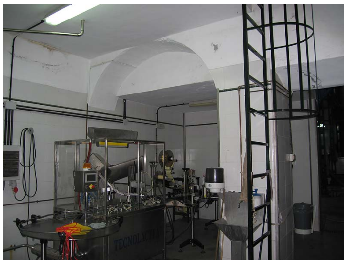
Link 12. Ingenio de Frigiliana