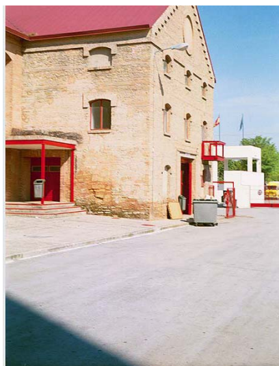
Link 24. Fábrica de Santa Juliana. Estado Actual