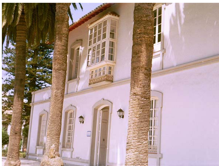
Ilustración 3. Fachada de la “Casa de Dirección” de la azucarera de Ntra. Sra. del Carmen de Torre del Mar. Estado actual.

Proyecto de rehabilitación y su conversión de la fábrica en Centro de Difusión Turística y Museo del azúcar 20 . [Ilustración 3] [Ilustración 4]