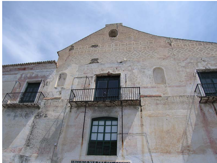
Link 8. Ingenio de Frigiliana