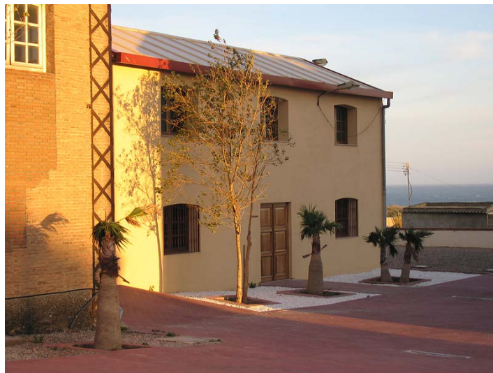
Link 33. Fábrica azucarera “libre” de Adra. Estado actual