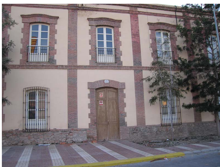
Link 36. Fábrica azucarera “libre” de Adra. Estado actual