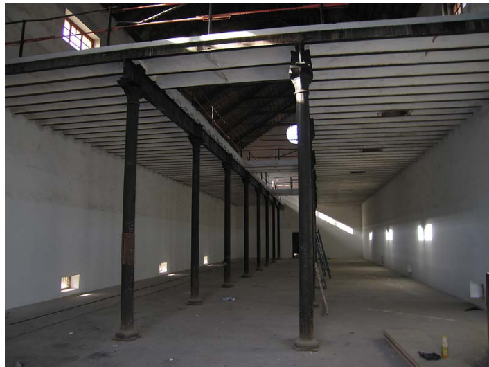
Link 26. Azucarera del Pilar (motril). Almacén de efectos