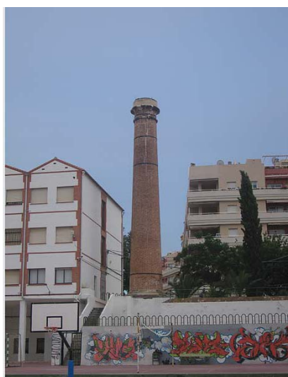
Link 4. Fábrica de San José en Nerja. IES Chaparil