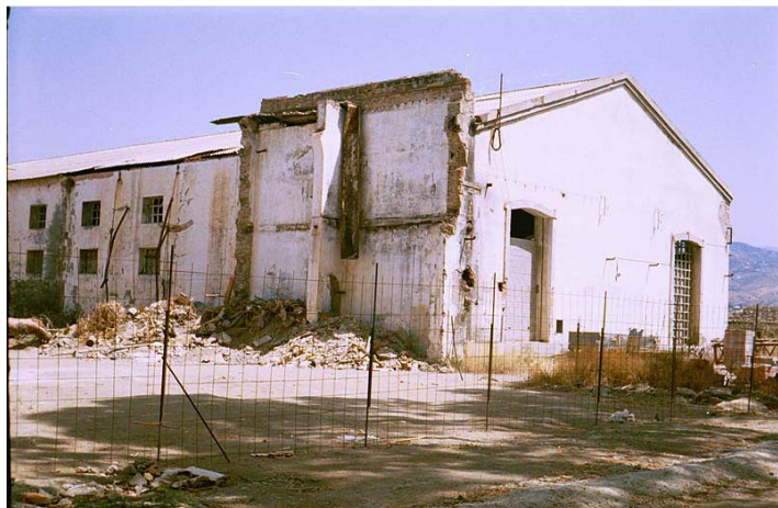
Link 17. La Casa de Dirección de la fábrica de Torre del Mar