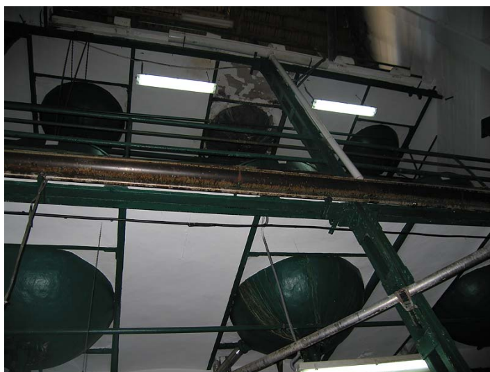
Link 11. Ingenio de Frigiliana