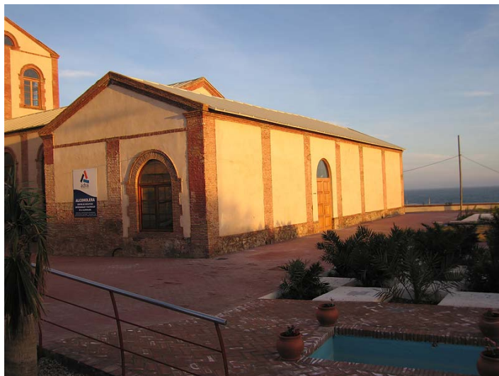
Link 35. Fábrica azucarera “libre” de Adra. Estado actual