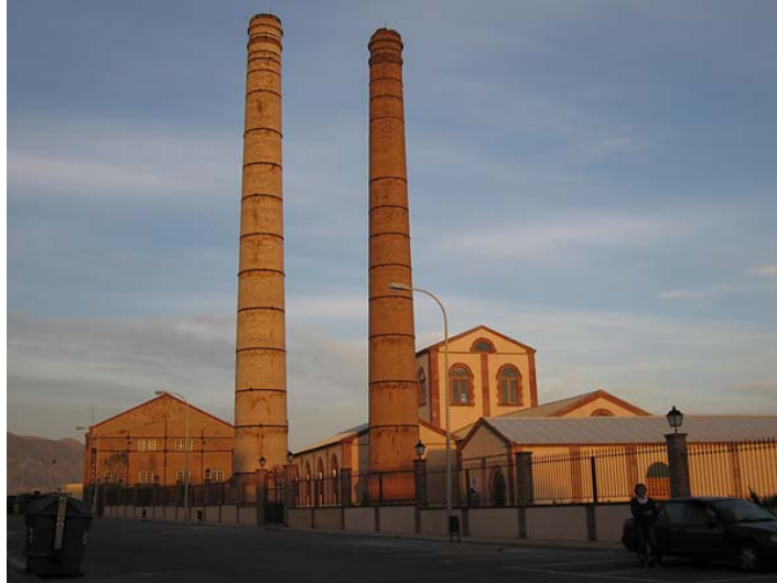
Ilustración 7. Azucarera “libre” de Adra. Estado actual de Conservación

La maquinaria y aparatos de esta fábrica fueron trasladados a una azucarera de Badajoz. El deterioro de las construcciones en los años setenta y ochenta era más que evidente ya que durante el mes de enero de 1986 la techumbre de la nave central (las tachas) se derrumbó, cayendo parte de la fachada principal 34 .