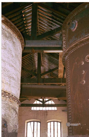
Link 18. La Casa de Dirección de la fábrica de Torre del Mar

* Fábrica azucarera de Santa Juliana en Armilla (Granada). La Sociedad “ Creus y Compañía ” fue creada a partir de la Escritura de constitución de Sociedad Mercantil dada en Granada el 16 de agosto de 1889 ante el Notario Francisco de Paula Montero, siendo de nuevo modificada el 28 de junio de 1895. Fue la Sociedad que erigió la Fábrica de azúcar de Santa Juliana en Armilla (Granada).