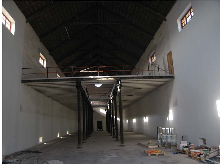
Link 25. Azucarera del Pilar (motril). Almacén de efectos