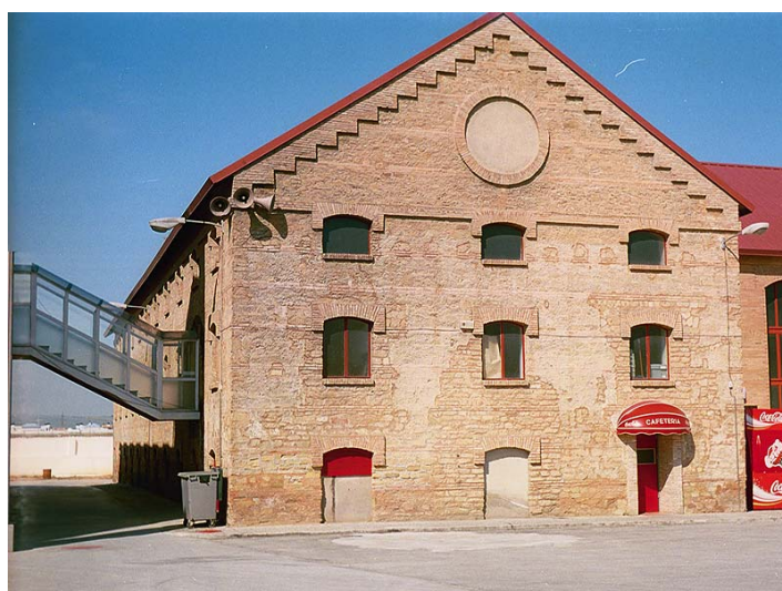
Link 21. Fábrica de Santa Juliana. Estado Actual