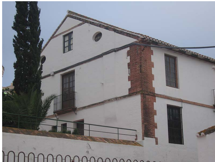
Link 6. Fábrica de San José en Nerja. IES Chaparil