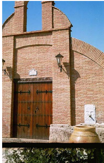
Link 23. Fábrica de Santa Juliana. Estado Actual