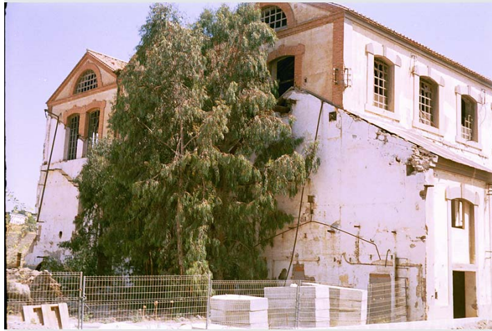
Link 15. La Casa de Dirección de la fábrica de Torre del Mar