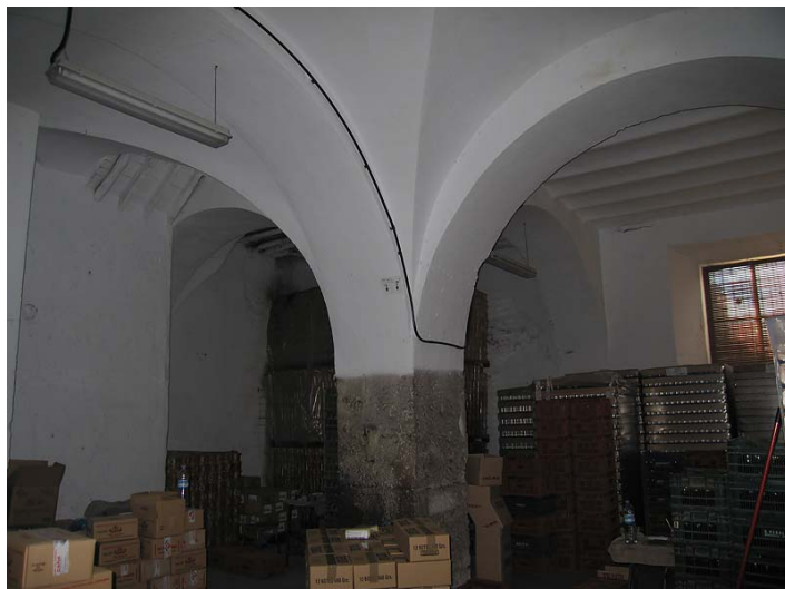
Link 10. Ingenio de Frigiliana