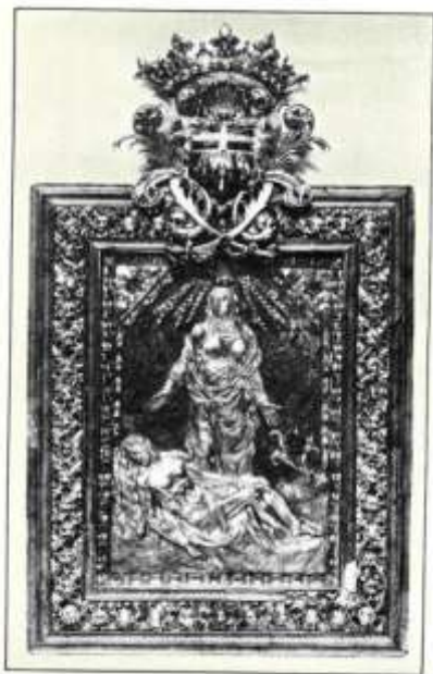
Ilustración 03. Joya de la Piedad, pieza de orfebrería de finales del siglo XVII. (Almunia, 1929:17).

Junto a estas dos joyas que envió como regalo a su hermano, el I marqués, además de enriquecer el patrimonio de la Casa de Dos Aguas, el Gran Maestre de la Orden de Malta también enriqueció el patrimonio eclesiástico valenciano. A la iglesia de San Andrés, donde fue bautizado, 6 hizo donación de un “(...) hermoso terno, una rica alfombra, una lámpara de plata con valor de 800 libras valencianas, una casulla con dalmática y un frontal”, así como también a la Virgen de los Desamparados donó una lámpara de plata de similar valor a la de San Andrés (Almunia, 1929).