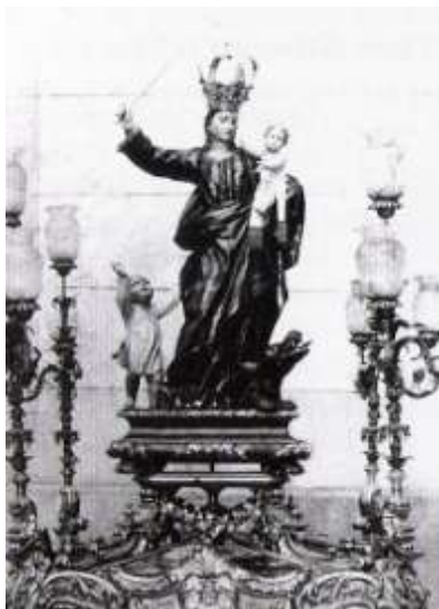
Ilustración 04. Talla de Nuestra Señora del Socorro, Ignacio Vergara, siglo XVIII. (Ricart, 1977:82).

Ignacio Vergara e Hipólito Rovira, trabajaron juntos en la famosa portada de acceso al palacio de los marqueses y en la conocida como “Carroza de las Ninfas”, realizada en 1753. 10 La relación de los marqueses con el escultor Vergara no terminó con estos trabajos, ya que también realizó dos tallas para la antigua capilla del palacio que poseían en su señorío de Benetússer, convertida desde el siglo XVI en parroquia del lugar. Se trataba de una talla con la imagen de Nuestra Señora del Socorro y otra con la Virgen de los Desamparados, que fueron quemadas a finales de 1936 en el ambiente bélico de la Guerra Civil española (Ricart, 1977: 78-85).