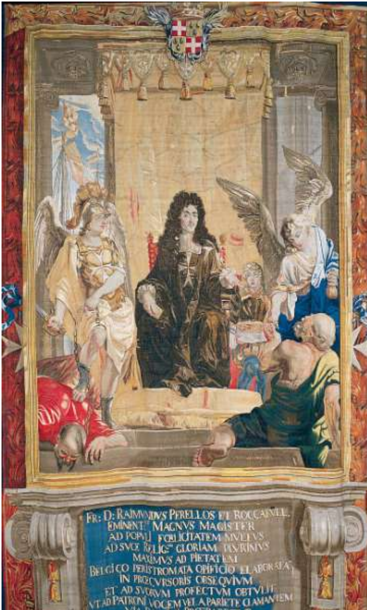
Ilustración 02. Tapiz-retrato de Ramón Rabassa de Perellós y Rocafull, Gran Maestre de la Orden de Malta. Taller de Judocus de Vos, siglo XVIII.