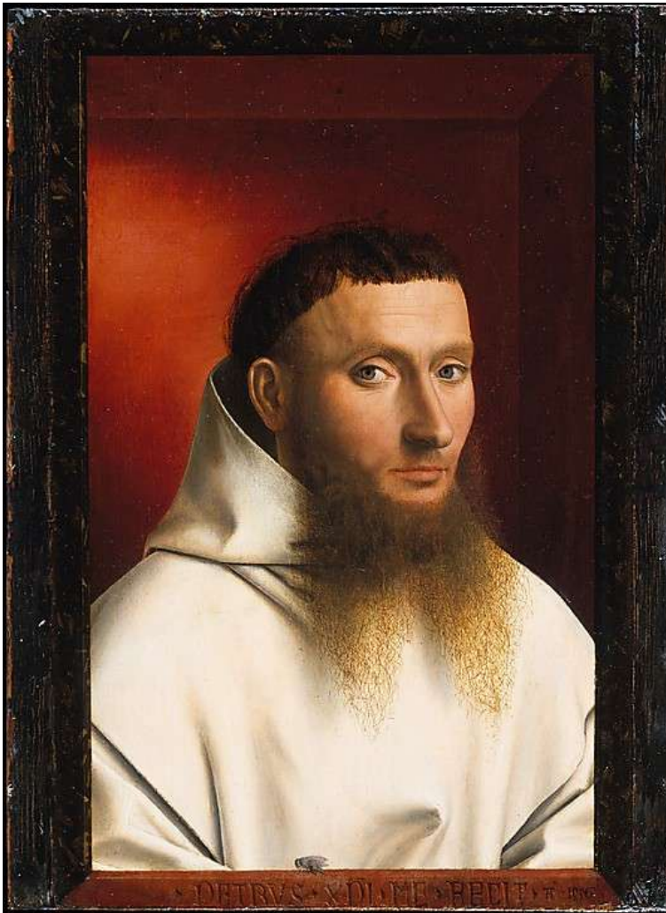
Ilustración 08. “Monje cartujo”, Petrus Christus, 1446. Metropolitan Museum of Art, Nueva York.