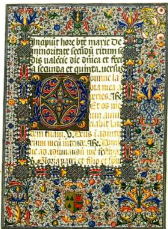
Ilustración 01. Escudo heráldico del Libro de Horas de los marqueses de Dos Aguas. (Santiago, 1993:66)