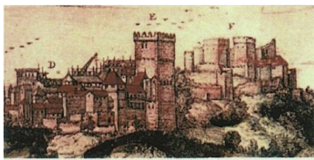
HUM-165: Patrimonio, Cultura y Ciencias Medievales