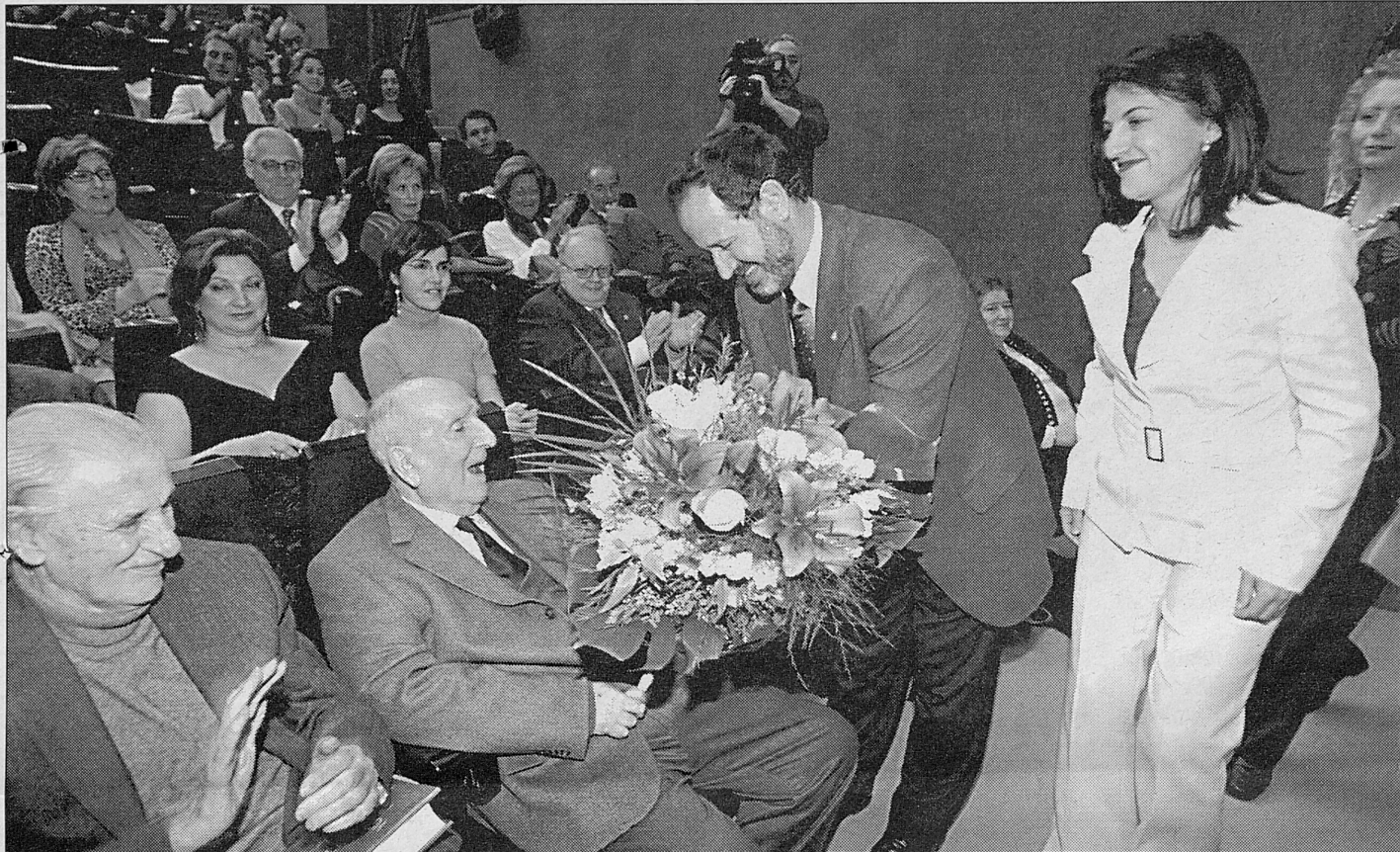
En marzo el autor vio publicadas en vida sus obras completas. CHARO VALENZUELA

EL AUTOR SUFRIÓ UN DETE- RIOR EN TODOS SUS ÓRGA- NOS VITALES EL PASADO LUNES. POR DESEO EXPRESO DEL DRAMATURGO, SUS RESTOS DESCANSARÁN EN SALOBREÑA, DONDE VIVÍA EN UNA CASA QUE ASOMA AL MAR