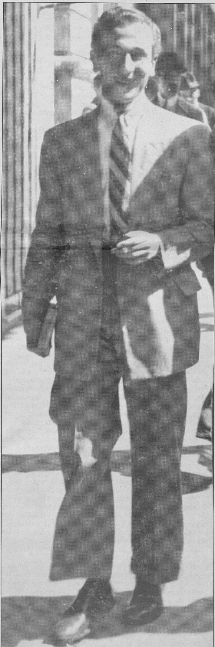
Año 1943. Nuestro autor paseando por la Gran Vía de Granada.

P rimeros guerra estudios, juventud y guerra civil