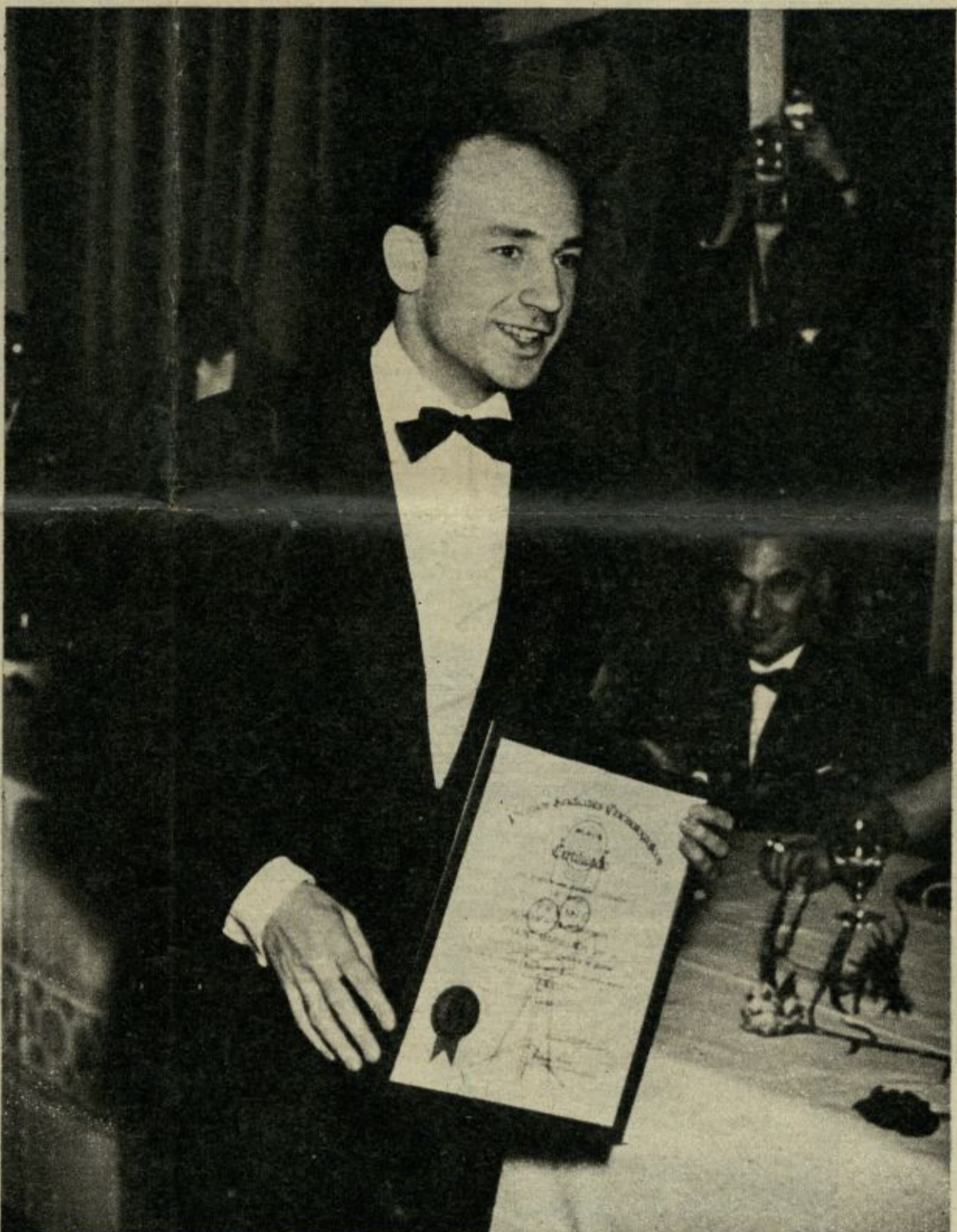
Marsillach, premiado como actor cinematográfico.