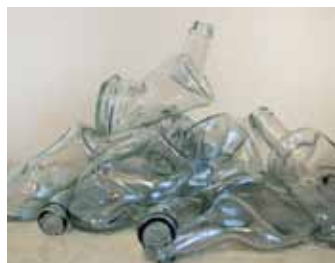
MORENO DE WASSERMAN, Ruth Identidades 2009 Vidrio deformado 40 x 28 x 12 cm Donación de la artista

pintor o el fotógrafo. El retorno a la manipulación matérica confiere al artista la autonomía de poder decir lo que quiere de la forma en que quiere.