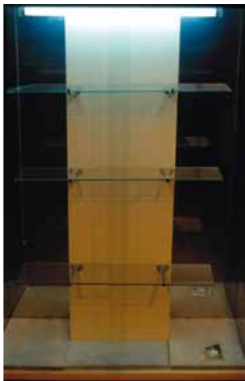
VERA CAÑIZARES, Santiago Vitrina II (Serie Palingenesias) 1966 Madera, acero inoxidable, lámpara fluorescente, fotografía, mármol y cristal 90 x 127 x 34 cm