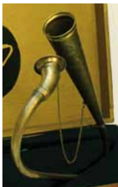
AICARDI, Gabrielle Sin título 2007 Metacrilato 22,5 x 17 x 5 cm

contrastan ampliamente con las curvas exquisitamente penetradas de Intersección de M a Huertas Sánchez Gil. Las mismas formas curvas que unidas a un magistral trabajo de forja conforman Atún de Balbino Montiano se nos presenta como obra de autor claramente diferenciable y único.