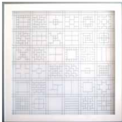
GORAFE, Alejandro Sin título 2009 Tela metálica 100,5 x 100,5 cm