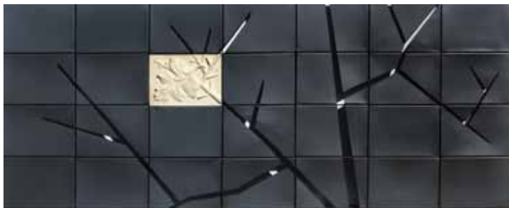
BELLIDO MARQUEZ, Carmen Vulcanometría I: Paisaje 2007 Chapa de hierro y piedra caliza tallada 85 x 210 x 4 cm