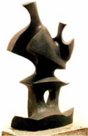
BLANCO CASTAÑO, Javier Les restes du Diner 2007 Bronce Premio Alonso Cano, modalidad de Escultura, 2007 20 x 27 x 25 cm