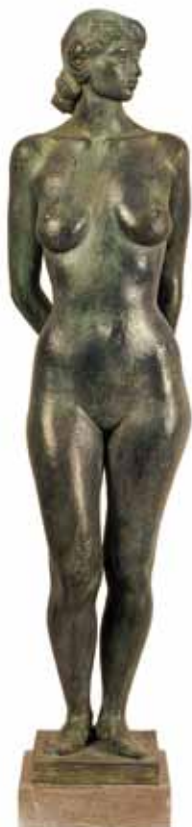
CASTRO VÍLCHEZ, José Antonio Sin título 1997 Bronce 92 x 19 x 14 cm

De la sinuosidad cadente de las obra de Pepe Castro Vílchez como figuración y la de Miguel Fuentes del Olmo desde la abstracción, a la crudeza de Les restes du diner de Javier Blanco, sólo hay una diferencia (además del concepto), la forma de manipular el material, de lo suave para lo sublime a lo tosco para lo cotidiano.