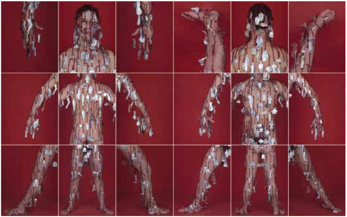
MONTEAGUDO VILLANUEVA, Andrés "De la serie LETANÍA" Fotografía laminada sobre aluminio 2005 184 x 310 cm. (18 fotografías de 60 x 50 cm)

Arte Contemporáneo, no entiende que una serie de planchas metálicas en la que no hay rastro de manipulación por parte del artista, pueda ser considerada como Obra de Arte. Esta disociación Arte-sociedad queda patente en obras como Aluminio y Zinc realizada por Carl André en 1970 o en las obras de Elena Asins, premio nacional de Escultura por ser precursora del Arte Conceptual en España, donde el aspecto industrial de sus obras geométricas hacen pensar al público no experto que el artista no ha realizado nada.