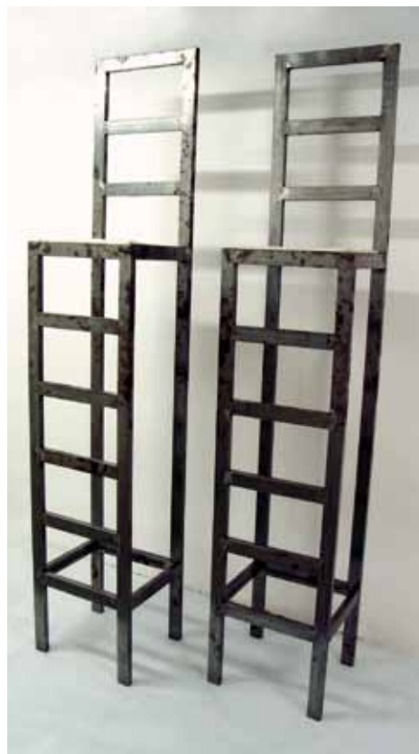
BAYONA GONZÁLEZ, Fernando Para que no me olvides Hierro y cuero artificial Dos piezas de 230 x 45 x 48,5 cm