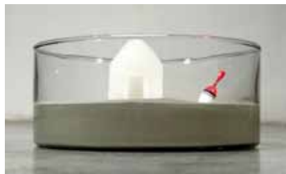
MAZUECOS SÁNCHEZ, Belén Ecosistemas domésticos 2010 Instalación. Dimensiones Variables (5 piezas) Materiales: cristal, cera, parafina, plomo, madera, estopa y objetos encontrados