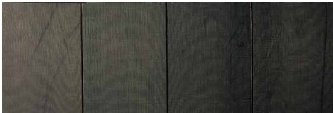
AVILÉS MARTOS, Manuela. Non site 2001 Caucho y metal Políptico 120 x 80 cm Cada una.