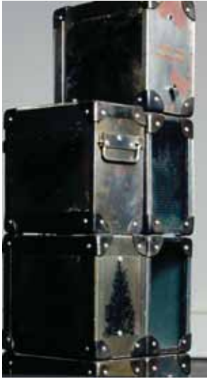
MOLINA, Tucho La nave de los locos 1996 Metal, técnica mixta 110 x 26,5 x 24 cm Premio Federico García Lorca modalidad Escultura, 1996