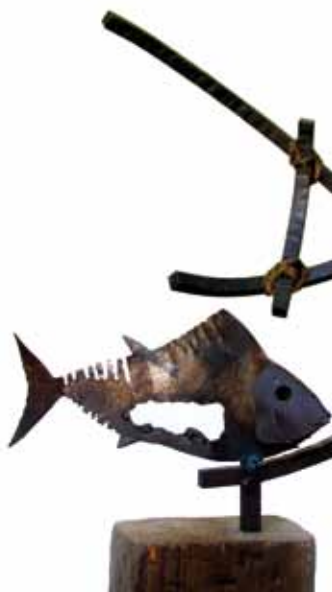
MONTIANO BENÍTEZ, Balbino Atún 2008 Hierro forjado, madera y cuerda 112 x 30 x 21 cm Donación del artista