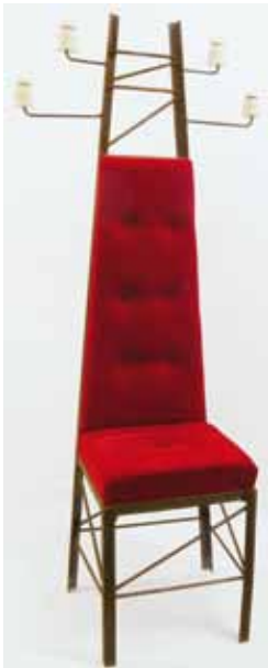
SANTOS GODOY, Rafael Silla para meditar 2010 150 x 40 x 75 cm Premio Alonso Cano 2010, modalidad de escultura

catálogos de las más prestigiosas casas de subastas. Quizá esto está o, mejor dicho, estuvo motivado porque en muchos momentos de la historia la escultura fue desprovista de cualquier tipo de idea o concepto, siendo simplemente materia y forma los referentes valorables. El siglo XIX, con el Romanticismo y, sobre todo, con el Neoclásico es un claro ejemplo de lo anterior.