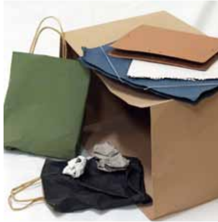
FUSTER, Rafael Sin título 2004 32 x 46 x 25 cm