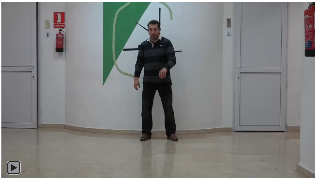
Figura 3. Juego motor con patrón de malabares con lanzamiento de una bola al suelo con la mano NO hábil con rebote pasivo y recepción con mano NO hábil, (figura RP2).

Lanzamiento de una bola al suelo con la mano NO hábil con rebote activo y recepción con mano NO hábil, ver figura 3 o RP2.