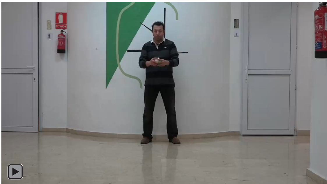
Figura 1. Juego motor con patrón de malabares de Rebote Pasivo con Tres Bolas en el Suelo (figura RP6)

La figura 1 o figura RP6 es el objetivo final, conseguir realizar malabares con 3 bolas con Rebote Pasivo en el Suelo.