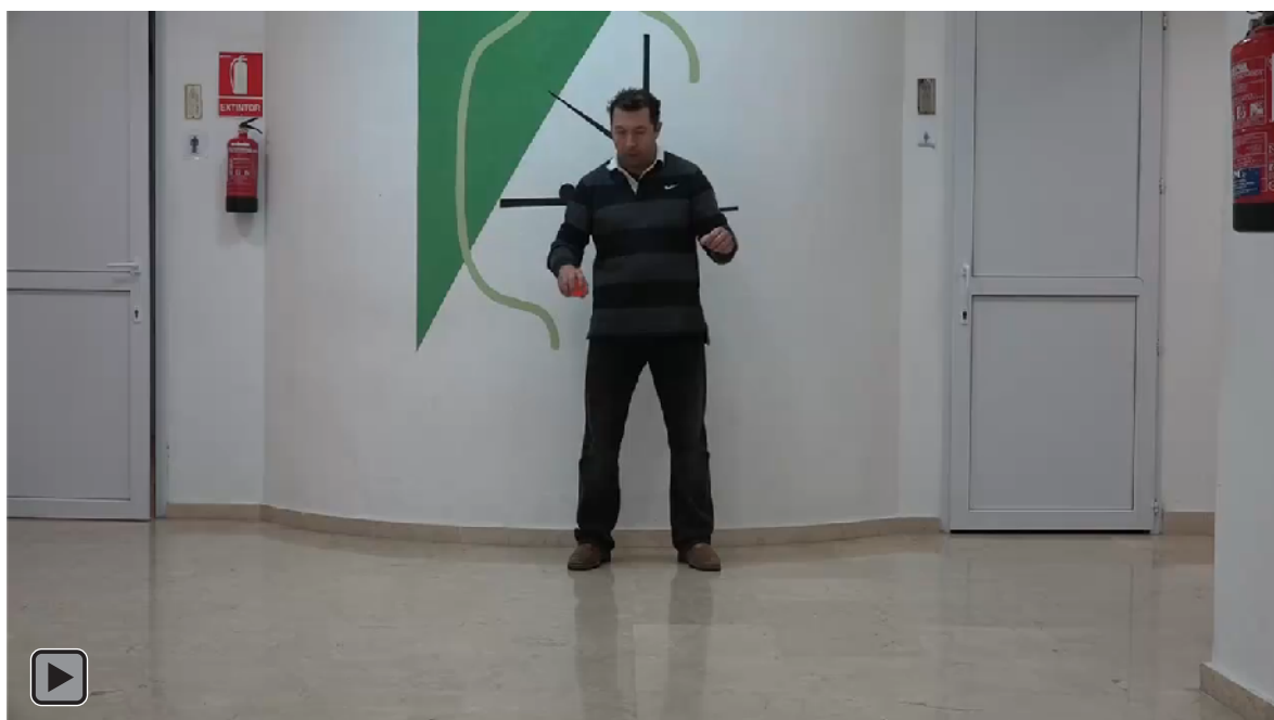
Figura 2. Juego motor con patrón de malabares de Rebote Pasivo con una bola en el suelo con mano hábil (figura RP1)

Lanzamiento de una bola al suelo con la mano hábil con rebote activo y recepción con mano hábil, ver figura 2 o RP1.