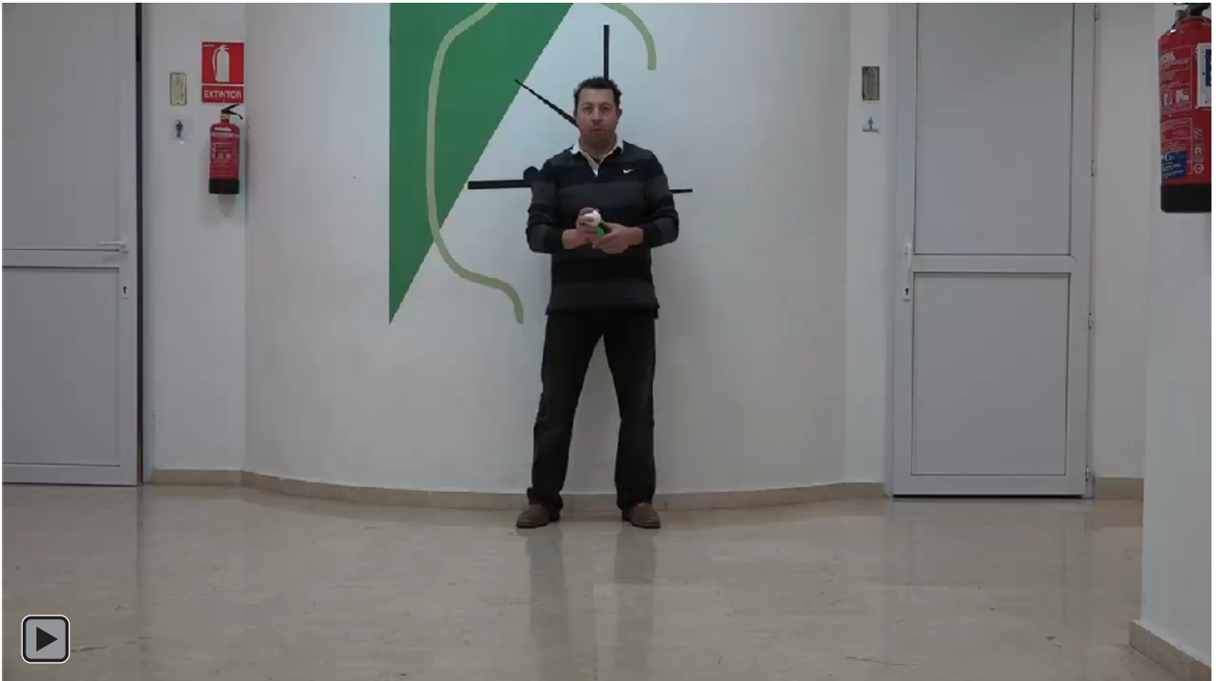
Figura 6. Juego motor con patrón de malabares con rebote pasivo con 3 bolas 3 a 5 lanzamientos y recepciones y parada (figura RP5)

Malabares con rebote pasivo con 3 bolas 3 a 5 lanzamientos y recepciones y parada, ver figura 6 o RP5.