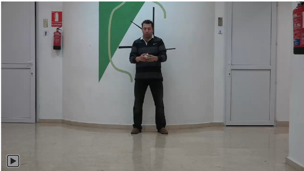
Figura 7. Juego motor con patrón de malabares de Rebote Pasivo con Tres Bolas en el Suelo (figura RP6)

Malabares con rebote pasivo con 3 bolas en el suelo, lanzamientos y recepciones de forma continua, ver figura 7 o RP6.