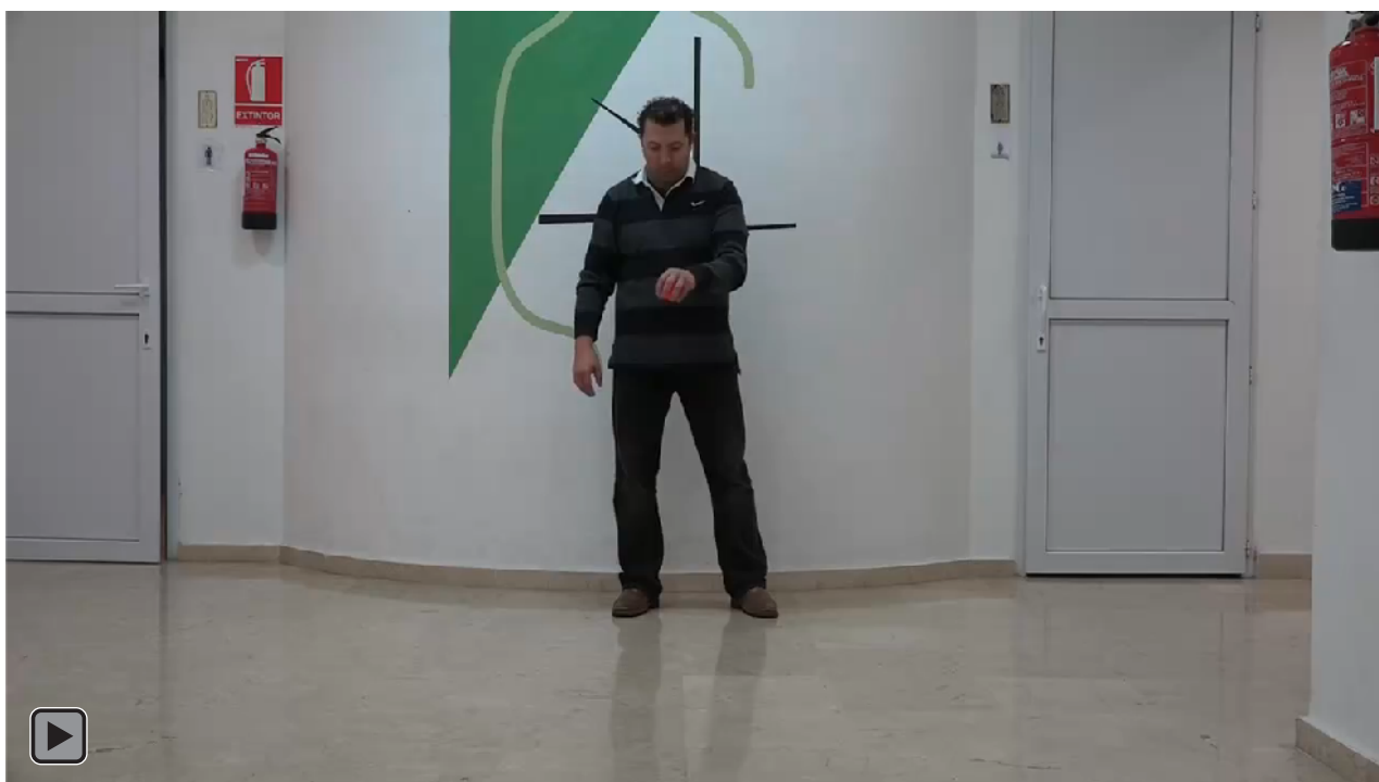
Figura 4. Juego motor con patrón de malabares con lanzamiento de una bola al suelo con la mano hábil con rebote pasivo y alternando recepción con mano NO hábil, y al revés (figura RP3)

Lanzamiento de una bola al suelo con la mano hábil con rebote pasivo y alternando recepción con mano NO hábil, y al revés, ver figura 4 o RP3.