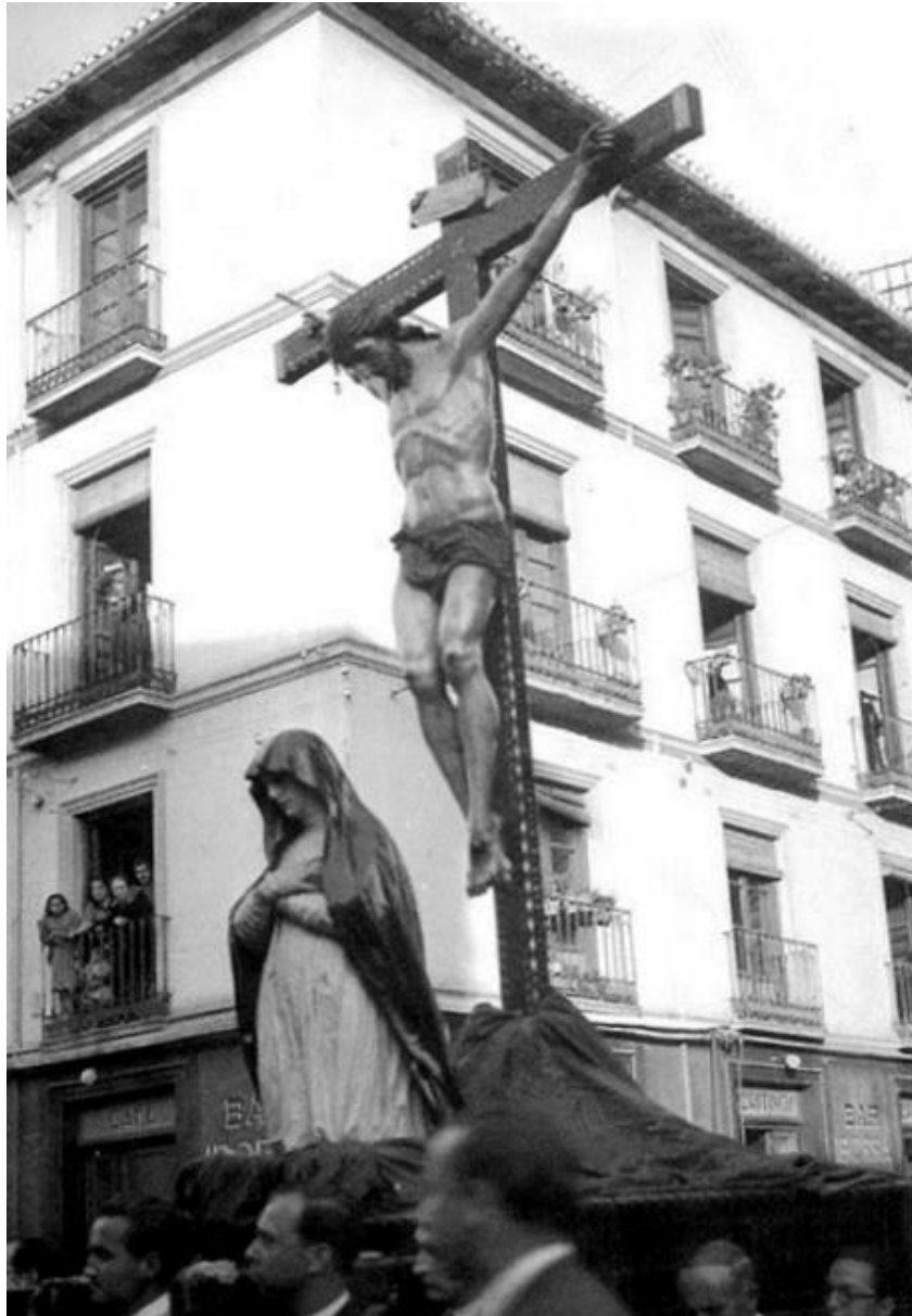
FIG. 12. Procesión con la Dolorosa y el Cristo de Mora , J. Martínez Rioboo, 1918-20.

imagen. Desde esta nueva hermandad, se promoverá la ampliación de los cultos en un novenario y, se favorecerá la presencia de la Virgen de los Dolores en actos penitenciales, así como su participación en la procesión oficial del Santo Entierro desde 1894 (López-Guadalupe Muñoz y López-Guadalupe Muñoz, 2002: 259-72). A partir de este momento, la efigie de la dolorosa queda estrechamente unida a la celebración contemporánea de la Semana Santa granadina, procesionando dentro de los viacrucis oficiales, ya sea en soledad o a los pies del Cristo de la Salvación —hoy de la Misericordia —, salido de la gubia del mismo autor en 1688 23 . (Fig. 12)