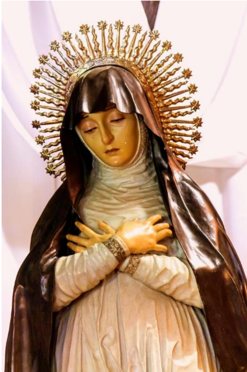
Fig. 10. Virgen de los Dolores —detalle—, José de Mora, 1671. Iglesia de Santa Ana, Granada.

cabellera suelta, así como ataviadas con una viva y contrastada policromía. Si bien ni Mora ni sus seguidores abandonarán nunca este recurso más relajado, lo cierto es que en la última etapa de José habrá un más que claro predominio de las fisonomías ceñidas por el rigor del luto castellano.