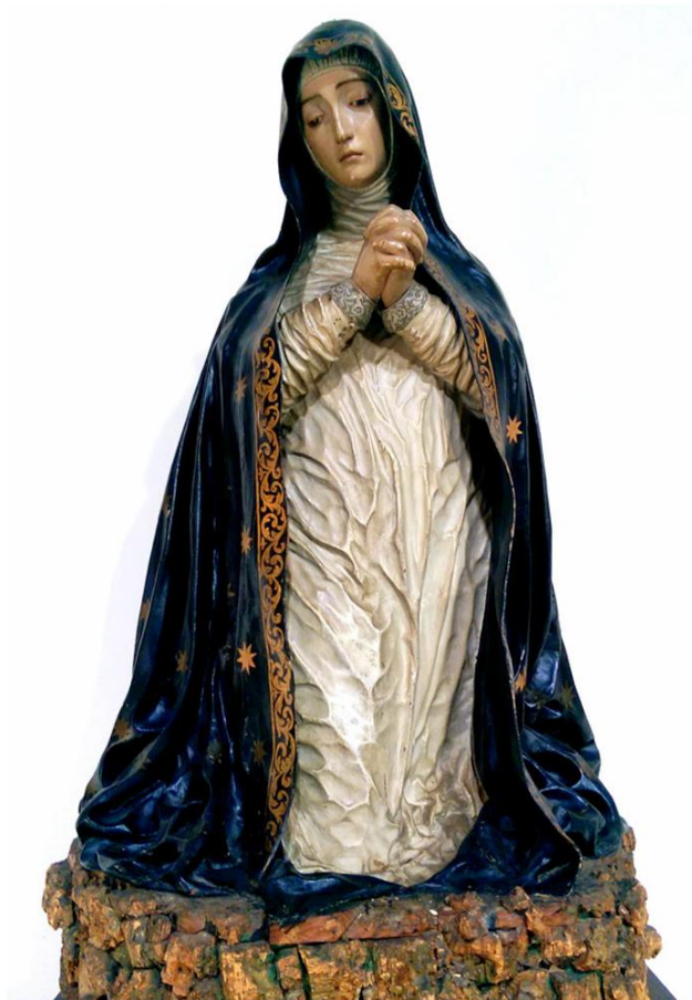
Fig. 4. Virgen de la Soledad (de los jesuitas), Torcuato Ruiz del Peral, mediados del siglo XVIII. Iglesia de San Juan de los Reyes, Granada.