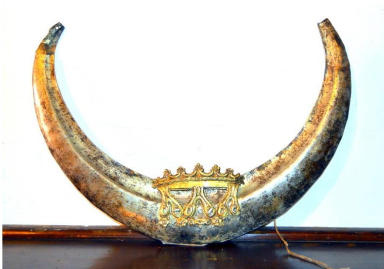
Fig. 11. Media luna de la Virgen de los Dolores , autor desconocido, h. 1671, plata pulida y sobredorada. Iglesia de Santa Ana, Granada. Se trata de la alhaja original de la dolorosa de Mora, conservada en un notable estado de deterioro.

El trasiego de los Siervos de María era prácticamente cotidiano en la asistencia a la meditación diaria de los Siete Dolores. Asimismo, las honras solemnes con que servitas y felipenses rendían el debido culto a su compartida titular, se celebraban de forma mensual, en el tercer viernes de cada mes. Las funciones principales quedaban fijadas, de un lado con la celebración litúrgica del Viernes de Dolores, la cual corría a cargo de la congregación oratoriana, contando con la asistencia del Cabildo de la Ciudad, en cumplimiento del voto profesado el 18 de marzo de 1674 (Chica Benavides, 1764: Septiembre 17).