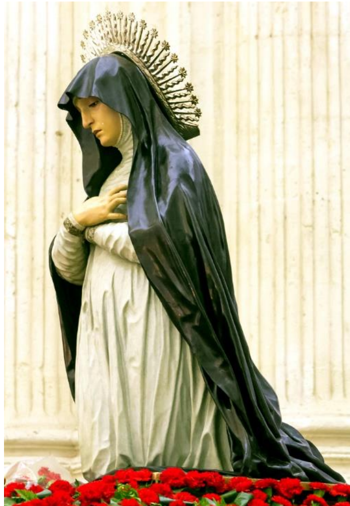
FIG. 9. Virgen de los Dolores —actual Soledad del Calvario —, José de Mora, 1671. Iglesia de Santa Ana, Granada.

Ya en un principio, dentro de la iglesia primitiva la imagen se presentaba con una mínima elevación, lo que, unido a la angostura del lugar, implicaba ciertas dificultades a la hora de visualizar correctamente el semblante de la Dolorosa. El principal obstáculo que para ello se presentaba lo constituía la disposición original entrelazada de sus manos. Con todo, esta disposición cumplía asimismo una finalidad muy concreta, pues en aquellos primeros años de la andadura felipense, aquellas manos recibían en determinadas celebraciones un ostensorio cardiomorfo que hacía las veces de custodia eucarística en determinados ejercicios del Oratorio, al carecer por entonces de manifestador.