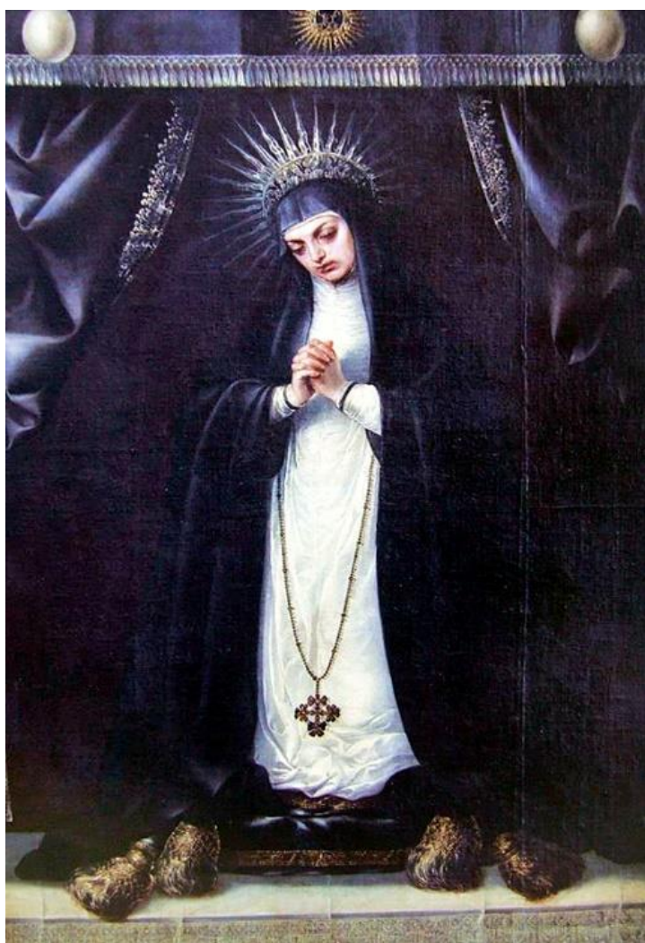
Fig. 2. Virgen de la Soledad , Alonso Cano, h. 1652, óleo sobre lienzo. Catedral de Granada.

Así pues, la particular confraternidad de los servitas ya había sido instaurada en Granada para 1668, con la asignación de sede en la capilla de la Virgen de las Tres Necesidades de la Parroquia de Santiago. En apenas tres años la abandonarían para trasladarse al recién fundado Oratorio felipense, bajo las estratégicas pautas de consolidación marcadas por Escolano. Previamente a la materialización del enunciado cambio de sede, la congregación oratoriana, auspiciada por el mismo arzobispo, se encontraba preparando el terreno para que, desde el Oratorio y desde la corporación servita, la gran acogida y veneración popular de que ya gozaba aquella primitiva Virgen del Oratorio fuese en aumento con la concreción de la que se había convertido en una de las grandes devociones nacionales.