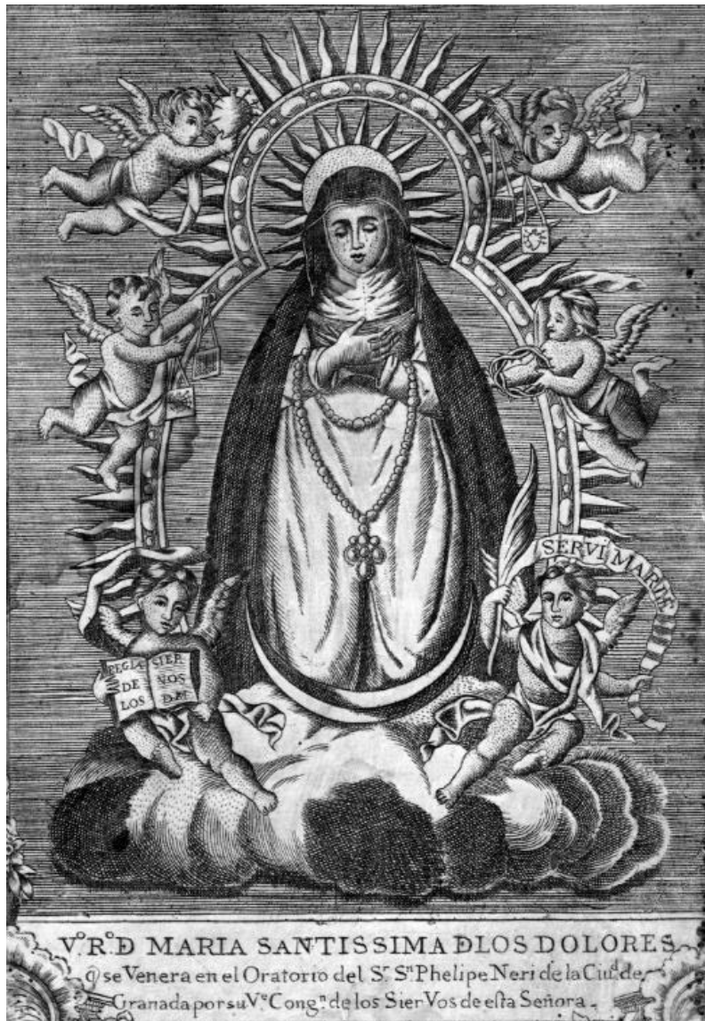
Fig. 6. V.º R.º De María Santísima de los Dolores, que se venera en el Oratorio del Sr. Sn. Phelipe Neri de la Ciu.ª de Granada, por su V.º Cong.ª de los Siervos de esta Señora , autor desconocido, h. 1766, calcografía, 25,9x17,6cm.

votos y ofrendas, con que agradecidos y reverentes adornan las paredes de su Sagrado templo los Fieles” (Hurtado de Mendoza, 1689: 262). (Fig. 6)