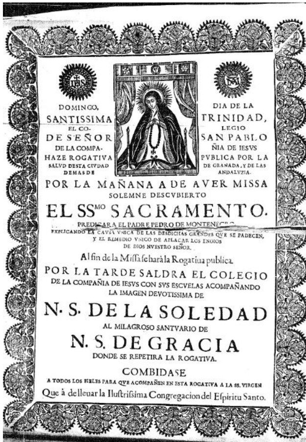
FIG. 3. Cartel anunciando rogativa y sermón a la Virgen de la Soledad, autor desconocido, Granada, h. 1767.