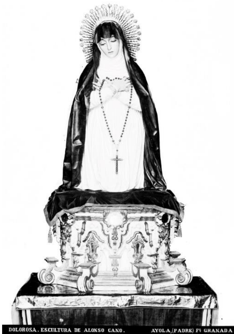
Fig. 7. Dolorosa. Escultura de Alonso Cano , José Ayola García, 1863-82, fotografía sobre vidrio.

con plenitud una terribilità latente mas no visible, contexto en que la Virgen de los Dolores de los felipenses emerge como el perfecto compendio de todo un tratado plástico de la más pura dulzura, quebrantada por el más agudo dolor del ánimo. (Fig. 7)