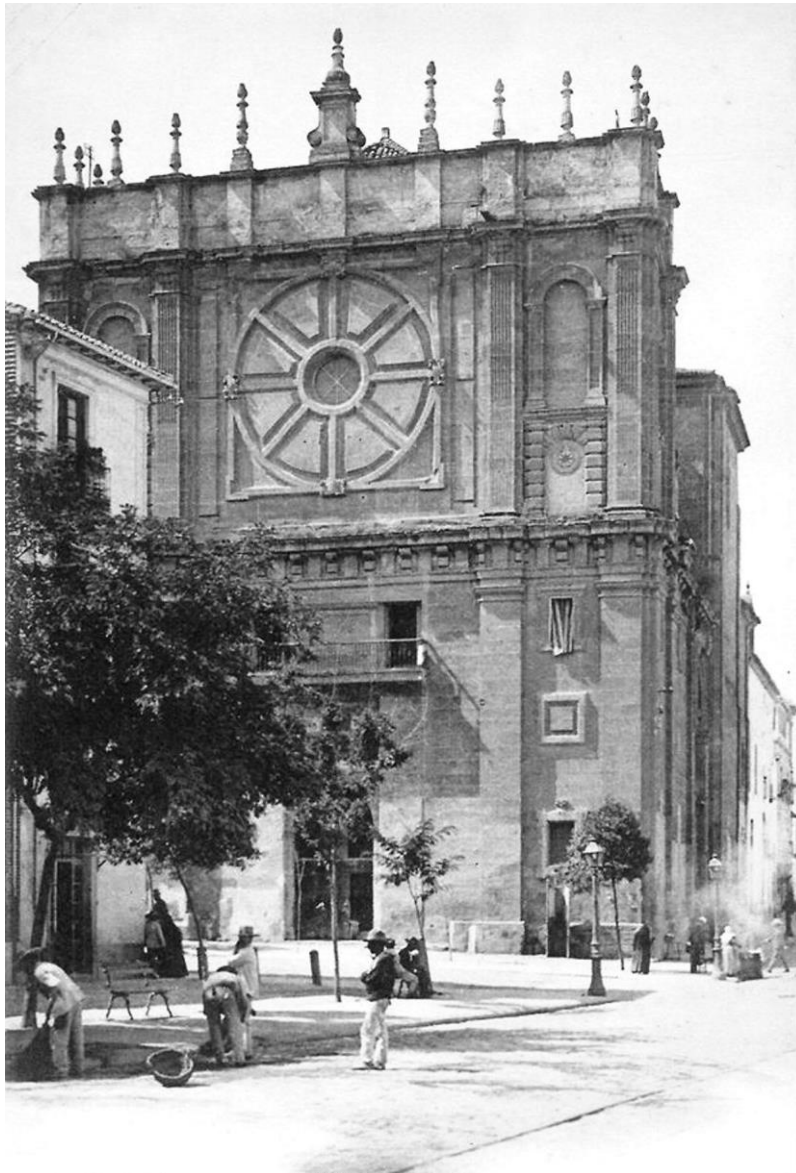
Fig. 1. El antiguo Oratorio de San Felipe Neri (1686-1752) convertido en fábrica y almacén de abonos químicos, autor desconocido, h. 1908.

interpelación fuese más fácilmente explotable según marcaban los usos contrarreformistas. (Fig. 1)