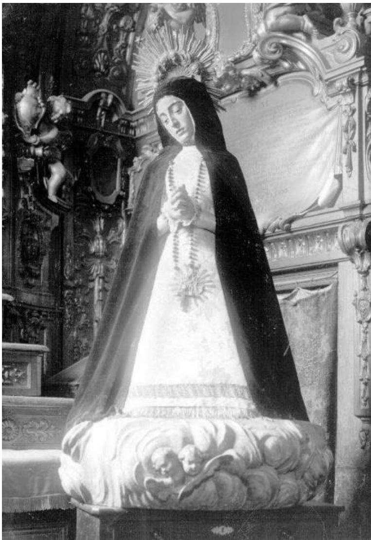
Fig. 5. Virgen de la Soledad , Gaspar Becerra, 1565. Convento de la Victoria de Madrid. Destruída en 1936.

Por ello, si aquella enunciada en primer lugar pasaba a convertirse en la imagen hegemónica y modélica del tipo iconográfico en Granada y su área de influencia, no es de extrañar que una cierta confusión acabase adueñándose de la historiografía posterior. Máxime cuando la obra de Mora convivió durante un breve tiempo con su homóloga en el antiguo templo jesuítico 3 . El mismo conde de Maule otorgaba la paternidad de la dolorosa oratoriana a Ruiz del Peral a comienzos del siglo XIX (Cruz y Bahamonde, 1812: XII, 233-4). Con ello, sentó una atribución en la que reincidiría José Giménez-Serrano en su Manual del artista y del viajero en Granada (Giménez-Serrano, 1846: 9). Con todo, al igual que sucedió con Mora, desde el preciso instante en que la figura de Ruiz del Peral comience igualmente a disiparse en el olvido a lo largo del siglo XIX, la Virgen de los Dolores , ya en la Parroquia de Santa Ana tras la desamortización, volverá a cambiar de paternidad adoptiva, para abrazar temporalmente la de Alonso Cano 4 .