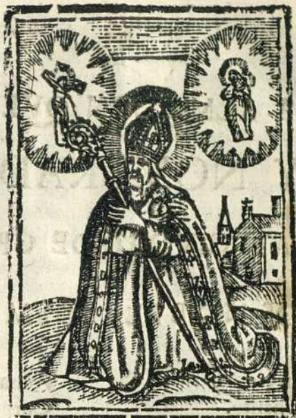
S. GREGORIO EL BETICO.