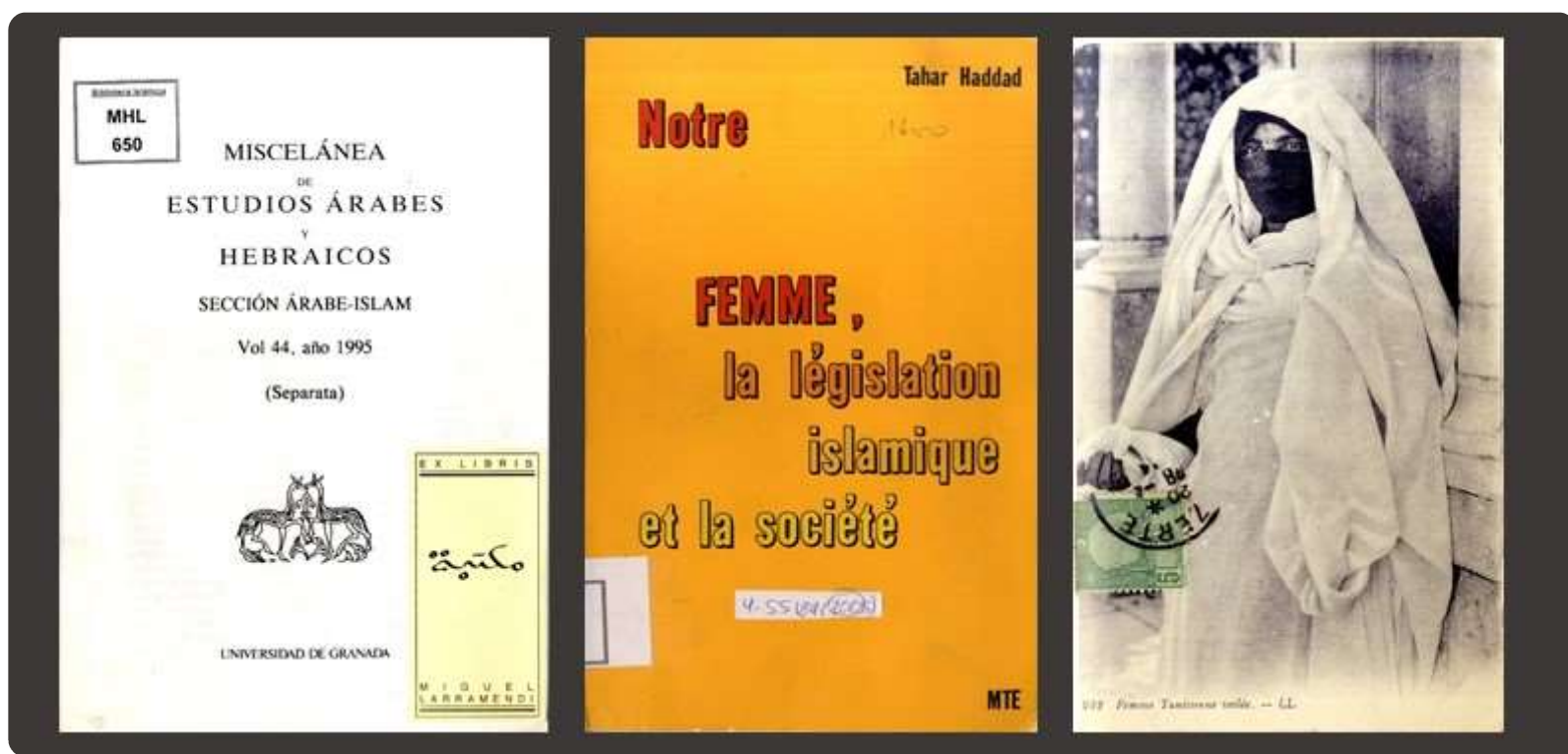
El código tunecino de estatuto personal, en: Miscelánea de estudios árabes y hebraicos (MHL-650) — 2. Notre femme, la législation islamique et la société . Túnez, 1978 (AGR-475) — 3. Imagen extraída de la obra: Voiles = Veils (CAA-229)

Este libro consta de dos partes: una que recoge todas las cuestiones relacionadas con la legislación y otra donde se habla de los asuntos de trasfondo cultural y social . En el apartado legal, el autor desgranó aquellas cuestiones que, revestidas de un falso halo religioso, oprimían a las mujeres de su tiempo. Entre otras, analizó el enclaustramiento y el velo integral. En la época de Ḥaddād, las mujeres tunecinas tenían implícitamente prohibido salir de casa solas, a menos que fuera por una cuestión de vida o muerte. Si querían abandonar el hogar, debían hacerlo completamente cubiertas por un velo integral y acompañadas de un pariente masculino. Esta tradición, que procedía del ámbito cultural, se había ido revistiendo de un cariz religioso a través del discurso de los exégetas coránicos. No obstante, Ḥaddād insistía en que es un añadido a la fe islámica, que no tenía nada que ver con ella y que, por tanto, debía erradicarse. Aún iba más allá, defendiendo que el enclaustramiento atentaba contra el derecho coránico de disponer libremente de los bienes, puesto que las mujeres enclaustradas no podían, por ejemplo, visitar otras casas que tuvieran, ya que ello implicaba abandonar el hogar.