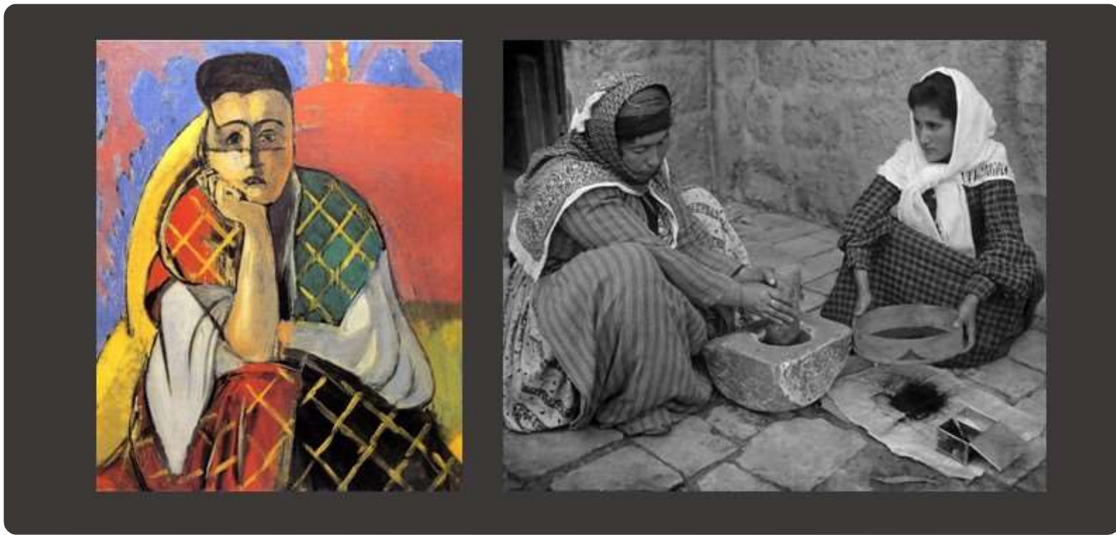
1. Woman with a veil , Matisse 1927, MOMA (CAA ART FOT 64001) — 2. Mujeres . Wikimágenes. CC0 (Pixabay)

¿Os habéis quedado con ganas de saber más sobre el feminismo en Túnez? La Biblioteca cuenta con numerosos fondos para ahondar en la cuestión como los que ilustran esta entrada y otros más que recogemos aquí: