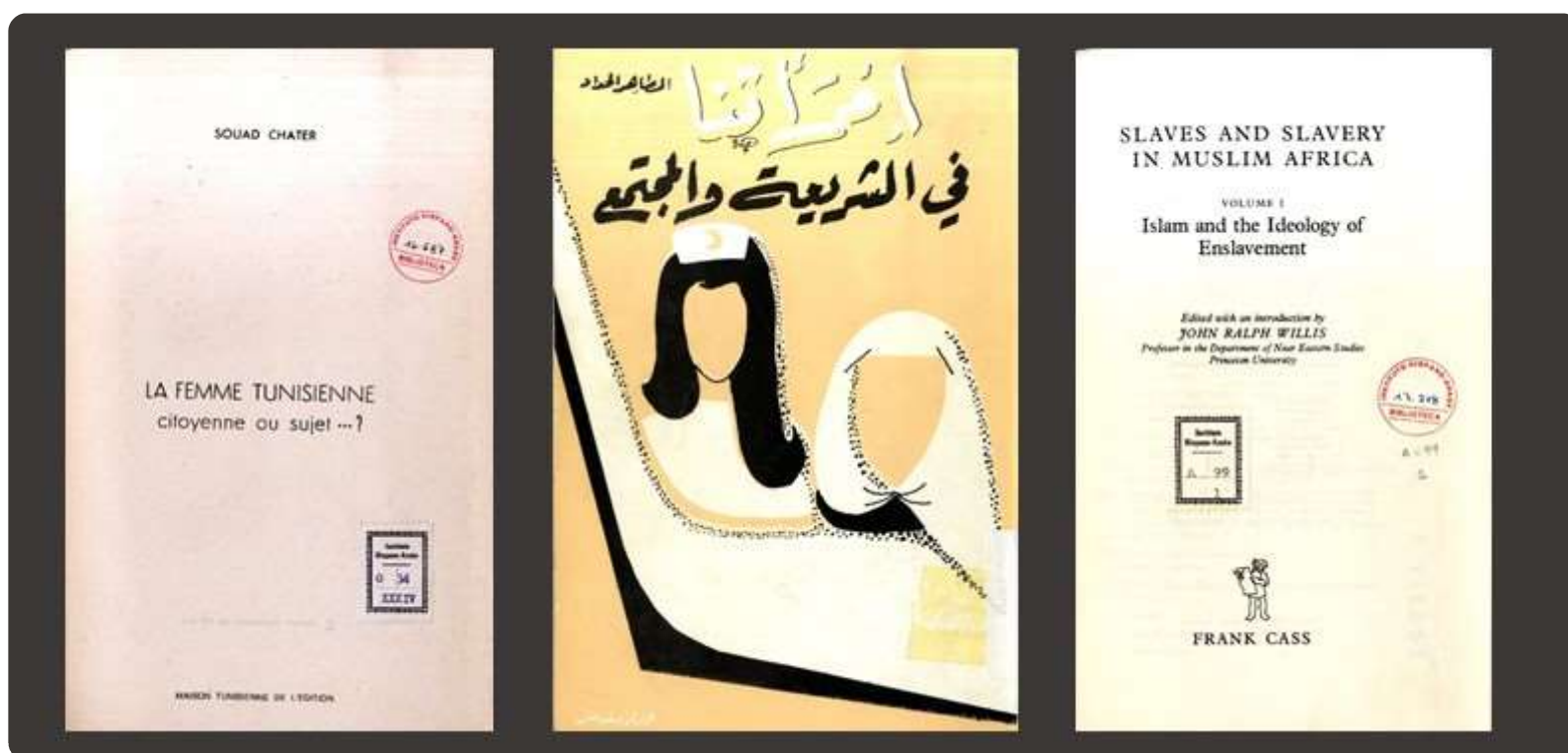
1. Le femme tunisienne, citoyenne ou sujet (4-2006) — 2. Imrā'tu-nā fi-l-šarī'a wa-l-muḡtama' (4-29624) — 3. Slaves and slavery in Muslim Africa (4-21100 y 4-21101) 2 vols.

Ḥaddād estuvo interesado por muchos ámbitos, pero los últimos años de su vida los dedicó a luchar por la emancipación femenina, aunque siempre dentro del marco de la libertad nacional. Claro, ¿cómo iba Túnez a ser un país libre si la mitad de su población vivía oprimida? Para intentar convencer a sus coetáneos de la importancia de esta cuestión, escribió una obra insoslayable para el estudio del feminismo árabe: Imrā'tu-nā fi-l-šarī'a wa-l-muḡtama' . En la Biblioteca de la AECID se encuentra tanto en árabe como en francés ( versión 1 y versión 2 .