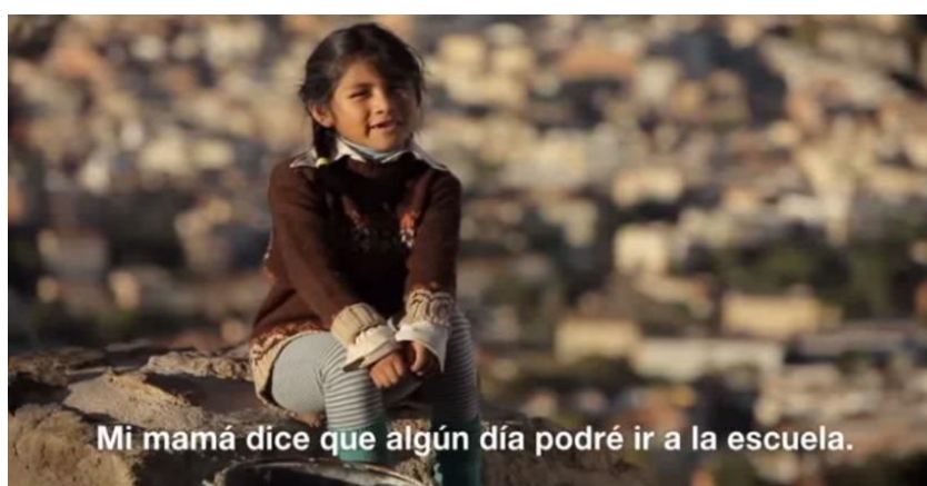
Figura 1. Imagen del spot de la campaña de 2013 “No hay justicia sin igualdad”. Captura de pantalla de https://youtu.be/Y5_BWIL_vOA (Fecha de consulta: 18/05/2016).

Algunos casos de la muestra ubican su acción en zonas indeterminadas, interiores con un sentido abstracto o universal, además de mostrar el contraste Norte-Sur desde la ironía. Otros espacios urbanos, como el suburbio de la gran ciudad, muestran la pobreza como marco de la acción y, en muchos casos, como fondo de una historia esperanzadora (Figura 1), aunque casi la mitad de los spots están ambientados en entornos rurales, en los que se desarrollan faenas del campo o en el interior de escuelas de pequeñas poblaciones.