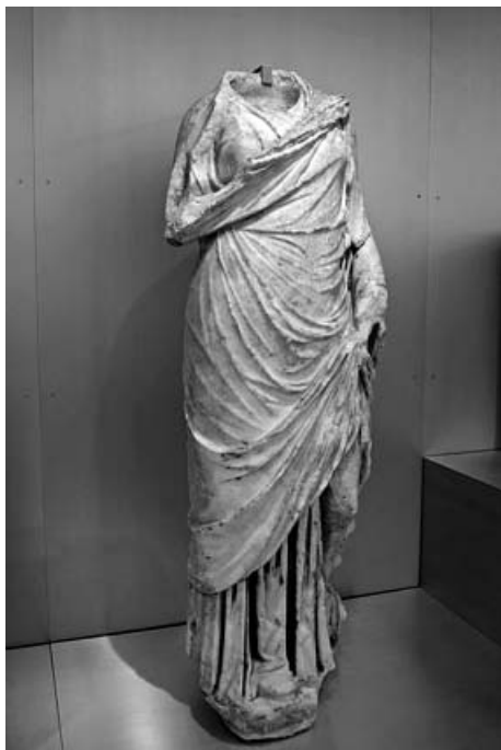
Escultura de matrona procedente de Baelo Claudia (Cádiz, España).

La intervención arquitectónica y ornamental de Iunia Rustica no se limitó al foro pues también acometió otra importante infraestructura cívica como los baños con la cesión del suelo, la construcción de unos pórticos y piscina para los mismos, y la dotación de una estatua de Cupido. La demostración de su poder e influencia en la ciudad se agrandó además con la decisión de pagar los vectigalia públicos. Su condición de sacerdotisa primera y perpetua del culto imperial, su pertenencia a una de las familias influyentes de la Bética y su decisión de adornar la ciudad con imágenes, como las estatuas de los dioses citados, que mostraban una estrecha vinculación con los modelos ideológicos romanos, hacen aparecer a Iunia Rustica como agente activo de romanización y de integración de su ciudad, Cartima, en el modelo cultural romano. Es