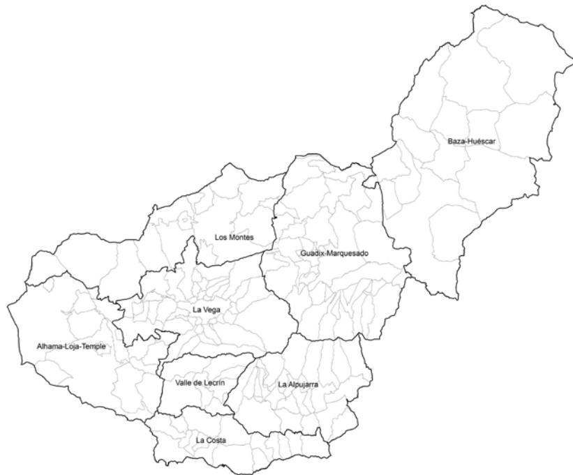
FIG. 2/ División comarcal de la provincia.