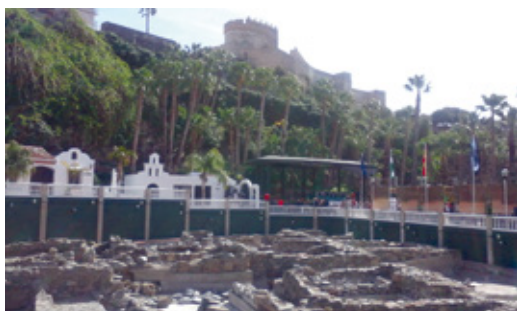
FIG. 5/ Unidad de paisaje tipo. Grupo A. Comarca de la Costa. Almuñécar: Yacimiento arqueológico fenicio. Castillo árabe. Jardín botánico del Majuelo

Es de destacar en el Grupo D, suelos urbanos comunes, intervenciones en espacios contemporáneos, la regulación de los vuelos y cuerpos volados de los edificios con el fin de evitar obstrucciones visuales en las unidades de paisaje de valor cercanas. Y las determinaciones para el diseño del espacio público que queda restringido a sólo tres modelos tradicionales: plaza, jardín y paseo-bulevar.