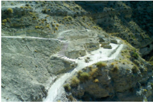
Fig. 7/ Unidad de paisaje tipo. Grupo C. Comarca de Baza-Huésca. Galera. Poblado ibérico

En el Grupo E, se regulan las intervenciones en suelos urbanizables sin desarrollar y los urbanizables comunes, ambos deberán ser revisados en la redacción del nuevo planeamiento, en cuanto a su clasificación y categoría; y transitoriamente quedan reconocidos los dos como Suelos de Hábitat Rural Diseminado. En los dos casos se realizará inventario de los elementos de valor: hitos, cimas, valles, caminos, sistema hídrico, arbolado, parcelación histórica y caserío, los cuales deben ser preservados del proceso urbanizador, e integrados, en el caso de suelos urbanizables, en el desarrollo urbano futuro.