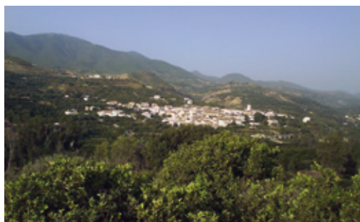
FIG. 6/ Unidad de paisaje tipo. Grupo B. Comarca del Valle de Lecrín. Naranjales al pie del Parque Nacional de Sierra Nevada