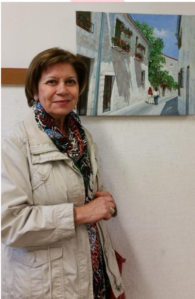
La autora posando junto a su obra.