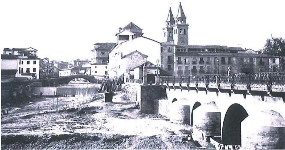
DESEMBOCADURA DEL RÍO DARRO EN EL RÍO GENIL. PUENTE DE LA BASILICA DE LA VIRGEN DE LAS ANGUSTIAS. AÑO 1835

Como sabemos que os habéis quedado con ganas de más os invitamos a leer el resto del trabajo. El texto completo en el blog de Aluma: alumaasociacion.wordpress.com . ¡No os lo perdáis!