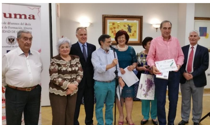
El autor posando con la Junta Directiva tras recibir su Premio.