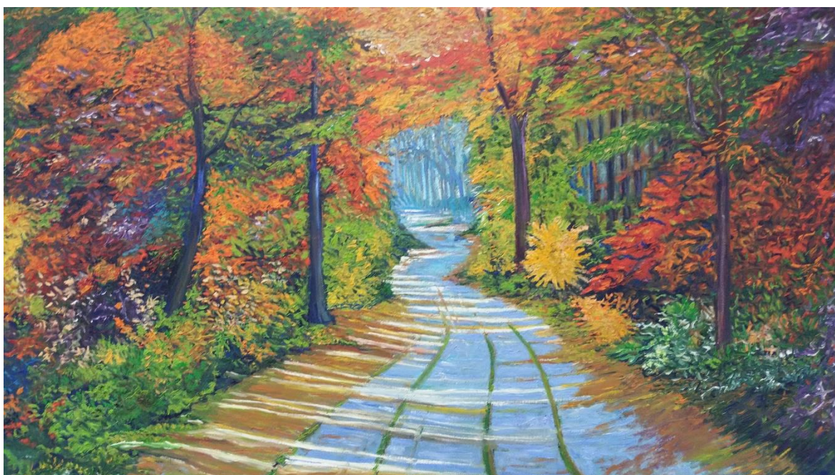
“Sutilidades” de D. Pedro Triguero