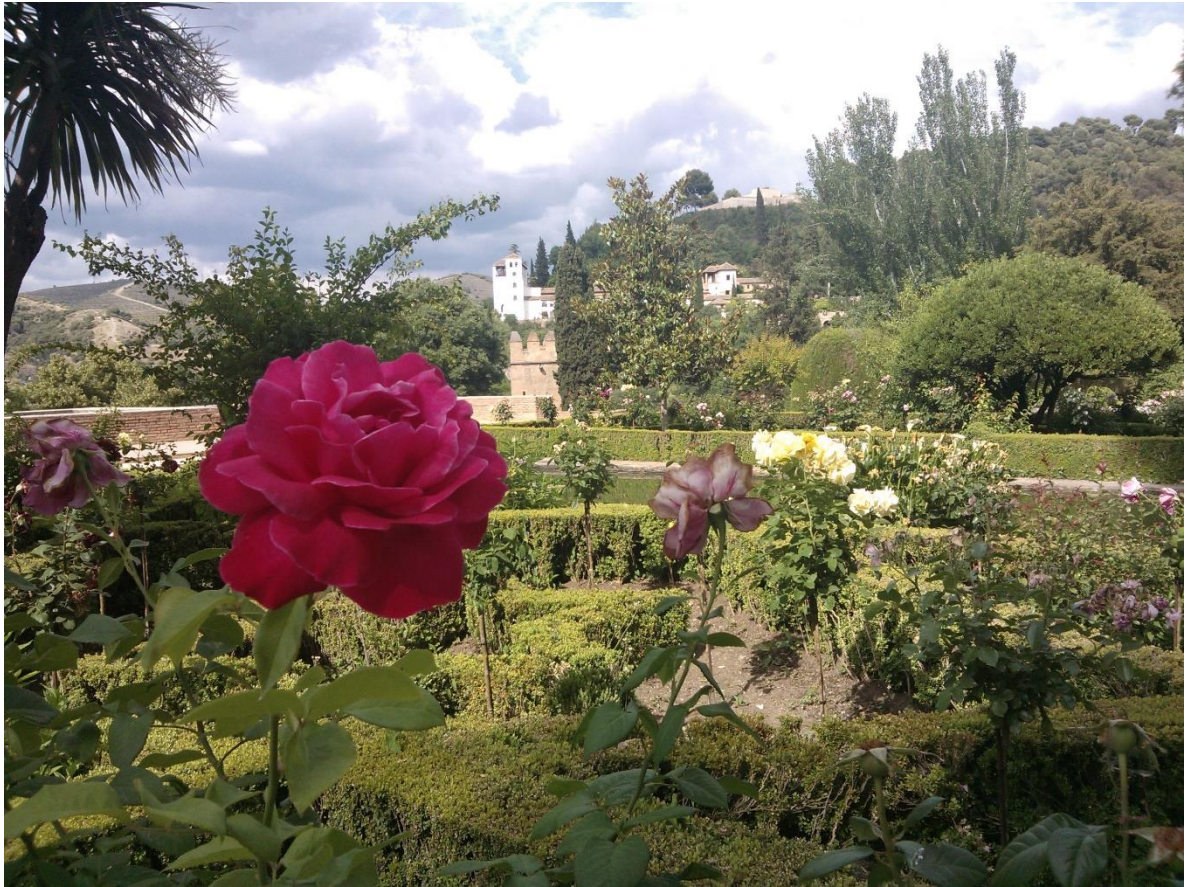
Segundo Premio: “La rosa del Partal” de Manuel Navarro.