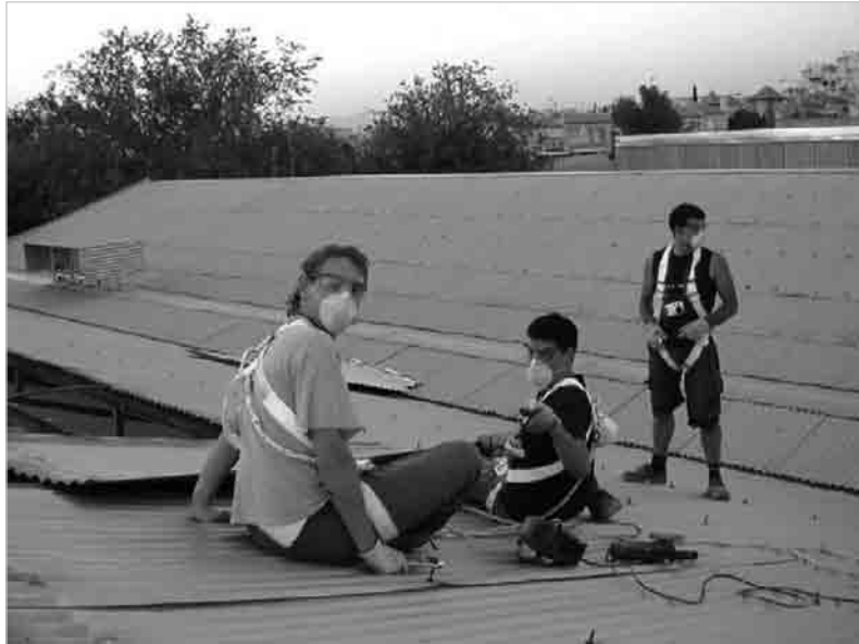
Figura 1 · Edificio Aulabierta , proceso de de-construcción y contrucción con materiales reciclados, en la Facultad de Bellas Artes de Granada, (2006).