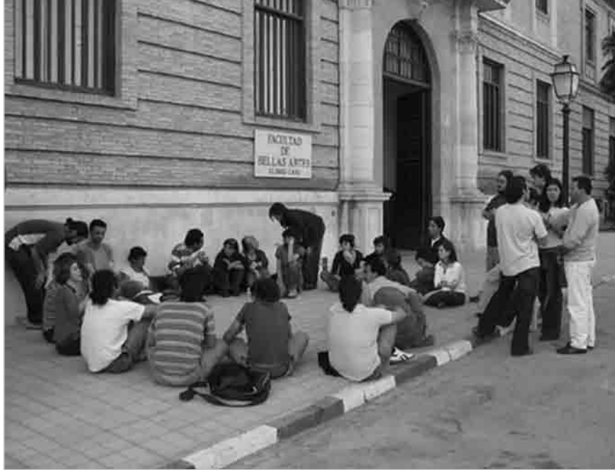
Figura 2 · Seminario Aulabierta , Facultad de Bellas Artes de Granada, (2006).