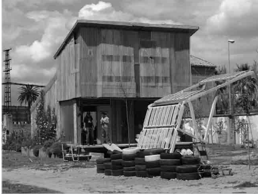
Figura 4 · Inauguración del edificio Aulabierta , autogestionado y autoconstruido con materiales reciclados en la Facultad de Bellas Artes de Granada, (2006).