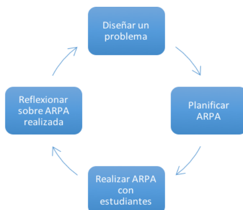
Figura 3. Esquema de las sesiones 5, 6 y 7 del Taller RPAula

Los videos obtenidos en las tres ARPAs filmadas se editan, seleccionando para cada uno de los docentes participantes, un episodio de uno a tres minutos, donde se pueda observar buenas prácticas como por ejemplo, estudiantes trabajando y discutiendo, el docente realizando una buena pregunta, etc. Estos episodios son presentados en las sesiones posteriores para la observación colectiva y para la discusión entre pares sobre buenas prácticas. En oportunidades se centra la observación en el docente y en otras en los estudiantes.