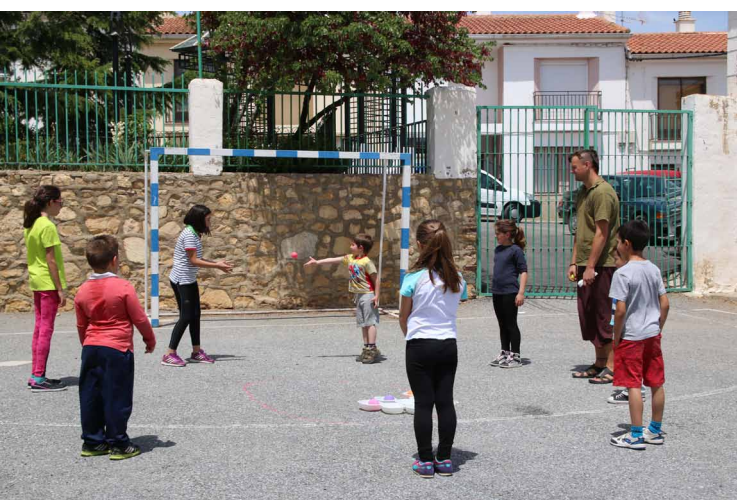
Imagen 2. Juegos sobre la importancia del trabajo comunero en el CPR Sierra Blanca. Lara Delgado Anés. Lugros.

Comienza con el aprendizaje sobre la importancia de la selección de la ubicación para construir el asentamiento, atendiendo a la proximidad a los recursos naturales. Estas decisiones no son arbitrarias por lo que debe razonarse su elección. El siguiente paso consiste en organizarse colectivamente compartiendo recursos y evitando conflictos, así como la importancia del trabajo comunero. Los últimos juegos se centran en comprender el funcionamiento y beneficios de estos sistemas de riego al entorno y a la sociedad, para qué sirven las acequias de careo, o los efectos de entubar y cementar las de riego.