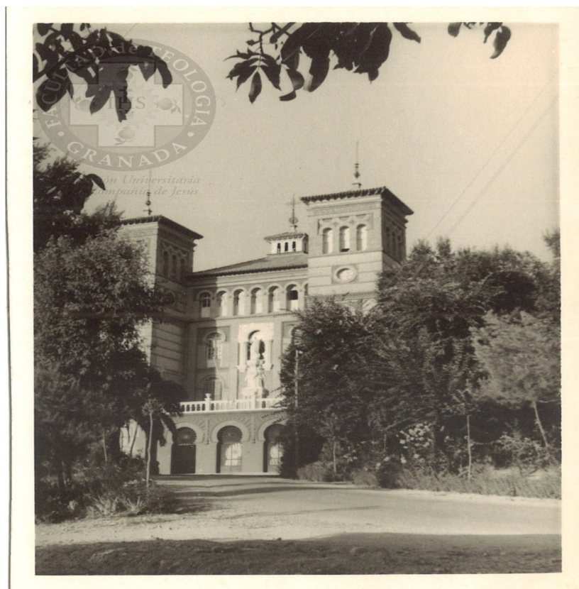
Imagen de la portada principal del Colegio Noviciado de la Compañía de Jesús. Tomada desde el camino que daba acceso al edificio