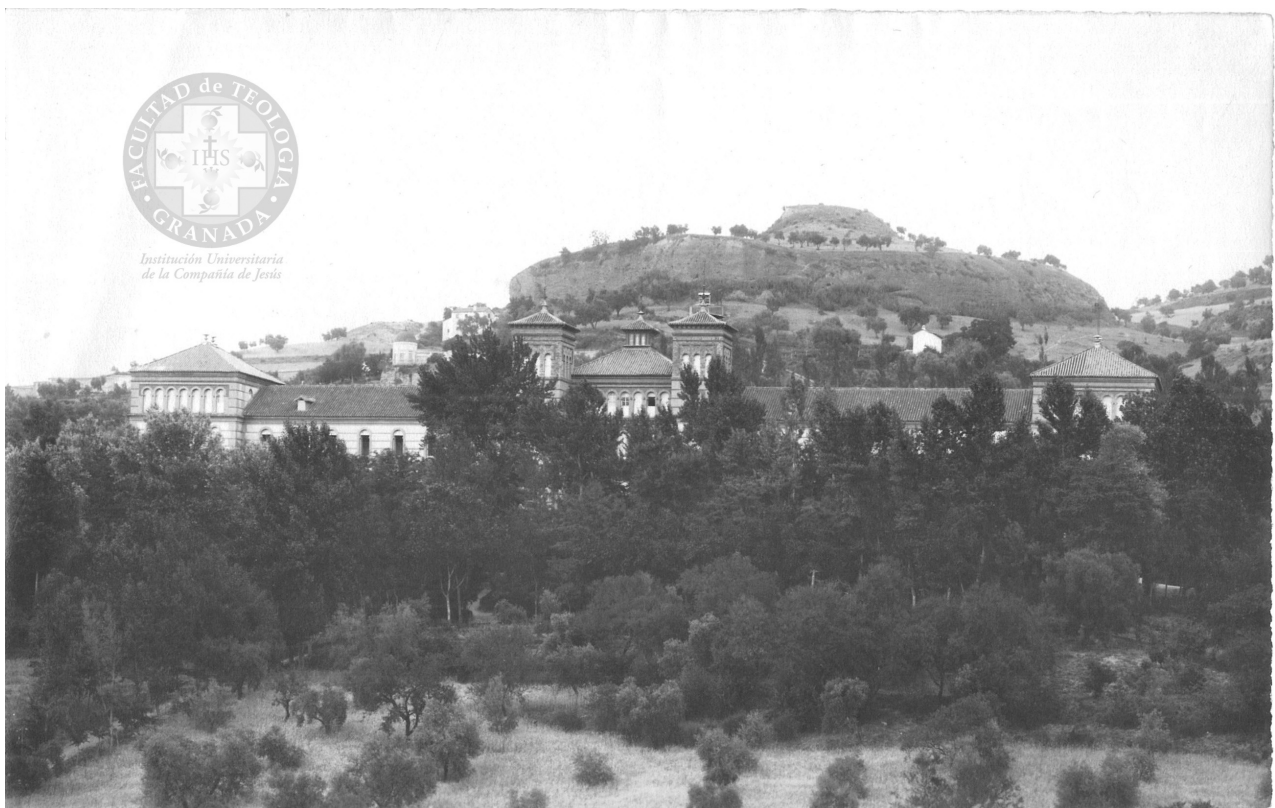
Imagen del edificio del Colegio Noviciado tapado por la arboleda. Tomada desde la torre del Monumento de la Cartuja