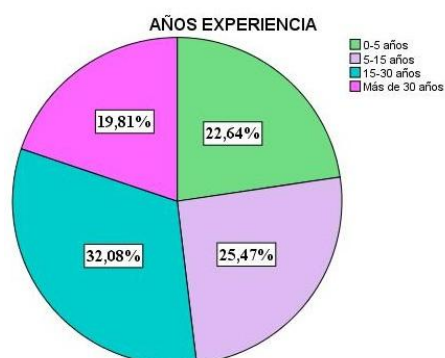
Figura 2: Distribución de la muestra en función de los años de experiencia de los docentes.