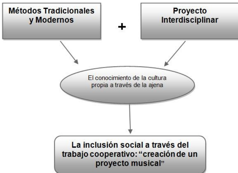
Figura 1. Síntesis del modelo de intervención Dum-Dum

La intención con la que ha sido creado el programa, es la de paliar los problemas de inclusión-interculturalidad en la escuela de primaria, debido principalmente a la diversidad en la procedencia de los estudiantes. Se trata de una metodología para el tratamiento de la inclusión, desde una perspectiva intercultural y de cohesión de equipos dentro del aula de primaria. Hemos tratado de realizar una sistematización del tratamiento de la música, y más concretamente del ritmo musical, como herramienta y no como finalidad en sí misma, para reforzar el sentimiento de unidad. Ellen (2010), expone la capacidad que tiene la música para fortalecer el conjunto de cada una de las áreas del trabajo en equipo, la identificación de objetivos comunes, el compromiso, la comunicación, el liderazgo, el apoyo social y la identidad como equipo.