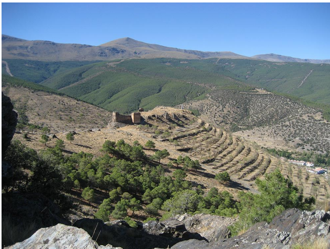
Vista castillo La cava y sierra al fondo con el Morrón del Lobo Puerto el Loh)