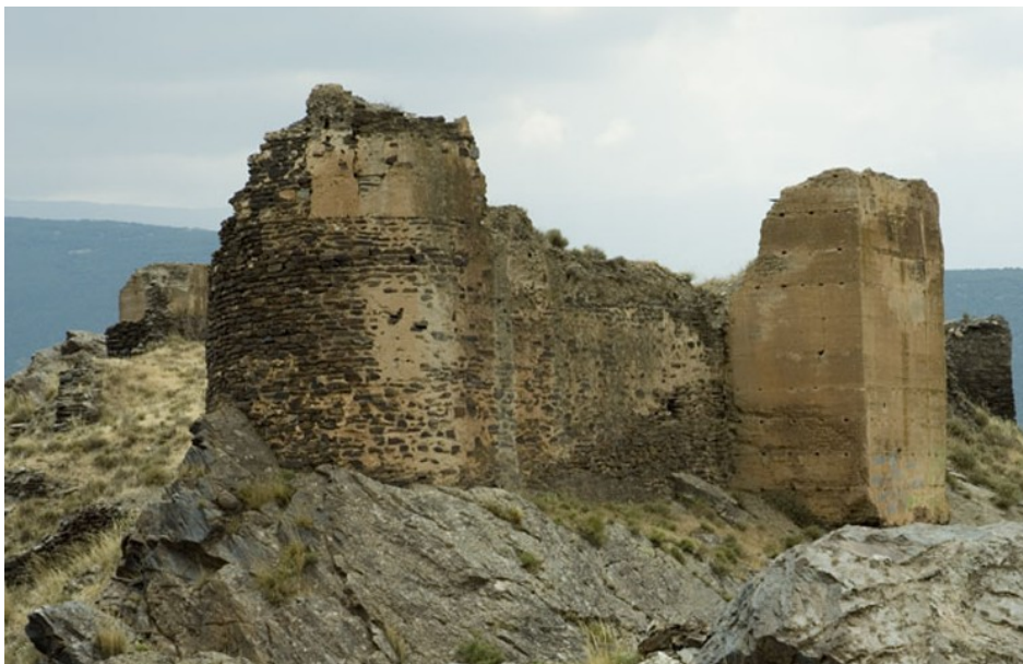
Castillo de La Cava de Aldeire