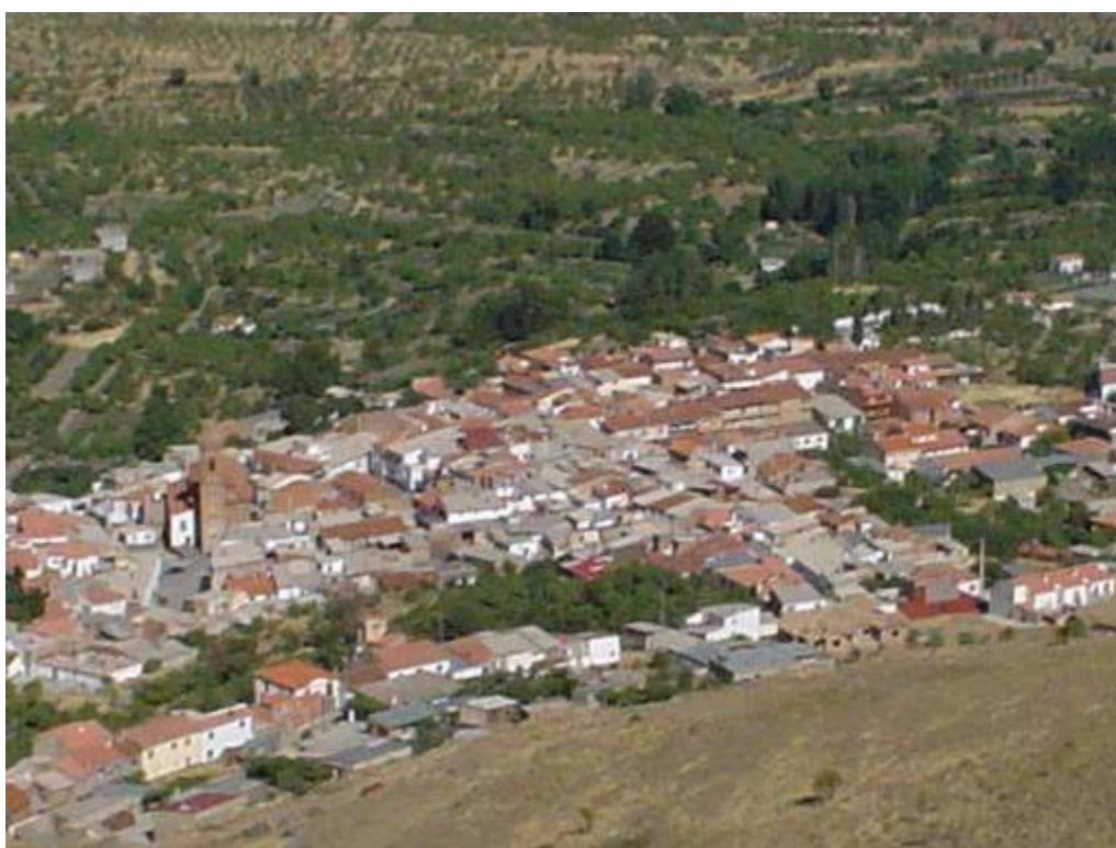
Vista parcial del pueblo desde el castillo