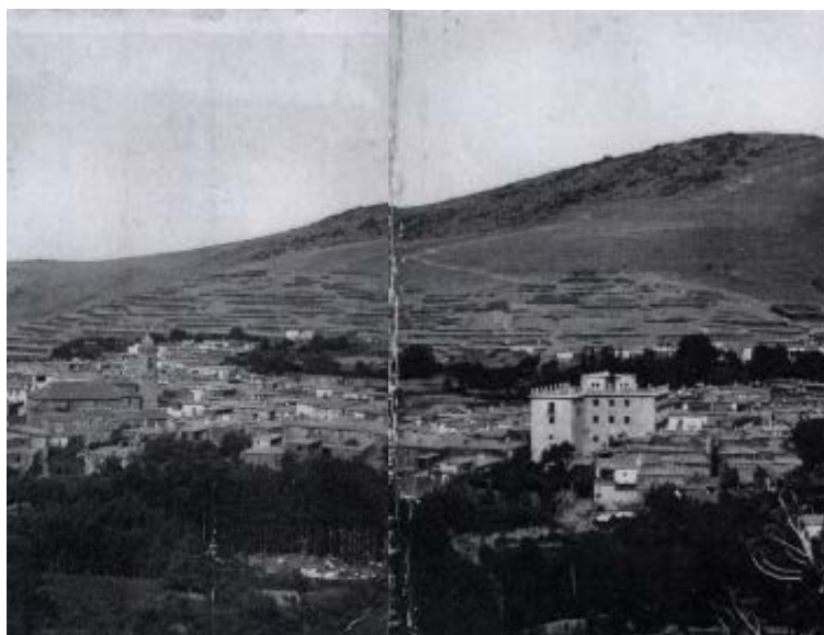
Foto antigua del pueblo