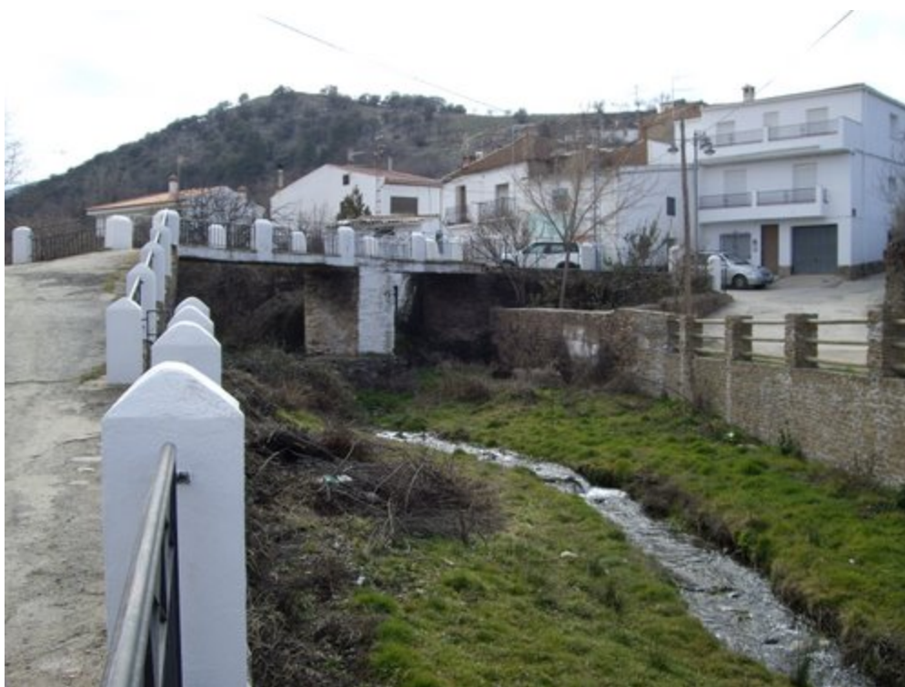
Puente de Triana