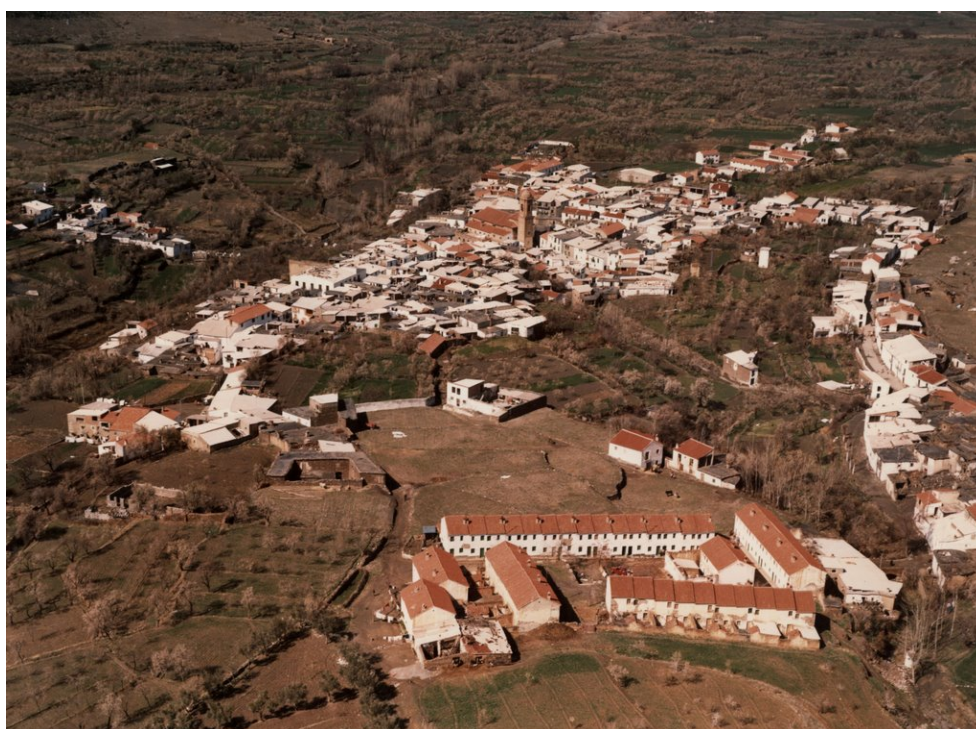
Vista del pueblo, en medio las eras de San Marcos