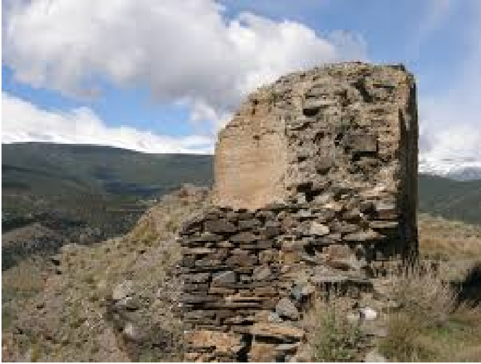
Castillo de La Cava