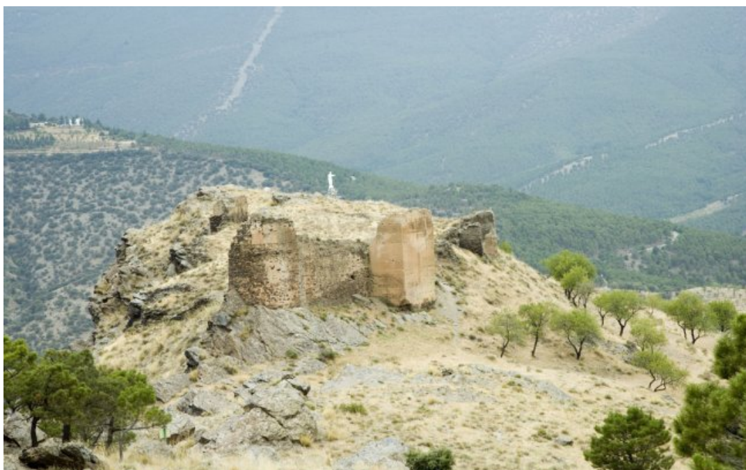
Castillo de La Cava