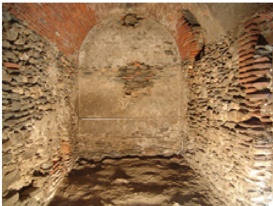
Interior de los baños