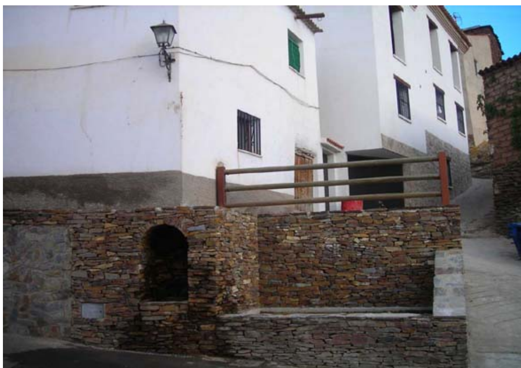
Fuente del Tiro, antes Fuente debajo de la Iglesia