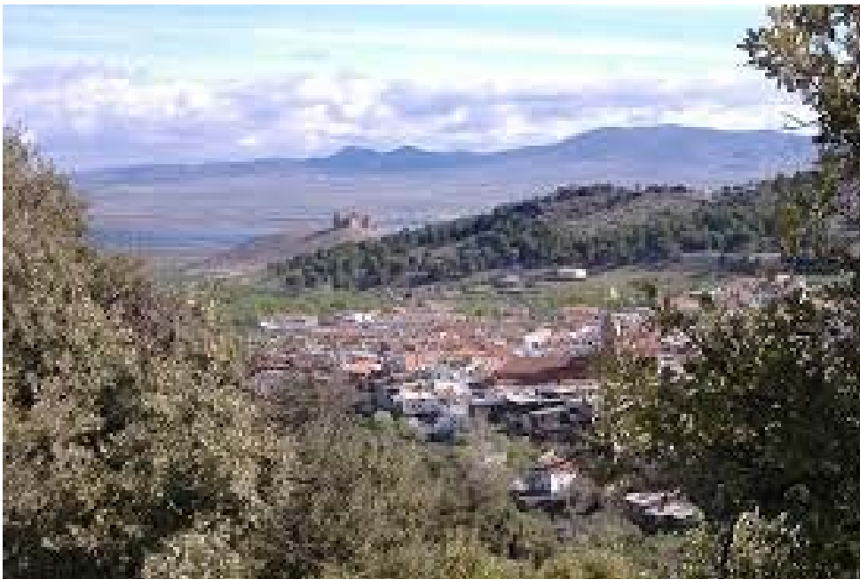
Vista del pueblo y castillo de La Calahorra al fondo