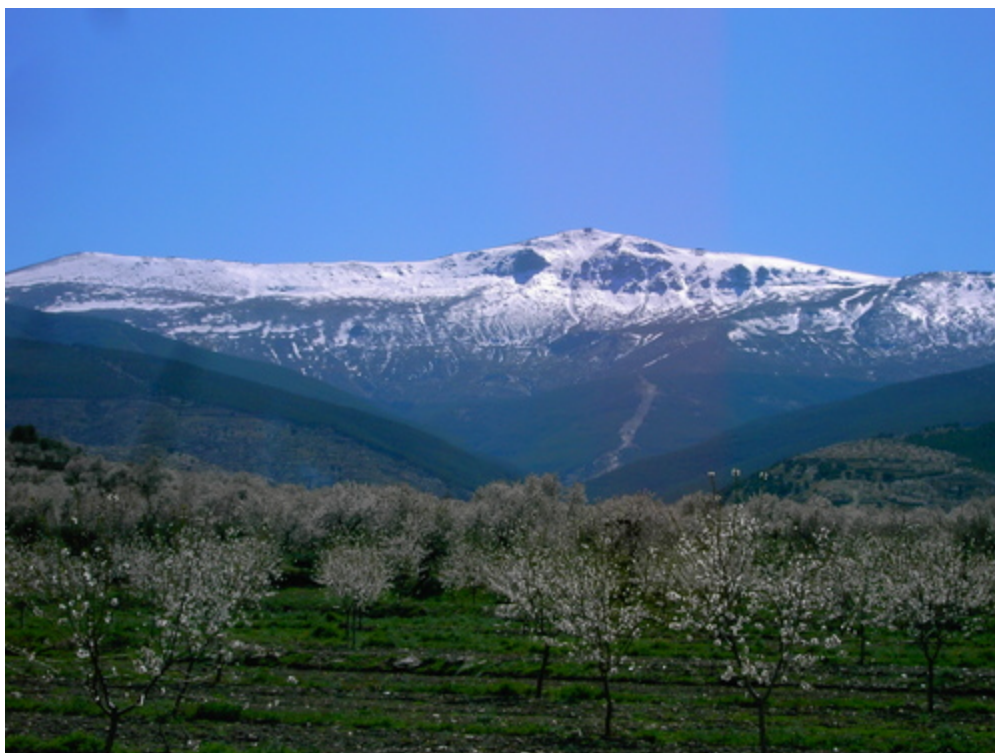
Vega de Aldeire con la sierra al fondo