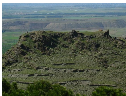
Otras vistas del castillo y pueblo desde la Loma de Luna