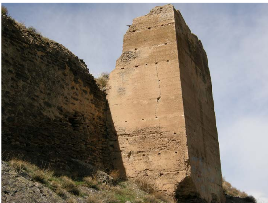
Castillo de La Cava de Aldeire