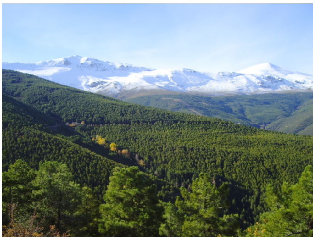
Monte de Aldeire y sierra al fondo