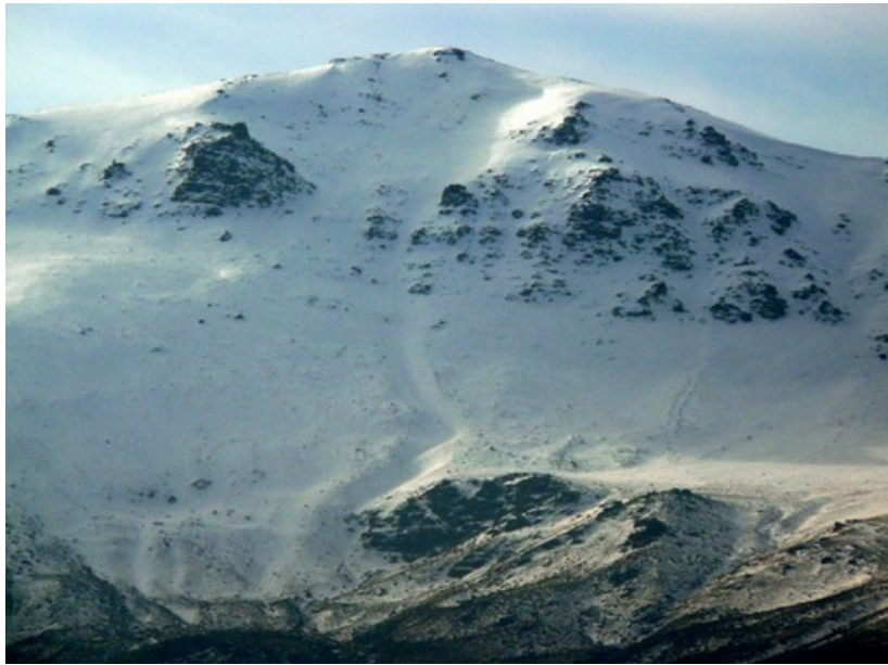
Morrón del Mediodía

Dasele una arroba de ziruelas en la suerte de Garçiañez