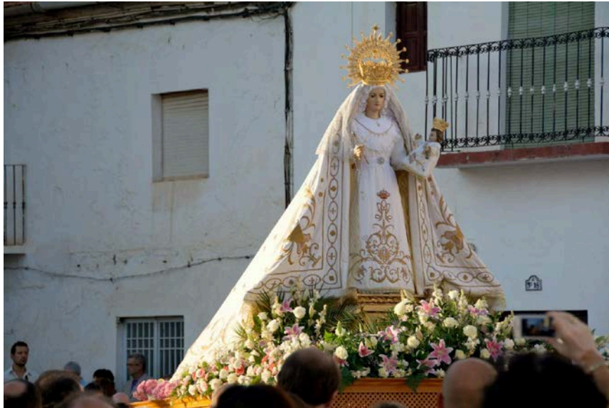
Virgen del Rosario, patrona de Aldeire