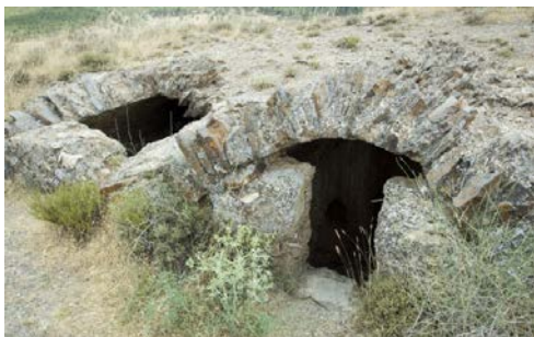
Aljibe del Castillo de la Cava