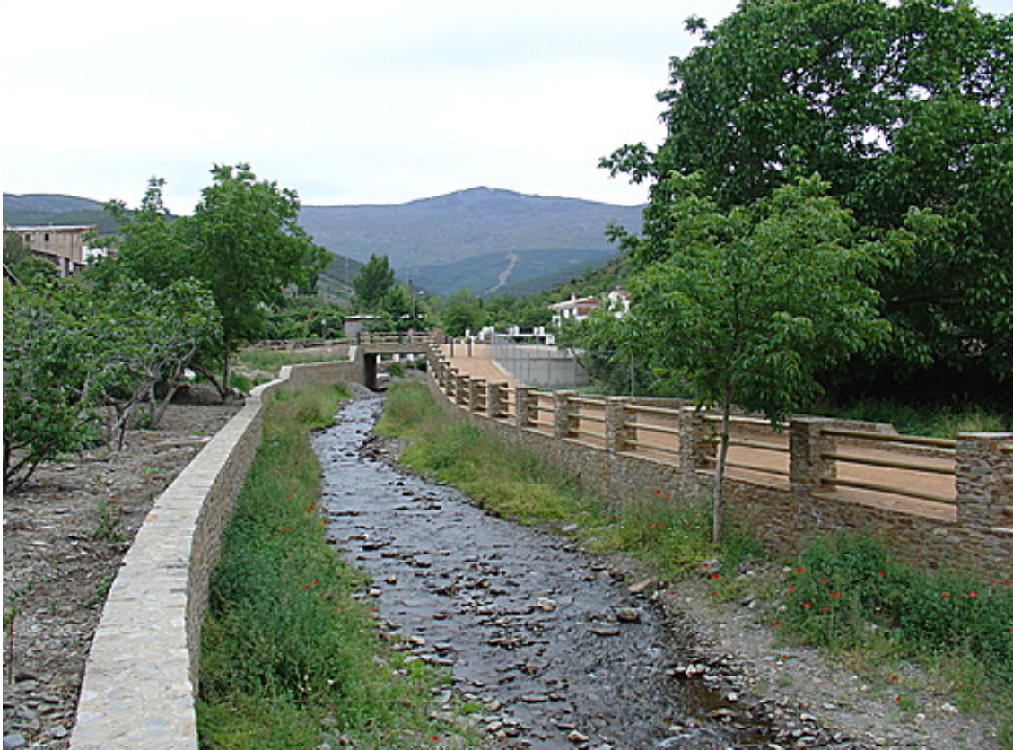
Río del pueblo