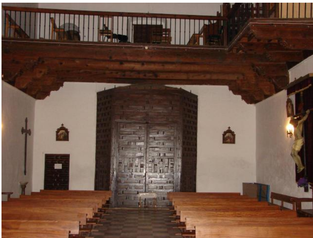
Interior de la iglesia y coro