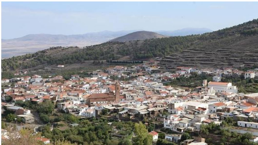
Otra vista del pueblo