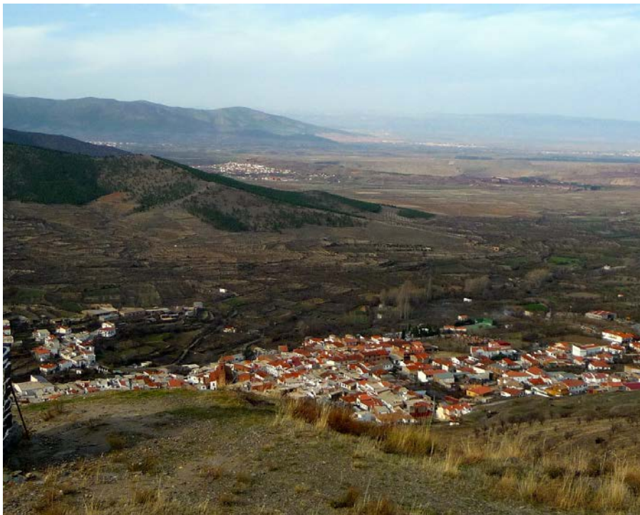
Vista del pueblo desde el castillo de la Cava