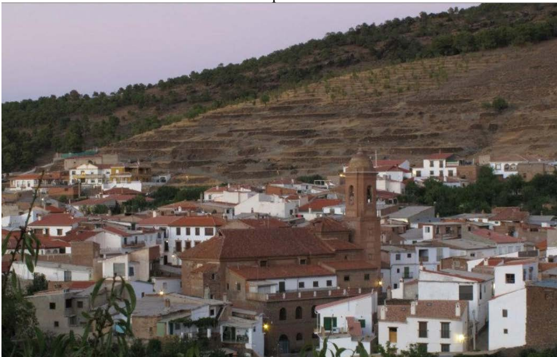
La Iglesia y las eras al fondo.