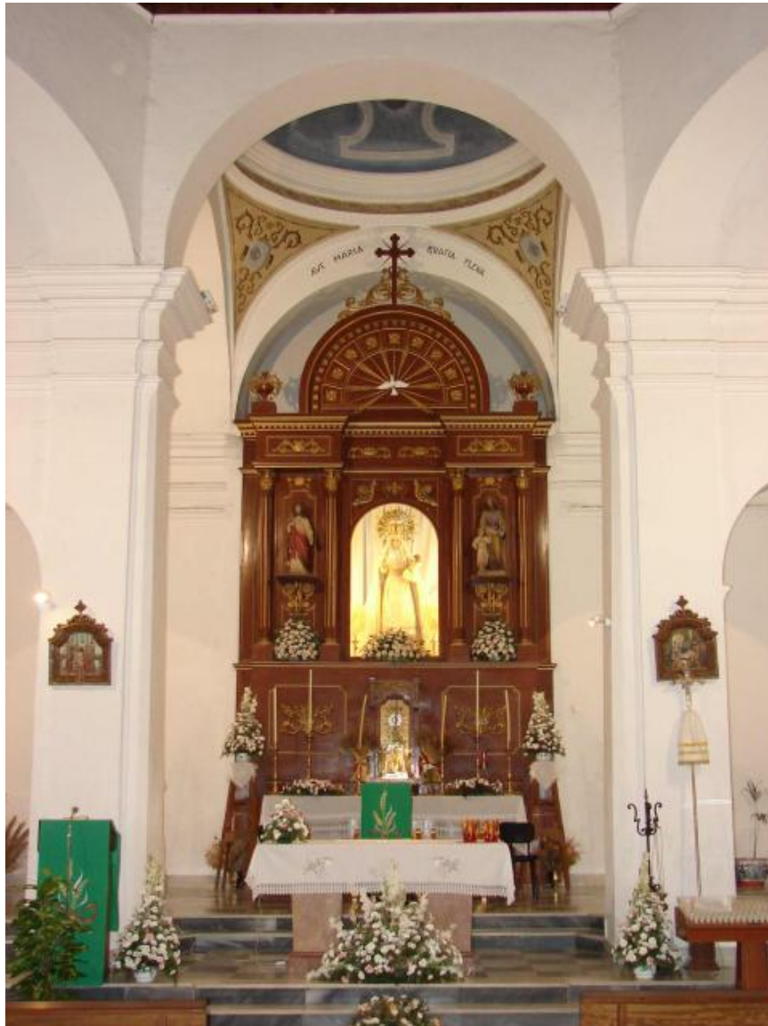
Altar Mayor con la Virgen del Rosario