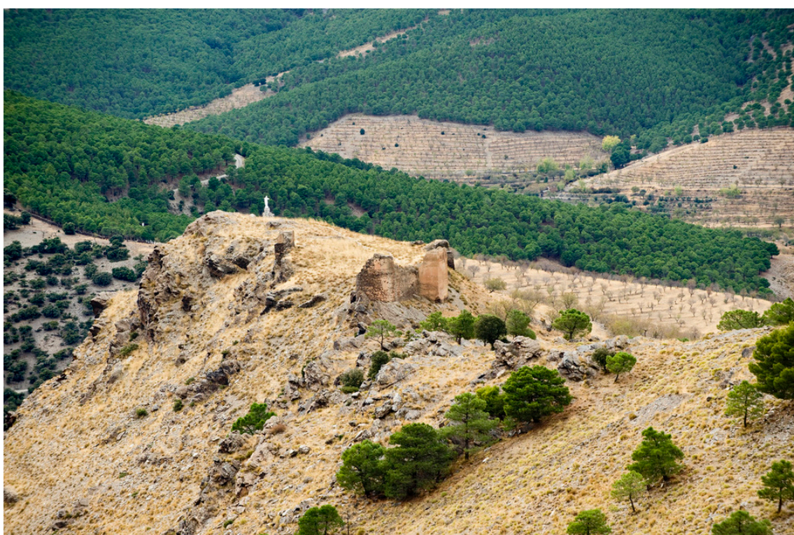
Vista del Castillo