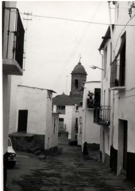
Calle Real y torre al fondo