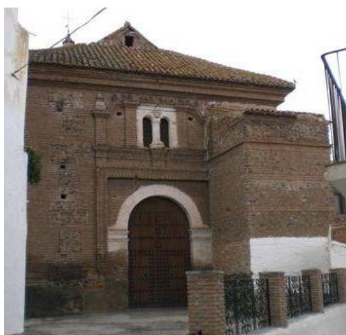
Puerta de la iglesia debajo del coro