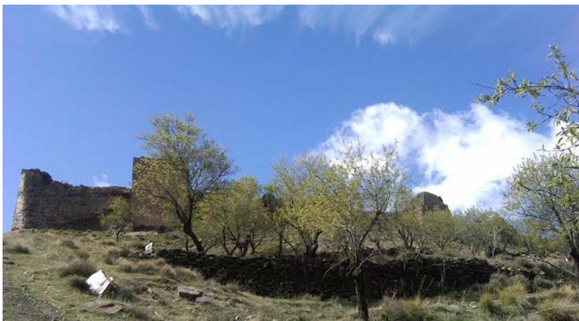
Vista del Castillo