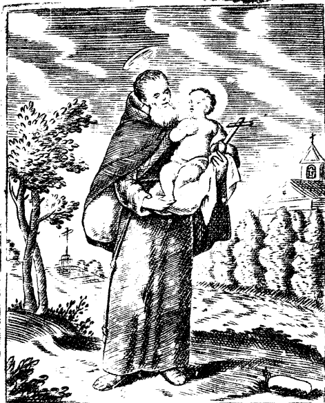
S. FELIX DC IN ILICIO

PRODIGIO DE LA NATURALEZA , HONOR magnifico de la Gravissima Religion Capuchina, à quien celebraron sus Glorias Canonizadas las Religiones, con la pretencia de CHRISTO SACRAMENTADO, y asistencia de el illustre Congreso de Señores Medicos Practicos, y Boticarios, el dia 26. de Mayo, en que concurrió la Solemnidad de Señor San Felipe Neri.